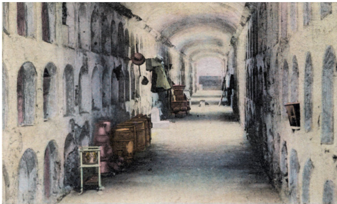
Galeria de Tobias

Галерея стала первым погребальным сооружением, воздвигнутым после закладки камня у главного входа.