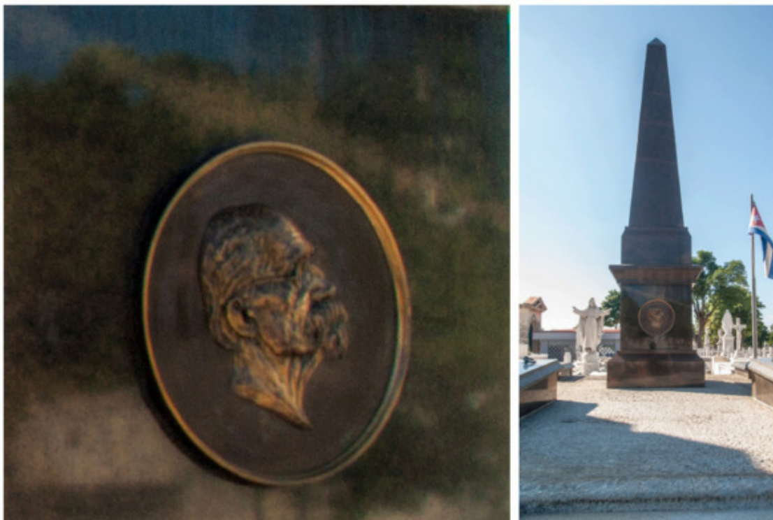
Tumba del Generalísimo Máximo Gómez Baez

Гробница одного из руководителей национально-освободительной борьбы кубинского народа Максимо Гомеса-и-Баэса расположена по правую сторону от центрального входа кладбища Колон (по направлению к Plaza Cristobal Colon).