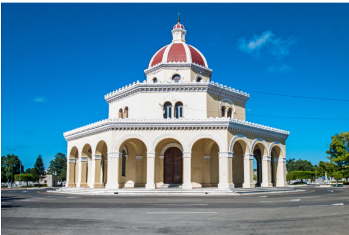
La Capilla Central del Cementerio de Colón

Центральная часовня кладбища Колон, возведенная на пересечении двух основных проспектов некрополя, была открыта 2 июля 1886 года. Это единственная в своем роде церковь на Кубе, имеющая восьмиугольную форму.