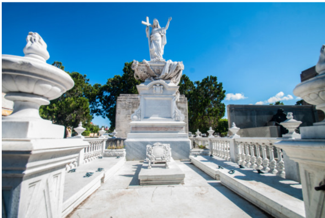
Panteón de los Condes de la Mortera

Этот погребальный памятник установлен на фамильном участке влиятельнейшей семьи графов Мортера, принадлежавшей к креольской аристократии XIX века. Скульптурный ансамбль Panteón de los Condes de la Mortera в эклектическом стиле выполнен из каррарского мрамора скульптором Марко Джаниннази /Marco Gianinnazi/.