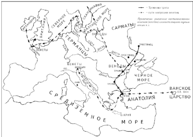
Схема исхода венетов из Малой Азии

Археологи установили, что в эпоху бытования в Среднем Поднепровье чернолесской культуры (X – VII вв. до н.э.) пашенное земледелие становится ведущим в системе хозяйства, на смену привозной, и потому малоупотреблявшейся, бронзе приходит выплавка железа из местной болотной и озерной руды. Использование железа произвело подлинный переворот в хозяйстве и военном деле местных племен. Люди, жившие практически в каменном веке, сразу вступили в век металла. У нас есть все основания предположить, что экономический скачок в развитии жителей Поднепро-