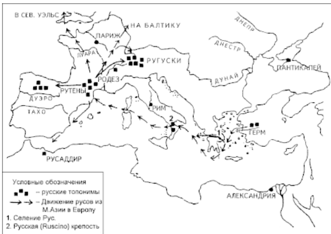
Движение русов и места их расселения. Сост. Е.В. Кузнецов, А.Е. Кузнецов

В латинской традиции циклопов называли сикулами, от их имени произошло название острова Сицилии (Сикелии). Помимо сикулов в числе древнейших обитателей Италии упоминают также лигийцев, или лигуров (это ликийцы!). Ранее мы уже говорили о ликийцах, проживавших во II тыс. до н.э. в Малой Азии и перебравшихся туда с Крита. Но другая часть этого народа, известная античным историкам как лигии, переместилась в Европу. Лигии проживали в Верхней Италии и Южной Франции, на Балеарских (Белоярских!) островах, Корсике и Сардинии (впоследствии их вытеснили отсюда кельты). Да-да, можно совершенно определенно говорить о проникновении морской цивилизации ариев вплоть до восточного (средиземноморского) побережья Испании.