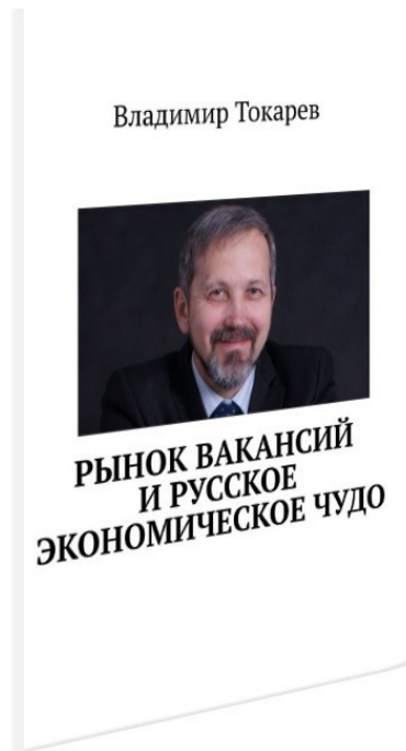
Рис. 2. Книга, отрывок из которой представлен ниже.