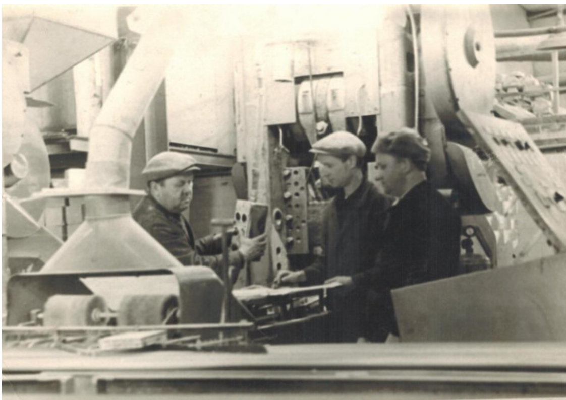
На керамико-плиточном заводе