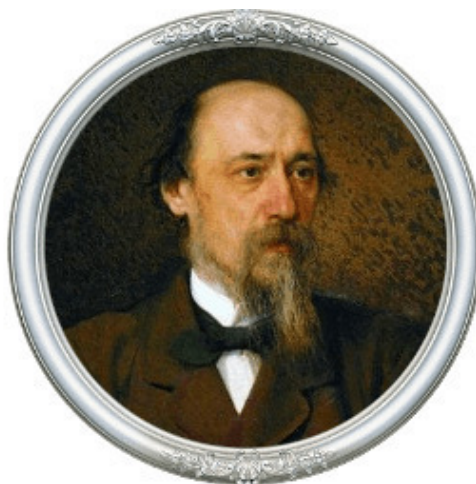
Н. А. Некрасов

Лев Иванович Катуар (1827—1899) – основатель одноимённого пристанционного посёлка (1901 г). Поселению в годы строительства завода огнеупоров в 1929—1933 присвоено имя поэта Н. А. Некрасова (1821 – 1877) как одного из ведущих революционных поэтов своего времени, что гармонирует с политическим и общественным настроением 30-х годов 20 века в СССР. Названия присваивались решениями Советов рабоче-крестьянских депутатов и утверждались органами местной власти. (Топонимический словарь «Географические названия Московской области»)