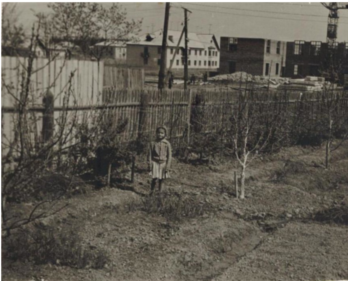
На фоне строящегося ДК Керамик