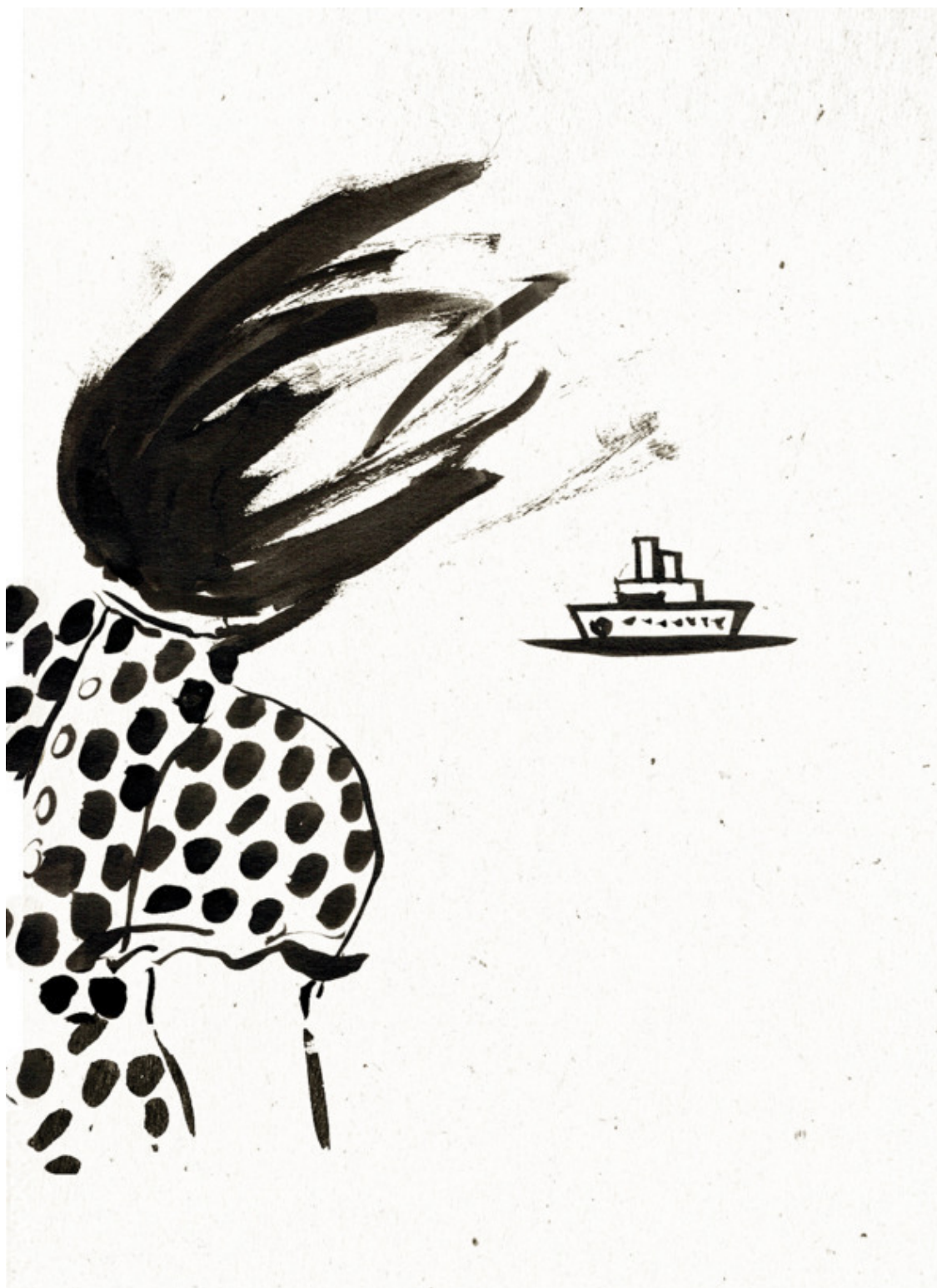
Посвящается моей маме