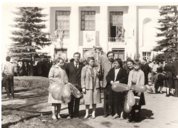
Праздник 1 Мая у ДК Керамик