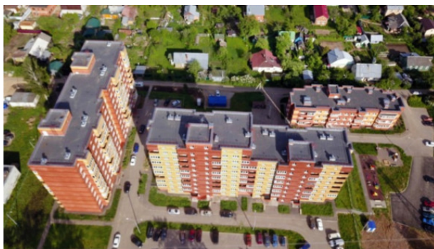
Современный Катуар — Некрасовский. Ул. Л. Толстого, 2018