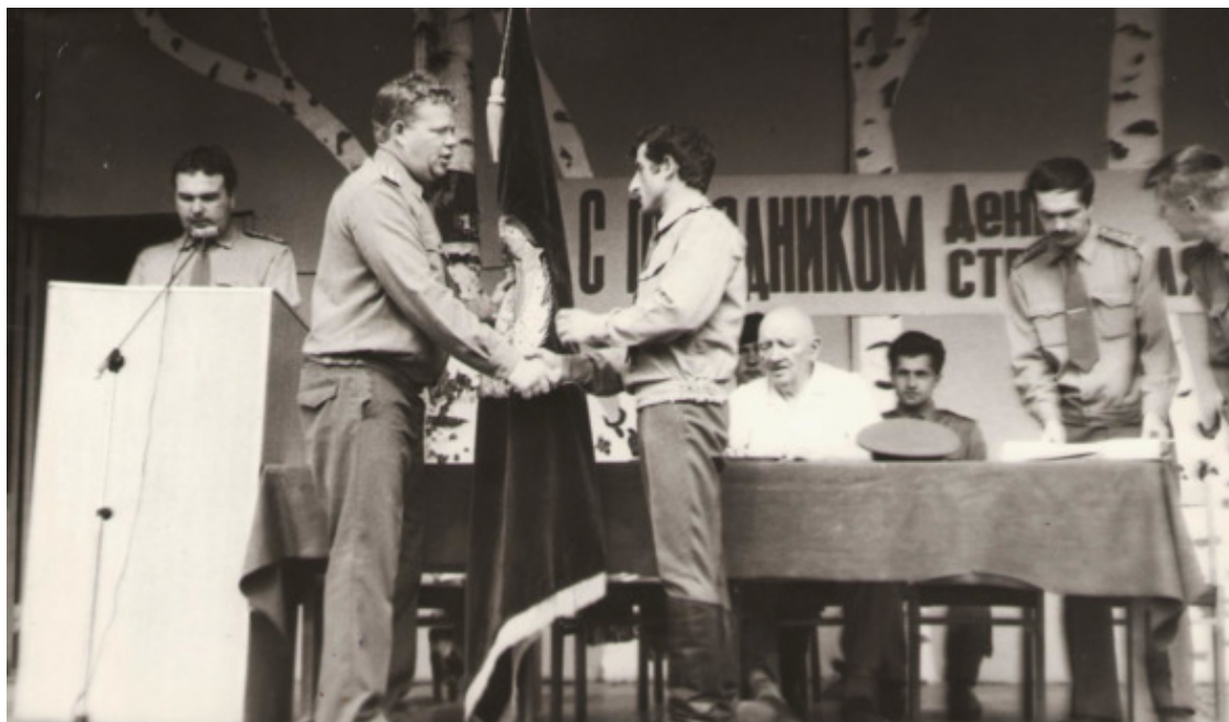
Военная часть была одна из лучших в Вооружённых Силах. На фото – части вручают переходящее Красное знамя за отличную работу и службу