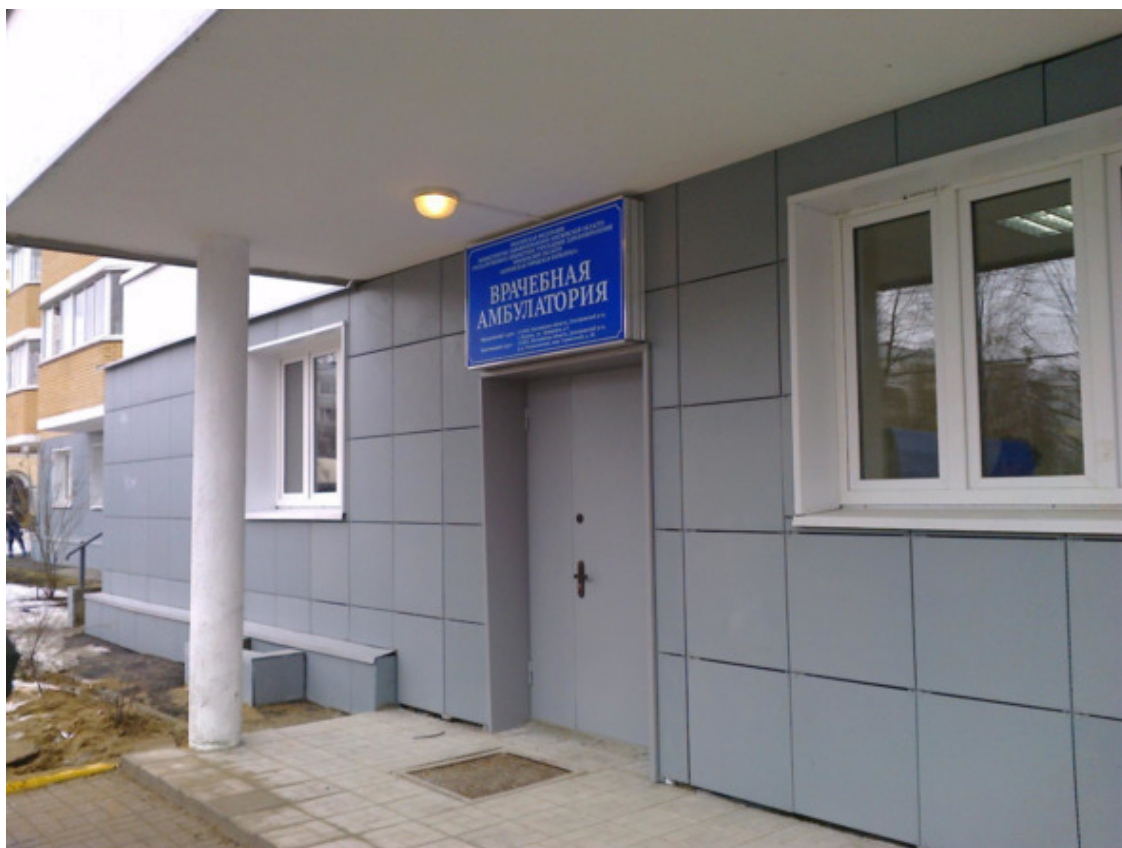
Врачебная Амбулатория в мкр Строителей