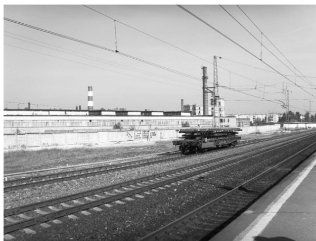
Катуаровский керамико-плиточный завод, вид с жд платформы Катуар