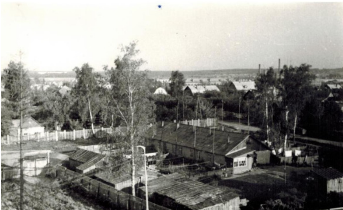
Катуар послевоенный (1960-е гг)