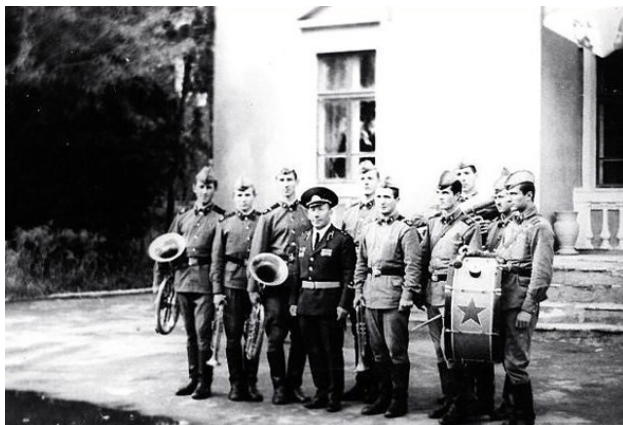
Военный оркестр у Дома офицеров