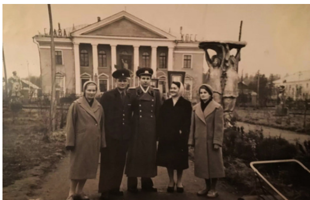
У Дома офицеров стояли скульптуры и вазы, в парке играл оркестр и танцевали жители.