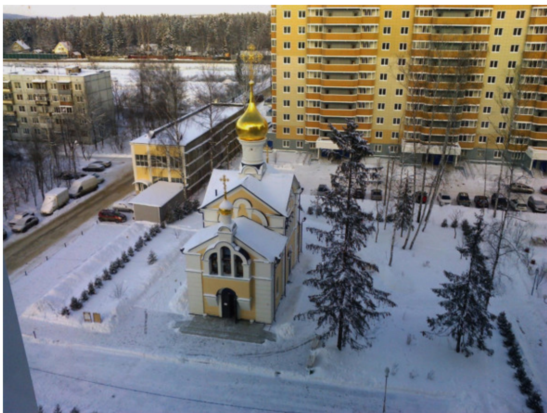
Современный мкр Строителей (ЖК Некрасовский)