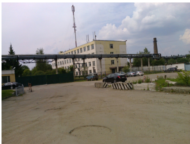
54 Промкомбинат Министерства обороны