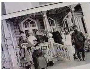
Имение семейства Катуар в д. Саморядово

В настоящее время Некрасовский успешно развивается, строятся новые дома, на высоте культурная и спортивная работа.