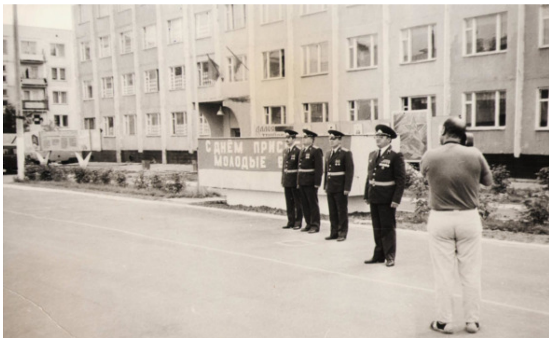
Построение перед новой четырёхэтажной казармой