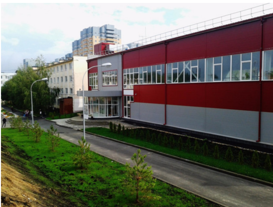
Черновская школа с ФОК