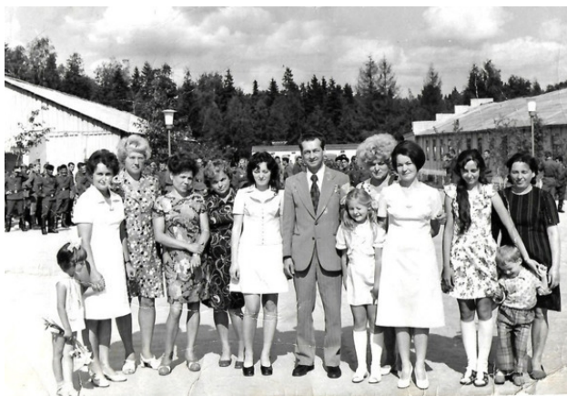
В городок приезжали знаменитые люди. На фото —космонавт Севастьянов