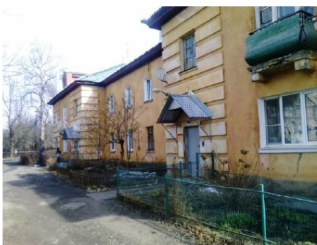
Дом №1, тут в 1952 г был и штаб части, и жили семьи военнослужащих.

Так городок жил до 2012 года, пока в/ч 11291 тоже не перевели за городок. Поэтому городок открыли (сюда свободно можно зайти любому человеку) и передали под управление администрации Дмитровского района. Сейчас разрабатываются планы по строительству в городке новых домов, и появлению опять школы, поликлиники и спортивных объектов.