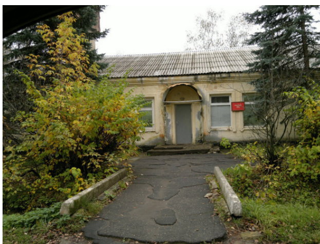
Санчасть, здесь всех лечили