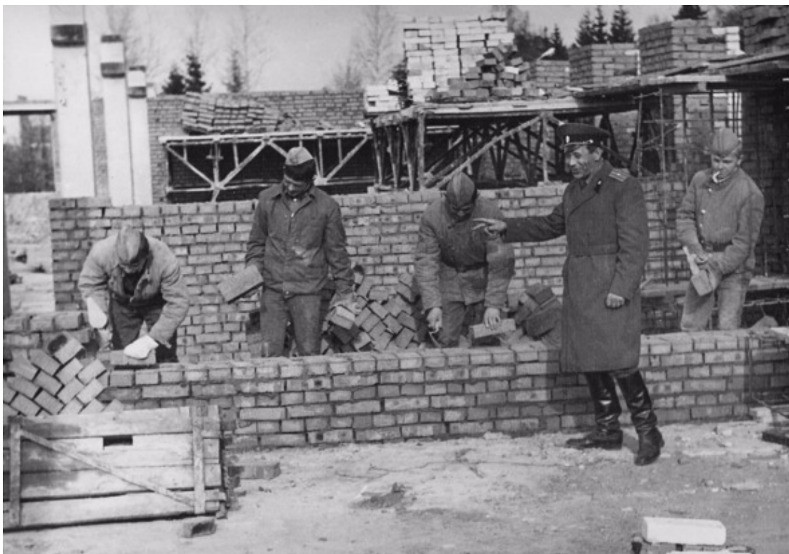
Идёт строительство городка и завода