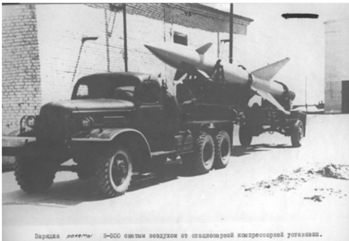
Ракета на технической позиции в Трудовой (3 км от городка)