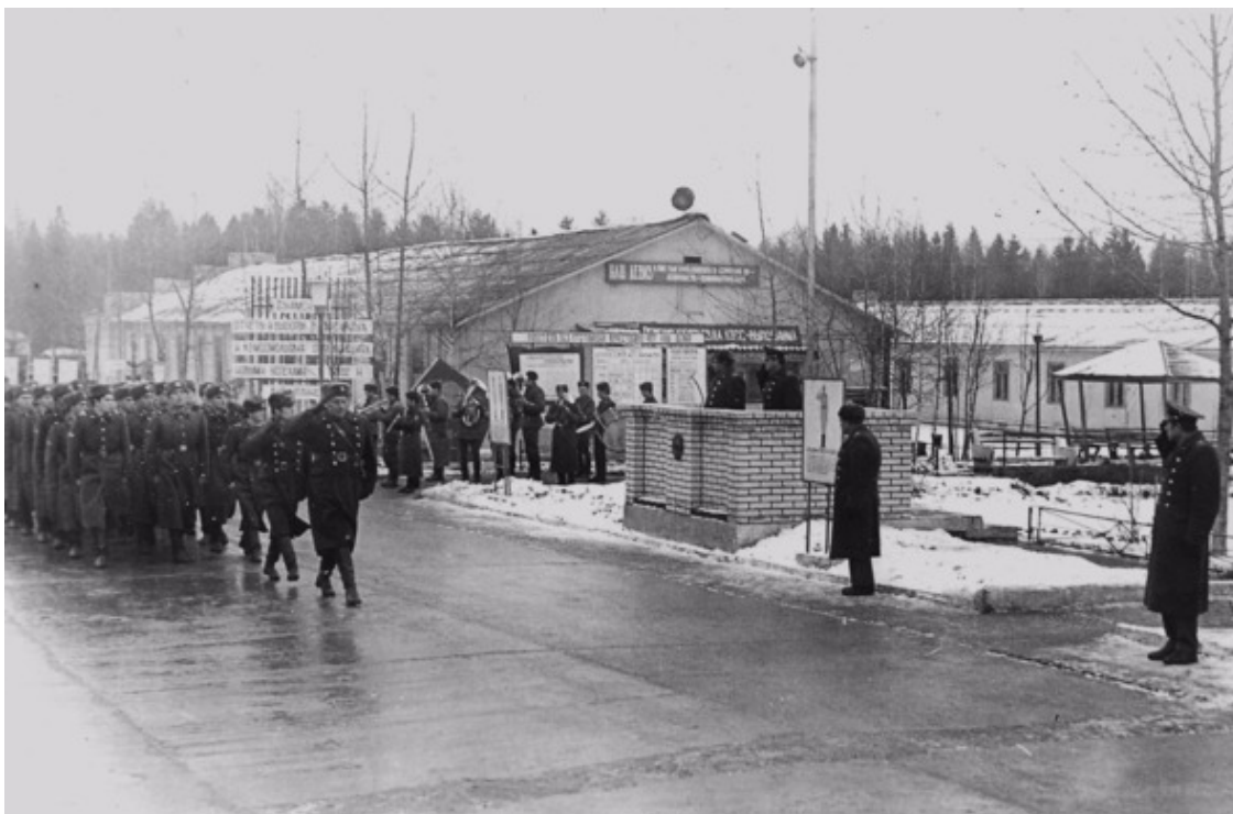
В казарменно – барачном военном городке Строителей. Торжественное прохождение военно-строительной части