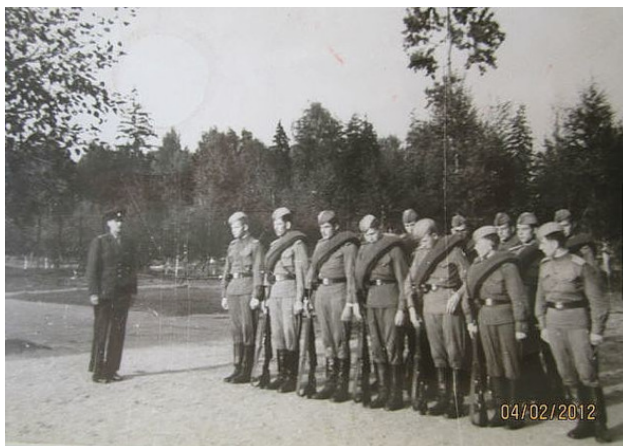
Солдаты перед заступлением в караул