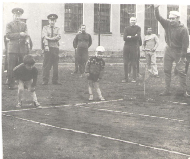
На стадионе каждые выходные проходили спортивные соревнования военнослужащих и их семей