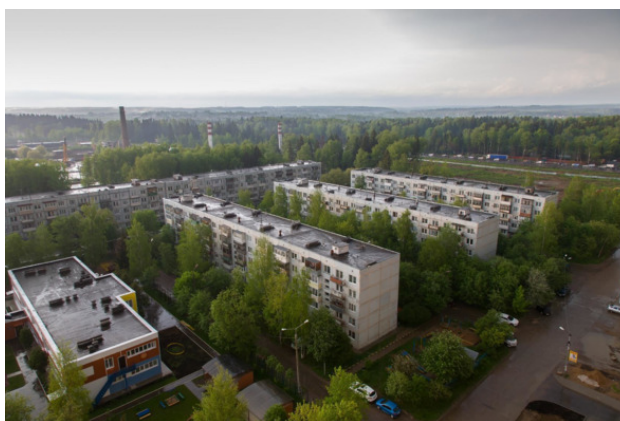
Пятиэтажки и детский сад