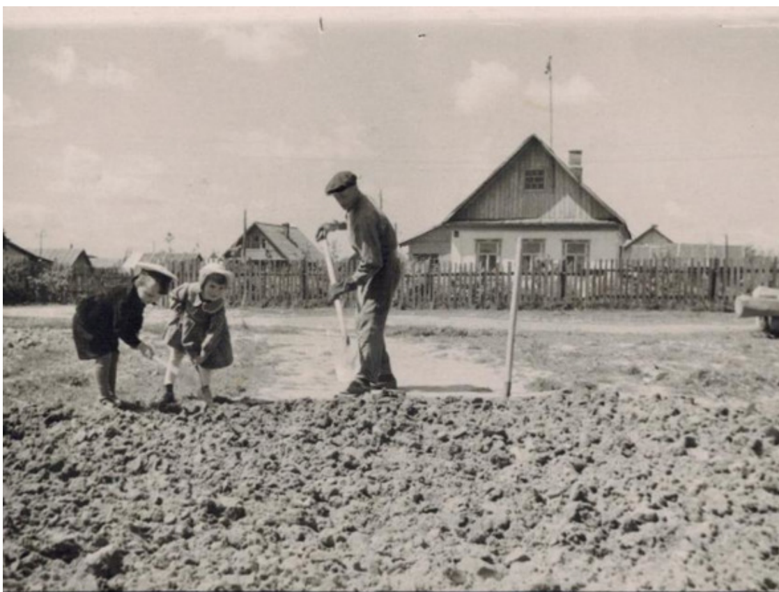
Катуар послевоенный (1960-е гг)