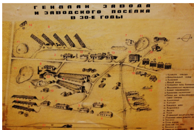
Генплан Катуара в 30-е годы