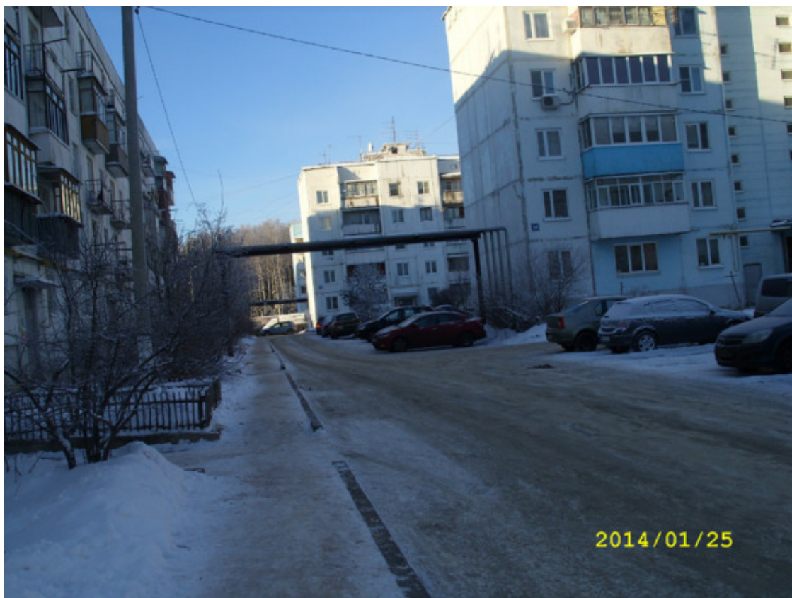
Современный военный городок – микрорайон Трудовая