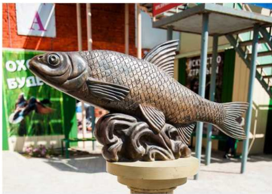
Фото. Памятник вобле

Во бла (лат. Rutilus caspicus ) – вид лучепёрых рыб семейства карповых.