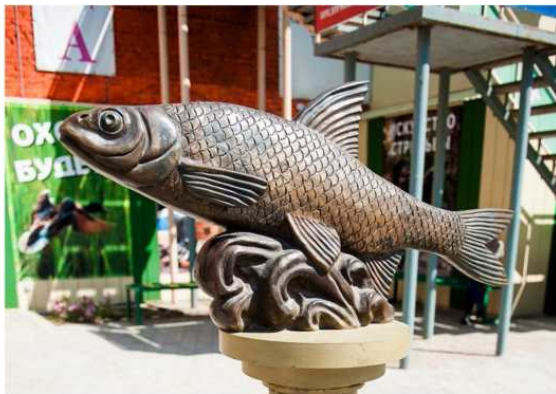
Фото. Памятник вобле

Во бла (лат. Rutilus caspicus ) – вид лучепёрых рыб семейства карповых.