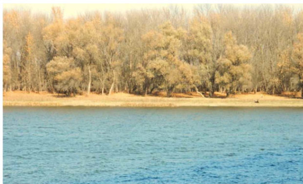
Фото. Прямая Болда

Длина реки – 74 км. Болда отделяется от Волги в районе Астрахани 14-ти километровый участок реки входит в систему водных путей России (с 5 по 19 км). Болда оканчивается чуть выше села Тузуклей, разделяясь на протоки: Тузуклей, Болдушка и Трёхизбенка