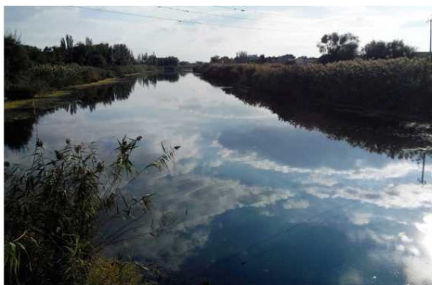
Фото. Ерик Напрасно Ерик пытал

О том, почему ерик называется ериком, рассказывает эта легенда. Было это во время правления хазарского каганата. В одном хазарском роде жил юноша по имени Ерик. Однажды, после удачного набега, родичи стали делить добычу, и поссорились.