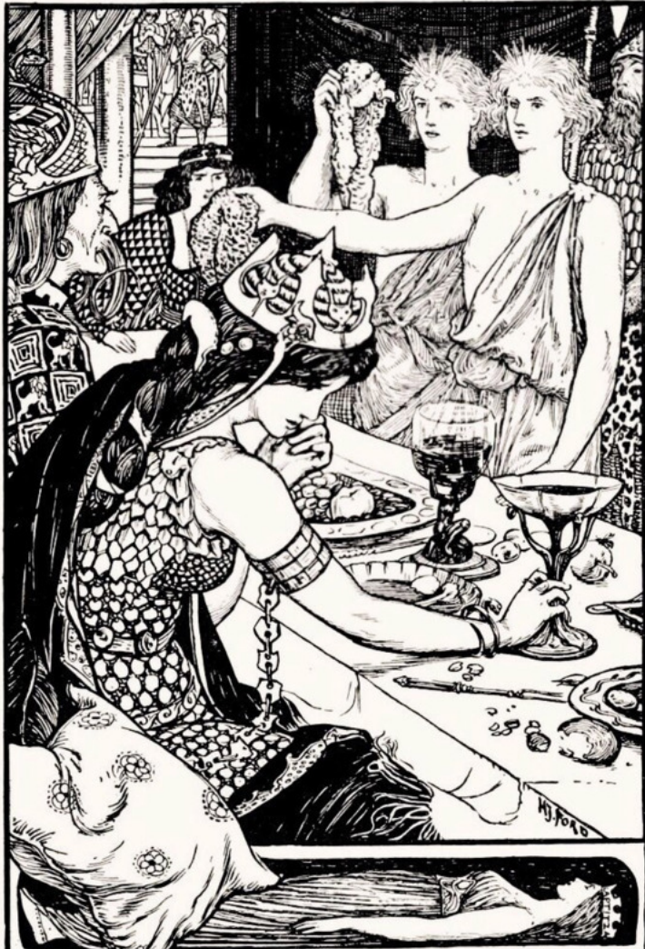
THE BOYS WITH THE GOLDEN STARS