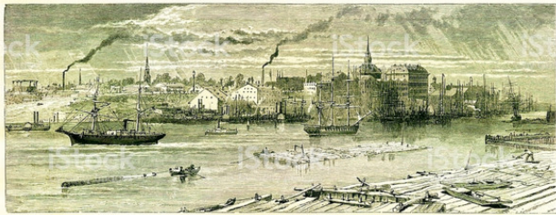
View of Savannah from the River.