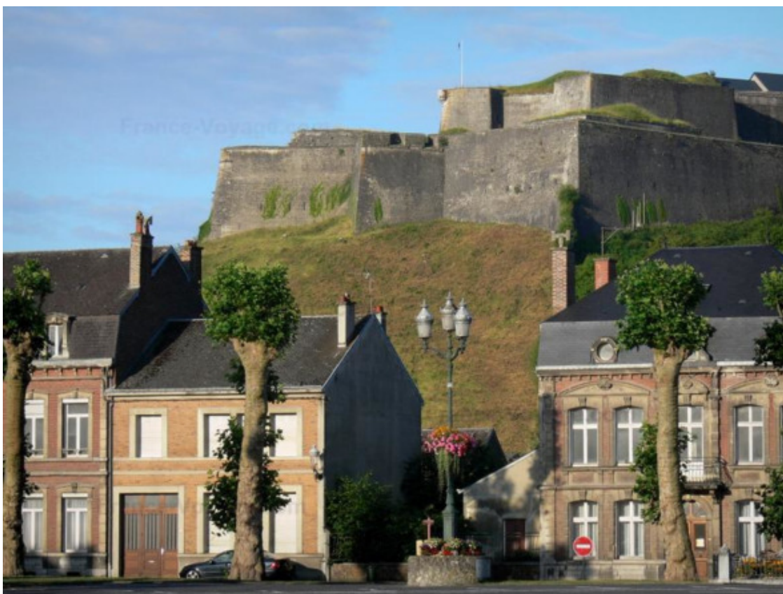
коммуна (и крепость) Живе

Повествование сразу начинается с 1770 года, когда семнадцатилетний юноша поступает волонтером в полк Нормандской инфантерии, что располагался на тот момент в Живе (регион Шампань-Арденны).