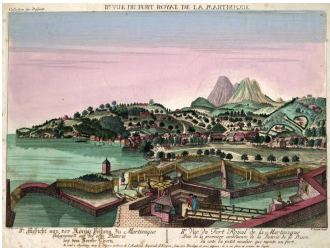
Форт-Рояль на старинной гравюре

Сначала, 3 сентября, на Доминику был послан один из эмиссаров де Буйе, в чью задачу было выяснить, не стоит ли на якоре у острова Британский Флот, сам гарнизон Доминики состоял из 100 человек, что были распределены по острову.