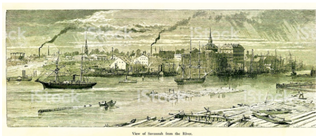
Саванна на гравюре XIX века

Здесь, во время генерального штурма Саванны, 9 октября 1779 года, французов постигла та же неудача, что и на острове Санта-Люсия, но при этом вдобавок был ранен сам адмирал де Эстен.