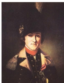
маркиз де Ла Руэри

Но и задолго до заключения договора, в 1777 году множество французских добровольцев отправились за океан сражаться за независимость Америки. Среди них был в частности маркиз де Ла Руэри будущий основатель «Бретонской ассоциации», что уже в начале нового, 1777 года садится на, подчеркну это обстоятельство, именно американский корабль, в городе Нанте и отплывает в Новый Свет, на встречу, приключениям.