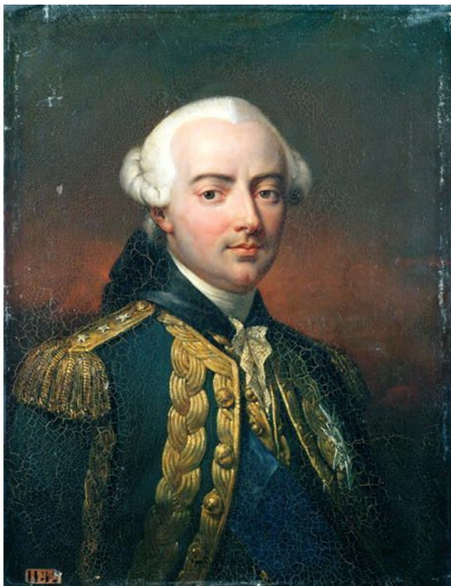
Жан-Батист Шарль-Анри Эктор, граф д'Эстен

Одновременно в Вест-Индию прибывает британский флот под командованием адмирала Вильяма Хотэма и 14 декабря захватывает французскую Санта-Люсию (Сент-Люсия). От Санта-Люсии до Мартиники расстояние всего 66 километров! По словам де Терсье под рукой адмирала было 18 000 человек прибывших в Новую Англию, шевалье де Лико, губернатор Санта Люсии имел под рукой гарнизон всего из 300 человек. Причем треть французского гарнизона была больна, болотная лихорадка была бичом этих мест. (Стоит отметить, что под рукой де Буйе было всего 5000 человек)