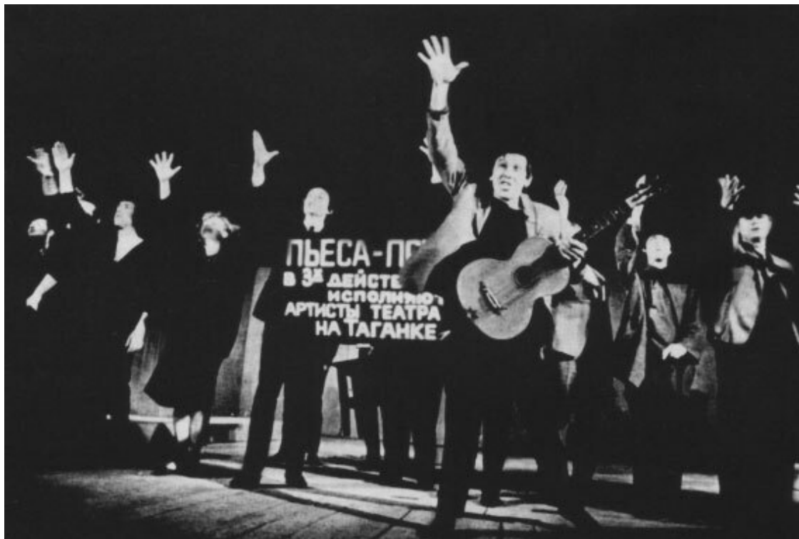
Добрый человек из Сезуана (1964): Сцена из спектакля

Действие первого любимовского спектакля началось... с изложения «эстетической программы театра». Сейчас нас интересует не ее содержание, мало что раскрывающее в реальной эстетике Таганки, а только сам факт размышлений театра о театральном искусстве. В момент после мгновенного отключения света на краю подмостков появилась группа актеров. Один из них под аккомпанемент двух гитар и аккордеона «воинственно и задорно (...)» говорит о том, что время от времени надо искать театр, корни которого уходят в жизнь улицы – повседневный, тысячелик земной театр, – и предупреждает нас, что именно такой театр нам сейчас будет показан (...), он снимает фуражку и почтительно кланяется Брехту (портрет которого справа на авансцене – О. М.). Все теперь стоят подтянутые, резко повернув головы к портрету. Минута молчания – дань уважения автору, – и спектакль начинается» [47, 144–145]. Все верно в этом описании. Кроме одного: «и спектакль начинается». Нет, спектакль уже идет.