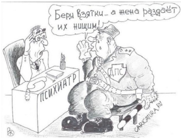
Карикатура «Горе», Валерий Каненков