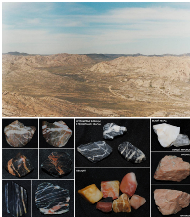
Кряж Букантау близ Учкудука и галька, собранная в окрестной пустыне.

На новом месте службы свободы было несколько больше. Удавалось найти время добраться до гранитного кряжа и побродить по его «инопланетным» ущельям. Среди моих находок были отполированные ветром гальки кварца, полевого шпата, разноцветного кварцита, кристаллики горного хрусталя, вкрапления граната в обломках розового гранита. Признаков золотого оруденения мне не встречалось. Позже удалось узнать, что золоторудные тела здесь концентрируются не в гранитах, а в чёрных кремнистых сланцах. Эти сланцы слагали покатые сопки, увенчанные протяжёнными гребнями, которые располагались к востоку от гранитного кряжа.