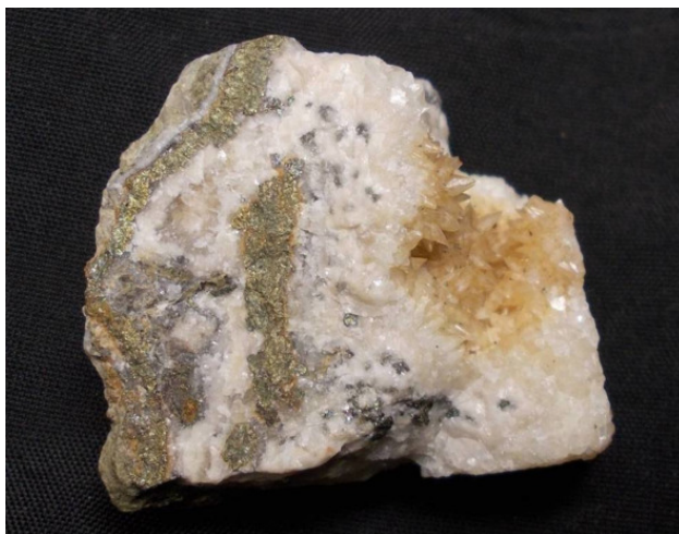
Карбонатно-сульфидная руда Мурунтау.