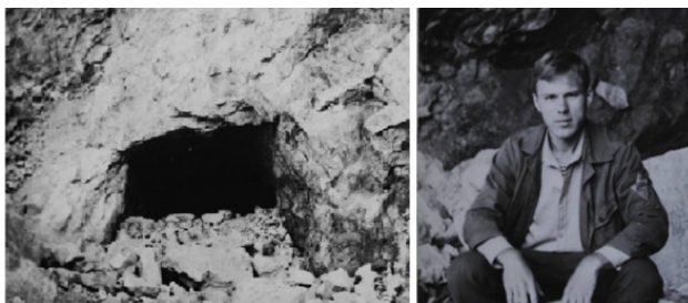
Одна из штолен, выходящих в карьер. Автор на глыбах с золотом.

Количество добытых образцов с золотом быстро росло, уже далеко превысив потребности частной коллекции. Но остановиться я не мог. Азарт подогревался надеждой, что впереди меня ждёт самая-самая удачная находка. Излишками же можно было щедро поделиться с музеями, с преподавателями и друзьями.