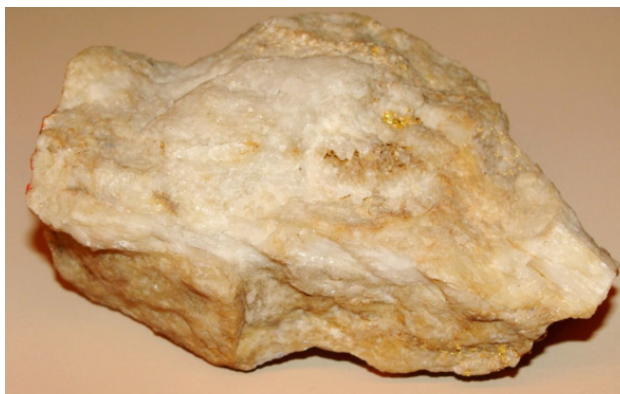
Золото в кварце. Пермский край, бассейн Вишеры.