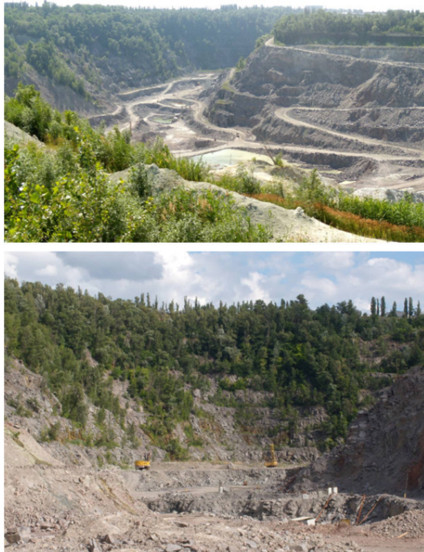
Горная страна моего детства (Кременчуг, Песчанский гранитный карьер)