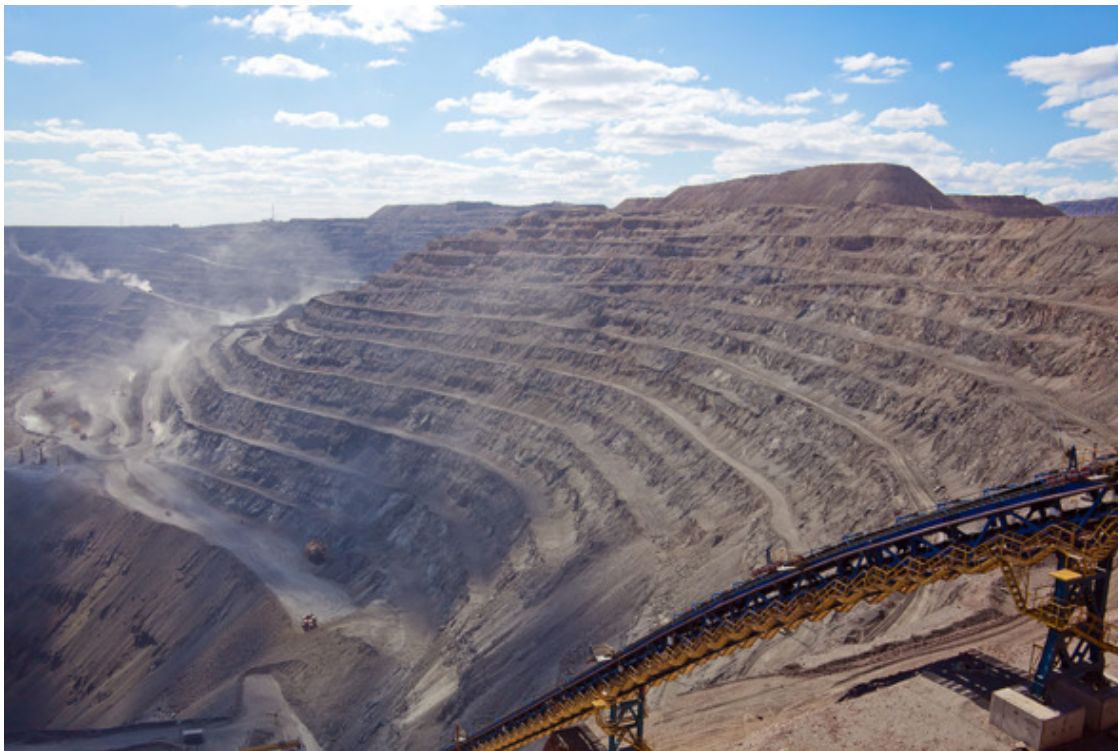
Карьер Мурунтау.