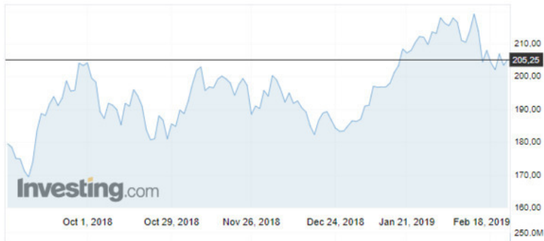
График привилегированных акций «Сбербанка»: