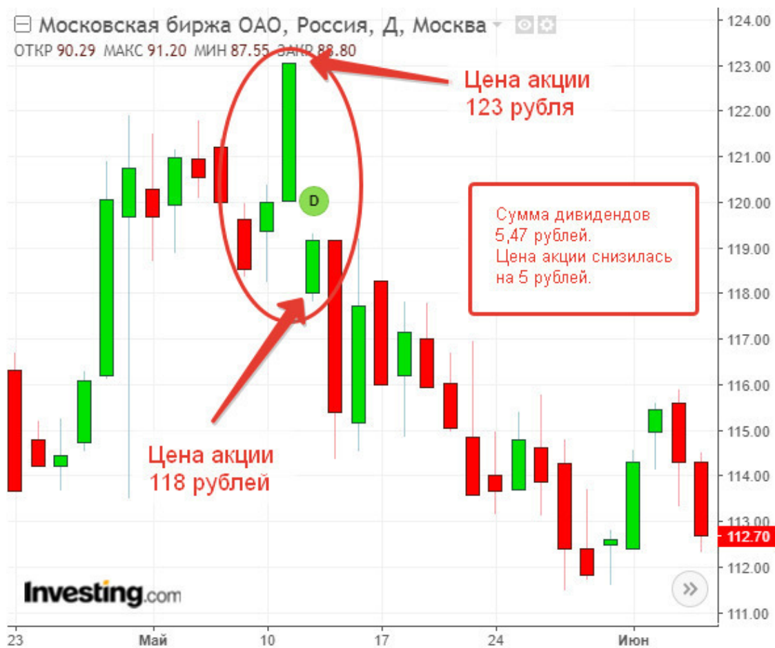
Дивидендный гэп в акциях ПАО «Московской биржи»

На рисунке видно, что до выплаты дивидендов цена акции была примерно 123 рубля, а после выплаты она снизилась на 5 рублей и стала 118 рублей. При размере дивидендов в 5,47 рубля на одну акцию. После этого случая я понял, что я не первый такой «умный» инвестор и что фондовый рынок не любит тех, кто пытается его обхитрить.