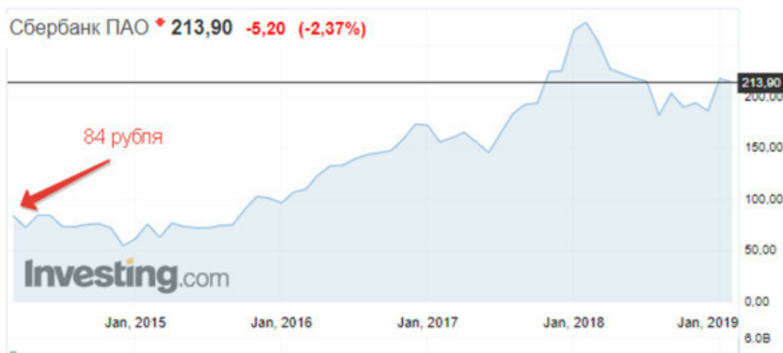
График цены обыкновенных акций ПАО «Сбербанк»

За 5 лет, с 2014 по 2019 гг. котировки акций «Сбербанка» выросли с 84 до 213,9 рублей. Доходность за 5 лет – 154,6%, то есть среднегодовая доходность 31%, это без учета дивидендов.