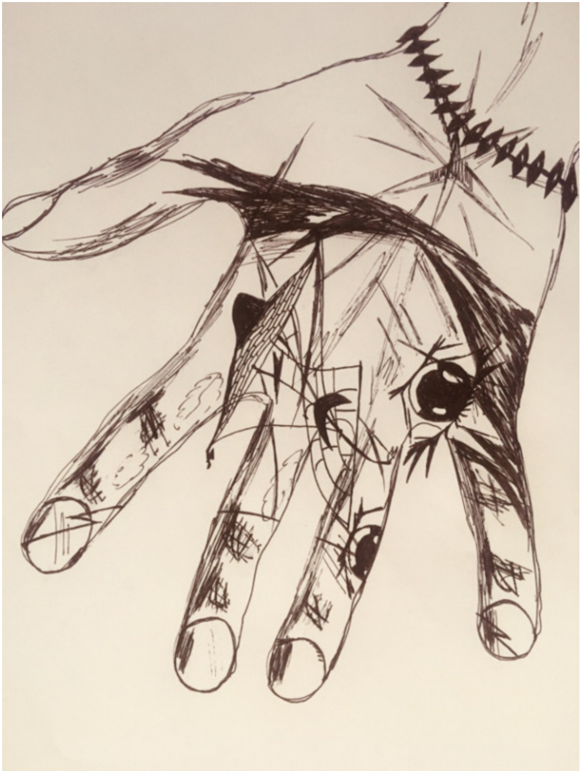
ручная половинка парного рисунка

Нам говорят, что Зло – внутри, – и лгут. Нам говорят: стремитесь к совершенству, когда перед глазами там и тут мы видим тьму, обман и непотребство, и жизнью правит ложный идеал