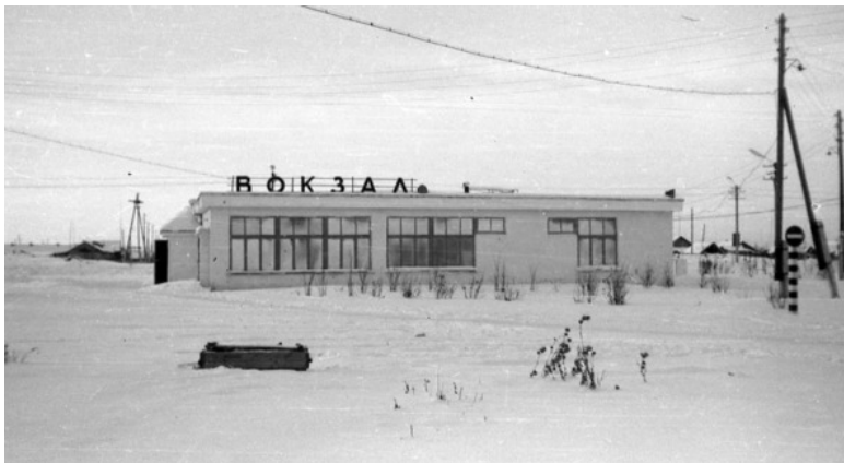
Куминский ж/д вокзал. 1972 г. Отсюда, с ЭТОГО вок-