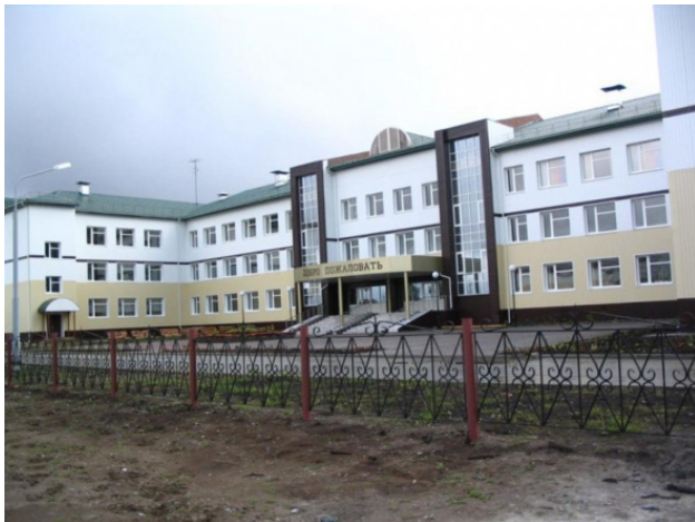
Куминская средняя школа сегодня