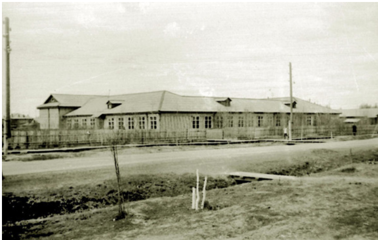
Старая куминская средняя школа