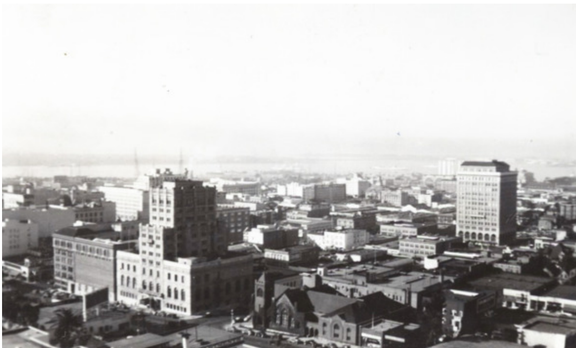
Вид на северную часть Сан-Диего из окна 14-го этажа гостиницы «Кортес». Здесь мы будем работать на авиазаводе «Консолидэйтед». 9.11.1937