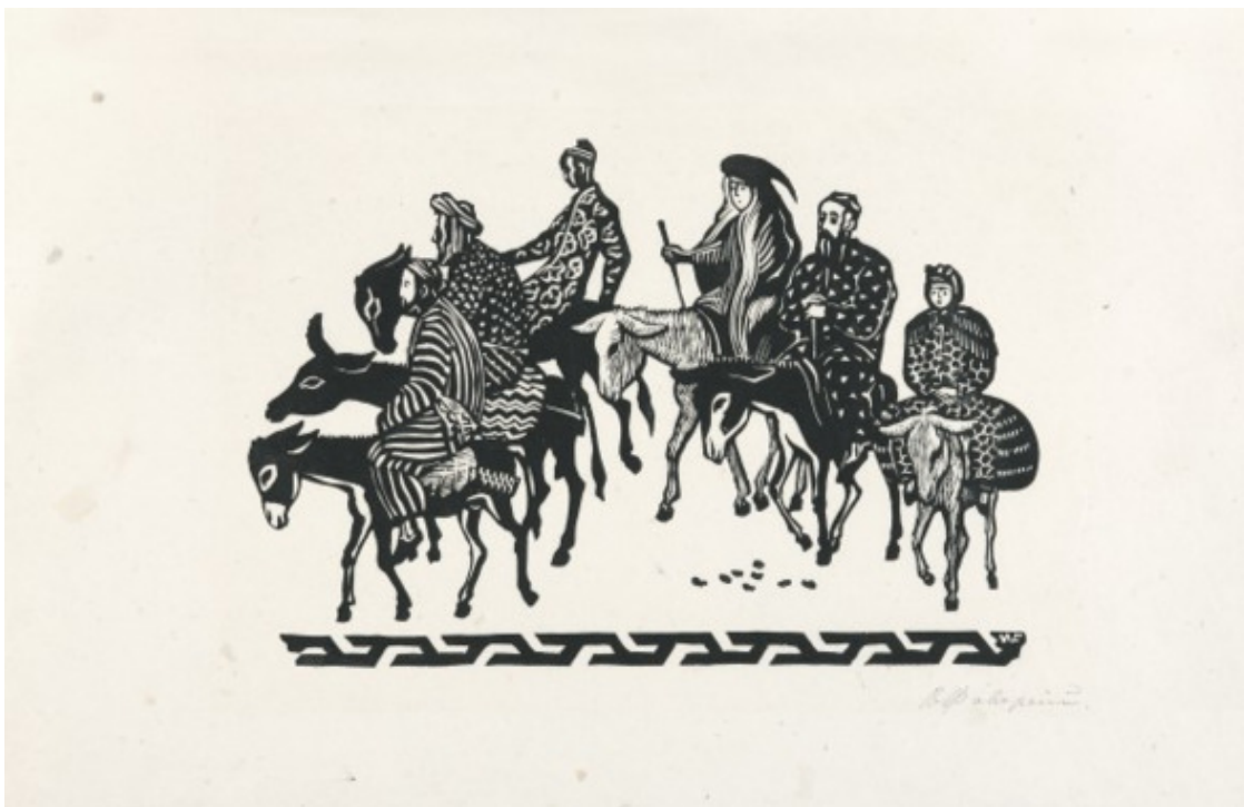
Владимир Фаворский. Процессия. 1943

Сразу скажу – я не собираюсь писать о достопримечательностях Бухары, Самарканда, Хивы или других известных туристских центров. Эту информацию в наше время можно легко найти и в интернете и среди разного рода рекламных материалов, издаваемых турфирмами. Я пишу о собственных радостных чувствах того периода. А также о печальных ощущениях, которые охватили меня во время недавней поездки в те, столь любимые и знакомые места.