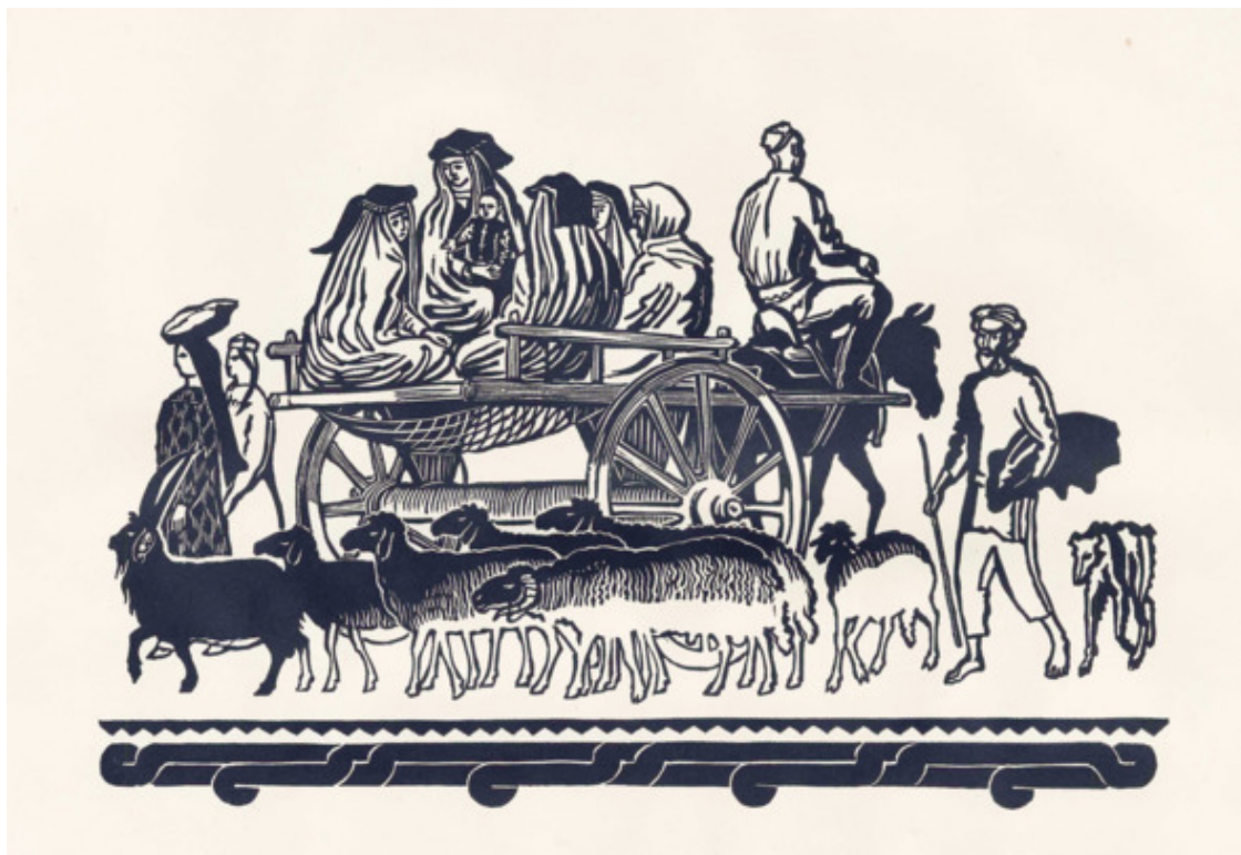
Владимир Фаворский. Арба. 1944

Заснуть я долго не мог, но потом вдруг провалился и очнулся лишь почти к десяти часам. Сказалась разница во времени. Быстро перекусил, выскочил из общежития. Было ещё совсем нежарко. Небо ослепительно синело, утреннее солнце окрасило золотом даже землю. Автобуса долго ждать не пришлось и вот, я опять в центре. Придя в себя, я, наконец, достал старенький путеводитель, повесил фотоаппарат на шею и решил посвятить день ознакомлению с достопримечательностями. В те времена я любил делать фотоотчёты о своих поездках. В альбом я клеивал фотографии, вписывал комментарии. Что-то вроде самодельного иллюстрированного путеводителя. Даже в разгар дня город казался совсем пустым. Старики, детишки. Почти не видно молодёжи, да и людей относительно среднего возраста было совсем немного. Да, уборка хлопка была государственным делом, и здесь к этому относились строго.