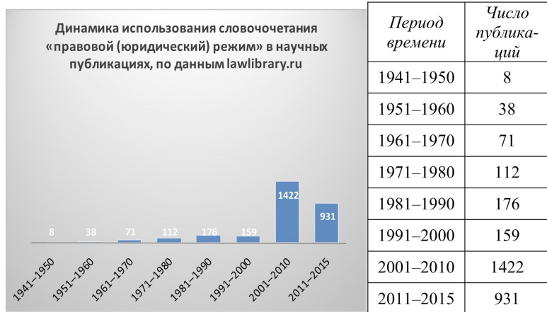
Рис. 1. Динамика использования словосочетаний «правовой (юридический) режим» в научных публикациях (заголовки), по данным www.lawlibrary.ru

вышение «спроса» на название «правовой режим» в публикациях юристов.