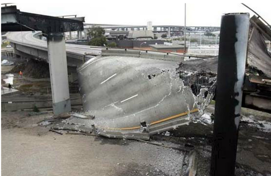
Рис. 2.4. Обрушение эстакады после землетрясения в Сан-Франциско

Первые спасательные работы начались под упавшей секцией шоссе. Возле расплющенных автомобилей одним из первых появился рабочий бумажной фабрики. Он услышал вопли детей, доносившиеся из раздавленного красного автомобиля. Вместе с другими спасателями рабочий помог выволить из ловушки восьмилетнюю девочку Кейти, но ее шестилетний брат Джулио оказался прижатым телом своей погибшей матери.