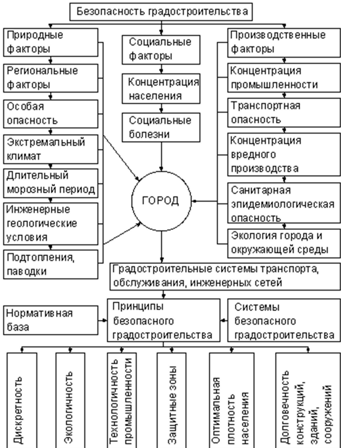
Рис. 1.1. Комплекс проблем и факторы безопасного градостроительства

В качестве мер защиты необходим комплексный подход к вопросам градостроительной экологии с анализом развития города через призму воздействия на окружающую среду и условия существования человека (рис. 1.2).