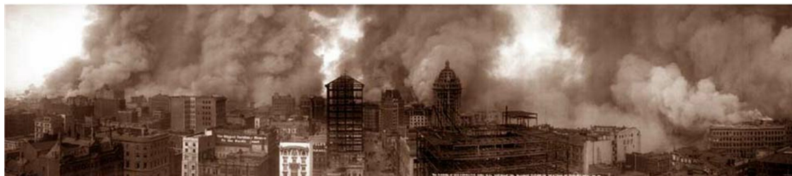
Рис. 2.3. Пожар после землетрясения в Сан-Франциско

К тому времени, когда вспыхнули пожары, более 75 % Сан-Франциско уже было разрушено, четыреста городских кварталов лежали в руинах.