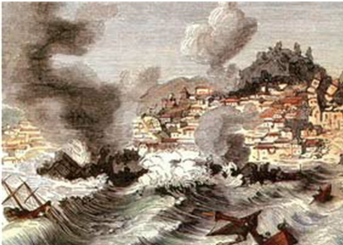
Рис. 2.2. Последствия землетрясения в Лиссабоне

Не только Лиссабон пострадал от катастрофы. Во всей Западной и Центральной Европе земля дрожала и шатались стены. В Люксембурге рухнула казарма, погибли 500 солдат. Даже в Северной Африке не обошлось без жертв: около 10 тыс. человек остались под развалинами.