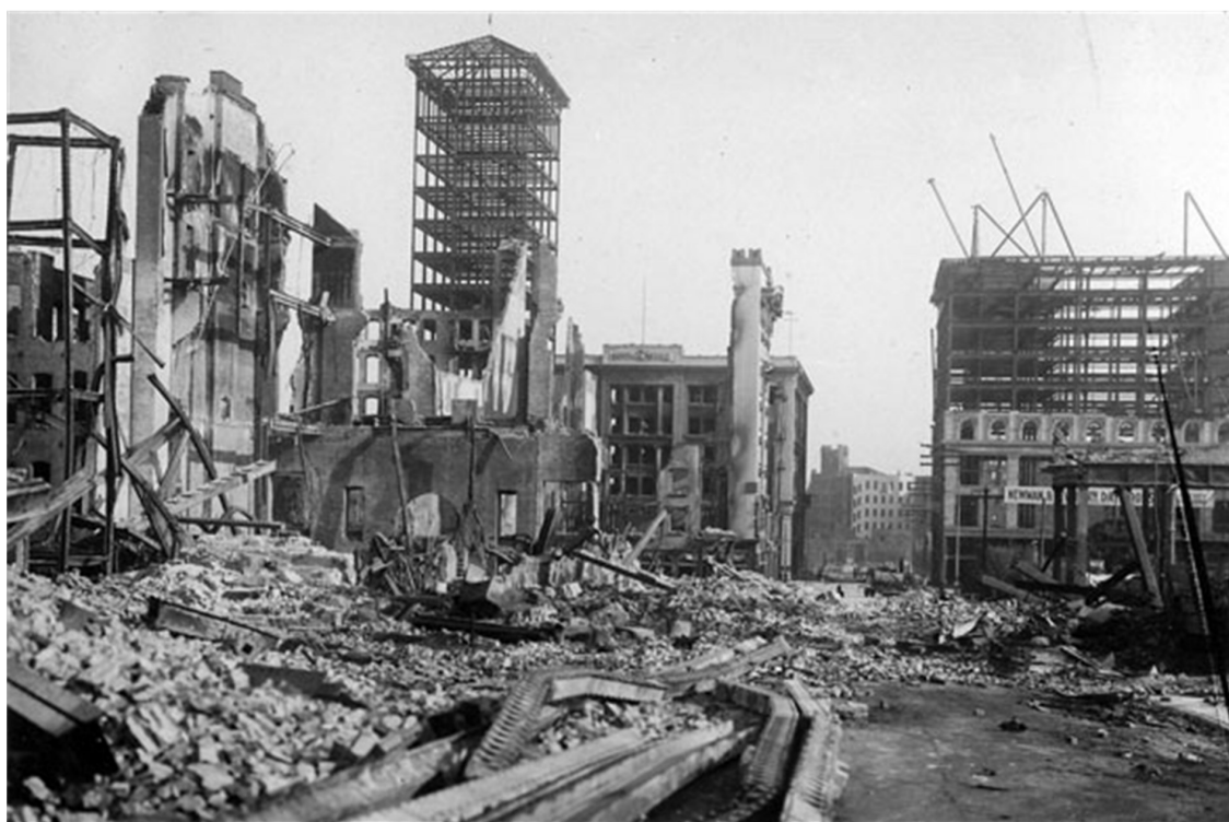
Рис. 2.7. Последствия катастрофы в г. Ашхабаде при дневном свете