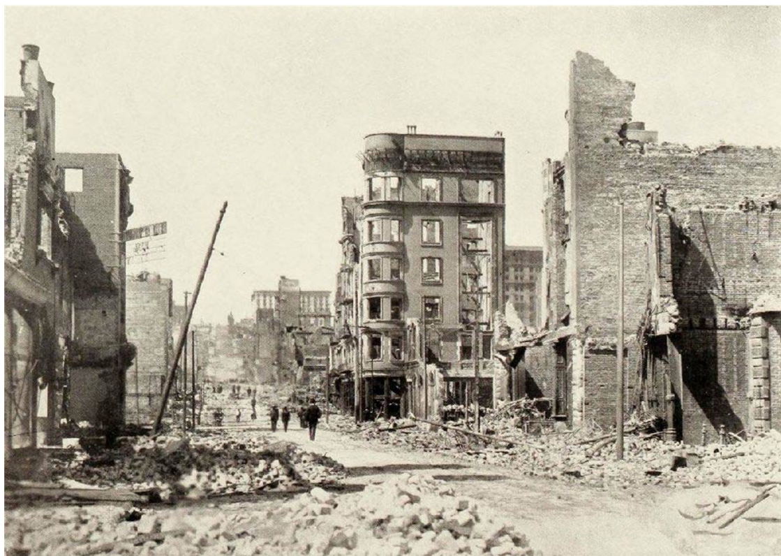
Рис. 2.1. Разрушения зданий под воздействием землетрясения 1906 г. в Сан-Франциско

Для облегчения понимания сложных динамических процессов, происходящих при землетрясениях, приведем данные, характеризующие количественные показатели сейсмических воздействий на здания, сооружения и систему жизнеобеспечения в городах и населенных пунктах.