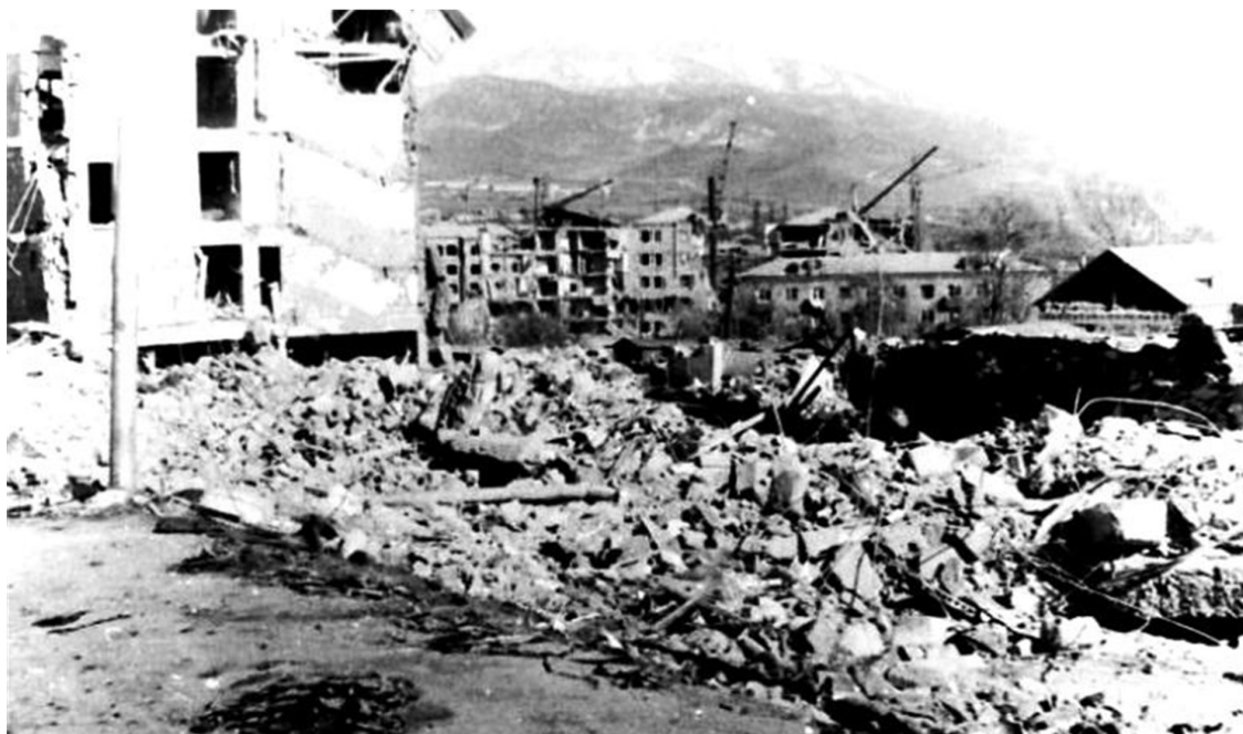
Рис. 2.6. Разрушение зданий в г. Ашхабаде

Над растерзанным Ашхабадом вставал тяжелый багровый рассвет, когда город потряхнуло еще раз. Толчок был значительно слабее ночного, но оказался достаточно сильным, чтобы разрушить то, что каким-то чудом уцелело после первого. Охваченные горем и ужасом ашхабадцы увидели масштабы происшедшего уже при дневном свете... (рис. 2.7). Города, в котором еще вчера проживало около 170 тыс. человек, больше не существовало.