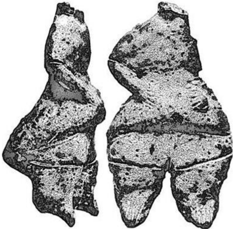
Рис. 5. Беременная Богиня (резьба по камню, эпоха неолита, Греция, около 5800 г. до н. э.)

«Хотя “Мать-Земля” имела огромное значение в первобытной религии, она не единственное – пусть и очень важное – выражение аспекта раннего проявления принципа Божественной Женственности. Одна из