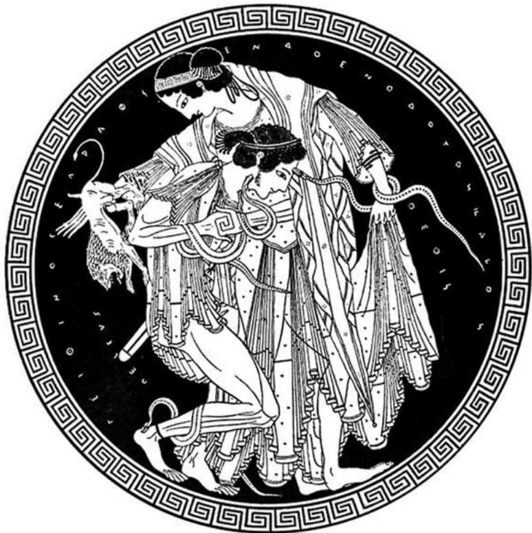
Рис. 1. Фетида и Пелей (краснофигурный классический килик, 2 Греция, V в. до н. э.)