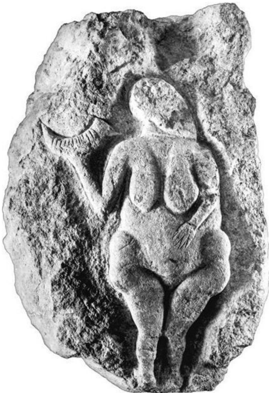
Рис. 6. Венера Лоссельская (рельеф на песчанике, ориньякская культура, юго-запад Франции, 25 000 лет до н. э.)

Здесь самое важное – беременность, это чудо! Женщины, продолжающие жизнь, сами становятся неисчерпаемым сосудом жизни. Сначала люди поклонялись животным, а потом – женщинам, источнику природной силы, а не просто еще одной ее части.