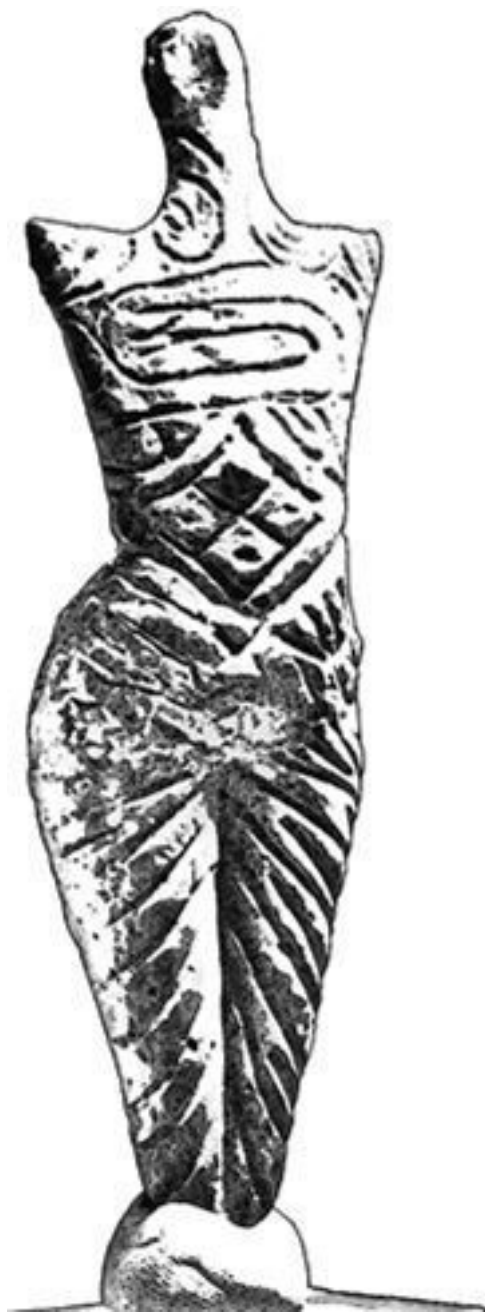
Рис. 7. Богиня, украшенная изображением лабиринта (терракота, Румыния, 5500 лет до н. э.)

Все тело фигурки украшено орнаментом в виде лабиринта, и здесь довольно важна его центральная часть. Ее пупок – это пуп мира, а мир изображен в виде прямоугольника, который раскручивается из него: на север, на юг, на восток и на запад. Мария Гимбутас полагает, что ромбовидная форма – это идеограмма, связанная с этим прямоугольником, «вечным символом земли». 21