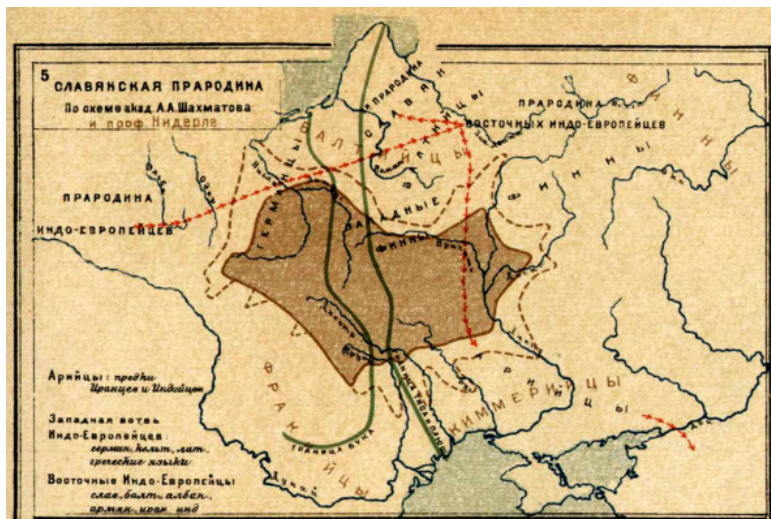
Русский исторический атлас К. Кудряшова

Но затем, в 1929 году, сама «русская история» была признана контрреволюционной, а в 1932—36 годах теория прародины была объявлена коммунистическими идеологами — не большевистской, фашисткой и антинаучной.