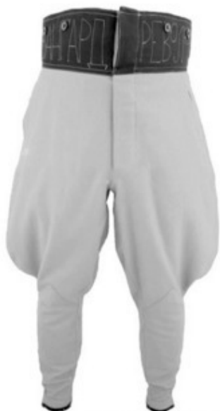
красные революционные шаровары