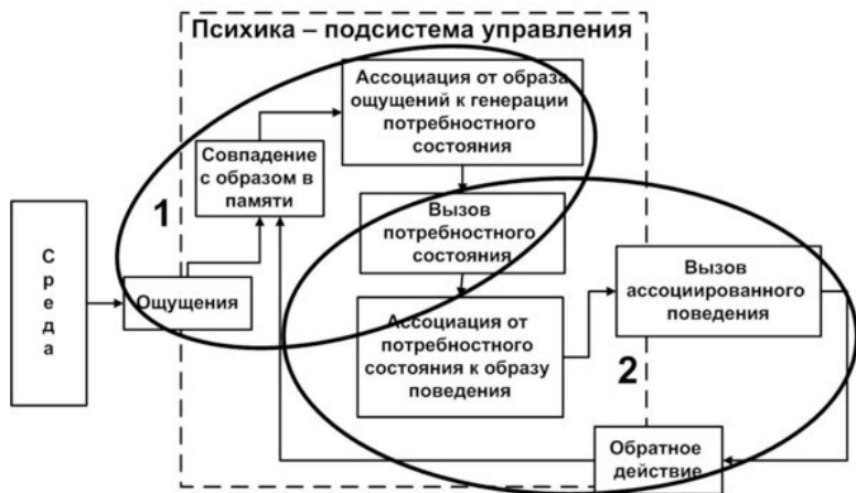
Рис. 3. Потребность в выученной практике Животного вызывается «культурой» запуска потребностей (группа 1) и снимается «культурой» выученного поведения (группа 2), при этом само поведение обычно видят как инстинкт, хотя от рождения он выучивается от старших