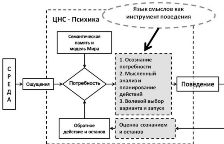
Рис. 5. Потребностный цикл Человека при использовании им своей новой языковой модели Мира

И, наконец, возникает вопрос, как и где физиологически психика Человека выполняет операции сознания и мышления в отрыве от ассоциаций?