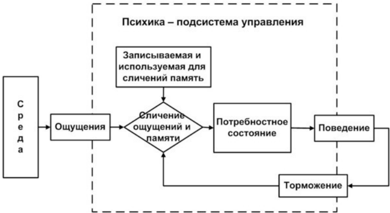
Рис. 2. Потребность. Ее возникновение и активное поведение как приспособление

В рамках нового подхода – потребности есть внутренние досознательные (официально – «подсознательные») психофизиологические состояния у Животных и даже у Человека. Каждая потребность есть внутреннее напряжение, которое отражает необходимость адаптации поведением, выбираемым из памяти. В отсутствие полезной памяти или непригодности известного поведения потребностное состояние произвольно вызывает хаотическое поисковое поведение. Механизм древний, но он обязательно является про-