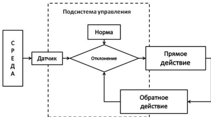
Рис.1. Принцип адаптации любой адаптивной системы

Важность адаптации в организации и конструкции живого организма заключается в принципе отбора лучших организмов в Эволюции. Всякое отдельное (генетически) случайное изменение внутри организма принимается (то есть повторяется и воспроизводится копированием), только если оно улучшает жизнедеятельность в смысле приспособления к Жизни . А все виды приспособления или адаптации Живого включают всего три класса адаптивных функций, то есть 1) безопасность; 2) энергообеспечение и 3) производи-