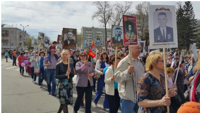
Акция «Бессмертный полк»

конечно, тут государственная политика должна быть. А ввести знаки отличия, наподобие орденов, от имени общественного движения, вполне реально. Например, ты знаешь свое родство до четвертого колена – тебе знак четвертой степени. Знаешь до седьмого колена – знак более высокой степени. А если тебе известны родственники до первой ревизии – это когда начали впервые организовано вести учет граждан на Руси – тебе знак высшей степени отличия! Ну это, конечно, рассуждения об атрибутике и не более того.