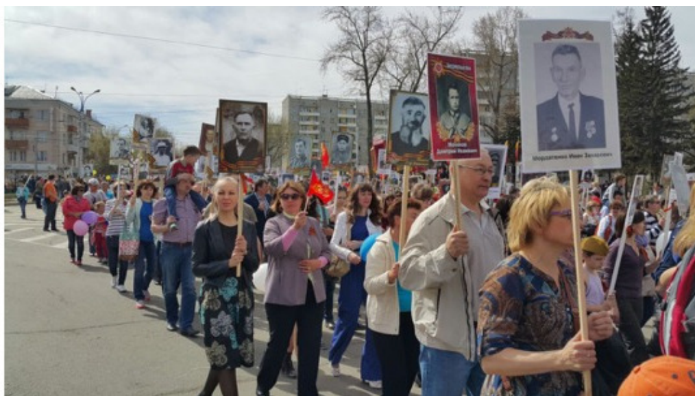
Акция «Бессмертный полк»

Надеюсь, в процессе работы мы сумеем выплавить точный по смыслу и по форме слоган. Но возникает вопрос: как визуально и ярко обозначить такое движение? Попробовать, как «Бессмертный полк», выйти на улицы со своим генеалогическим деревом. А если у меня это древо простирается своими корнями аж до шестнадцатого века? Что же мне, этим деревом размахивать? Нет, конечно, тут государственная политика должна быть. А ввести знаки отличия, наподобие орденов, от имени общественного движения, вполне реально. Например, ты знаешь свое родство до четвертого колена – тебе знак четвертой степени. Знаешь до седьмого колена – знак более высокой степени. А если тебе известны родственники до первой ревизии – это когда начали впервые организовано вести учет граждан на Руси – тебе знак высшей степени отличия! Ну это, конечно, рассуждения об атрибутике и не более того.