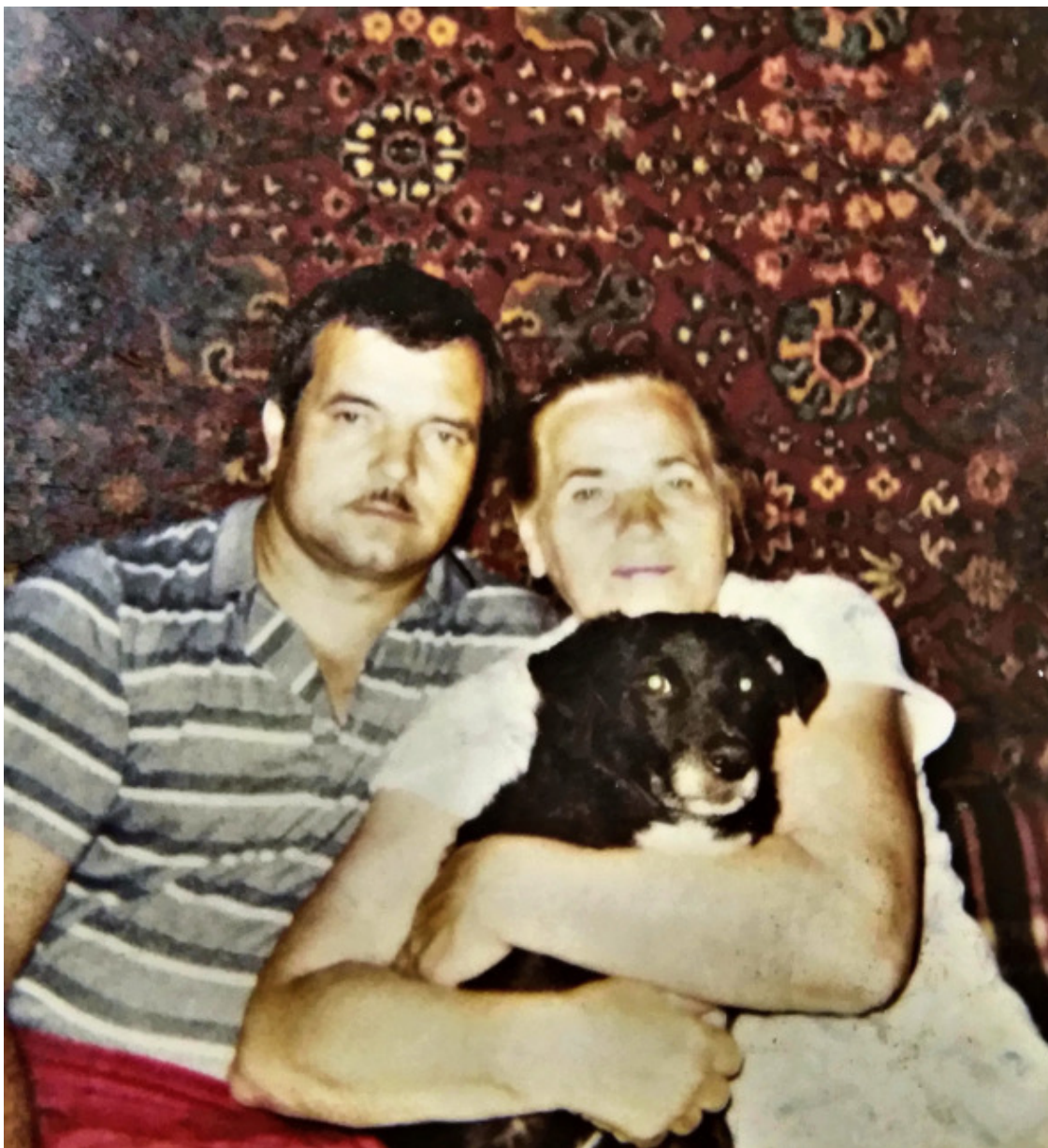
Я с мамой и Мальшом