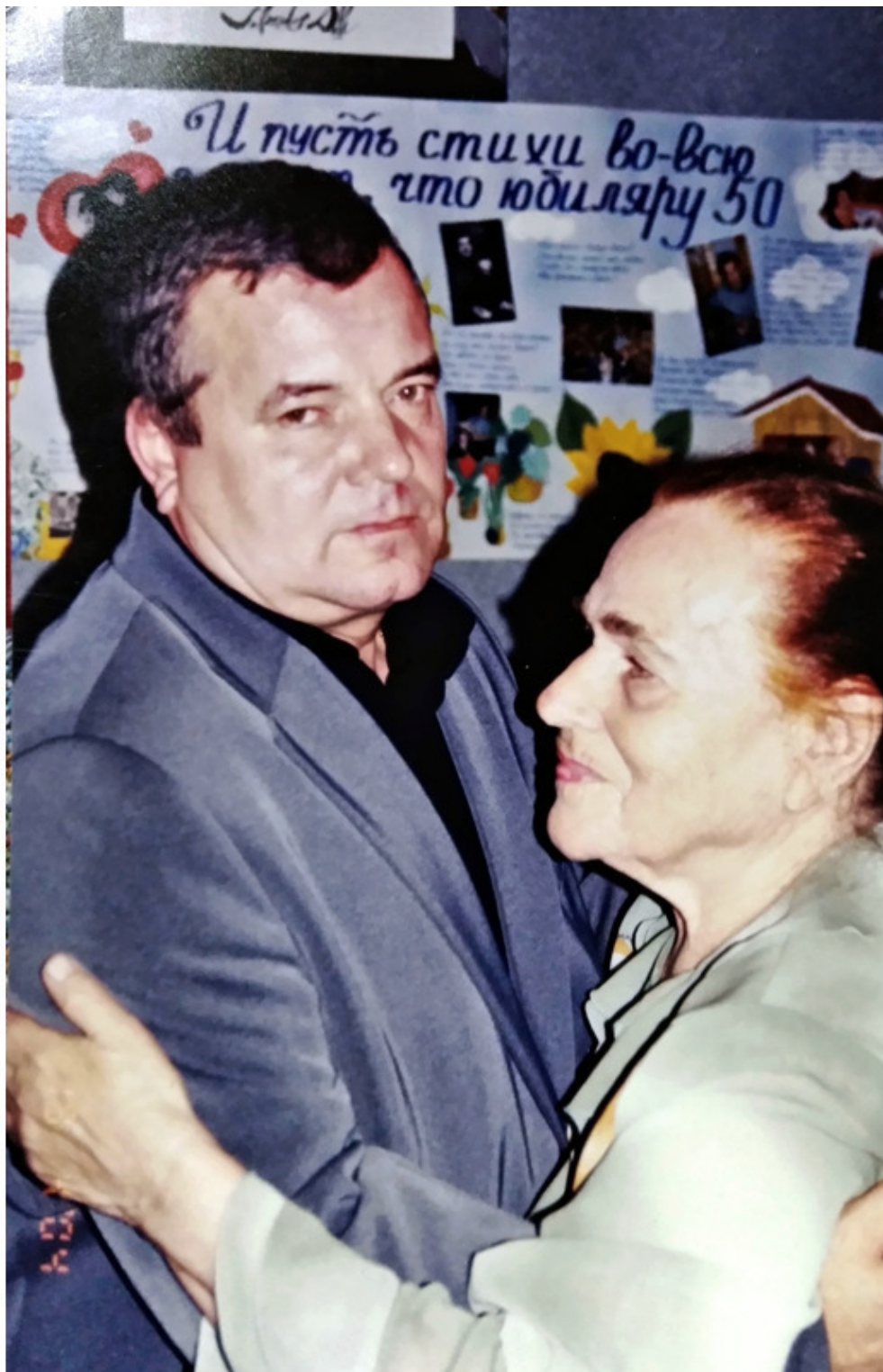
Танцуем с мамой на моем 50-летию 19.04.2004

Как же это страшно, но бабушки стойко переживали и такое. Пережили же ужасную войну, разруху и голод. Восстановили народное хозяйство, подняли детей, помогли растить внуков.