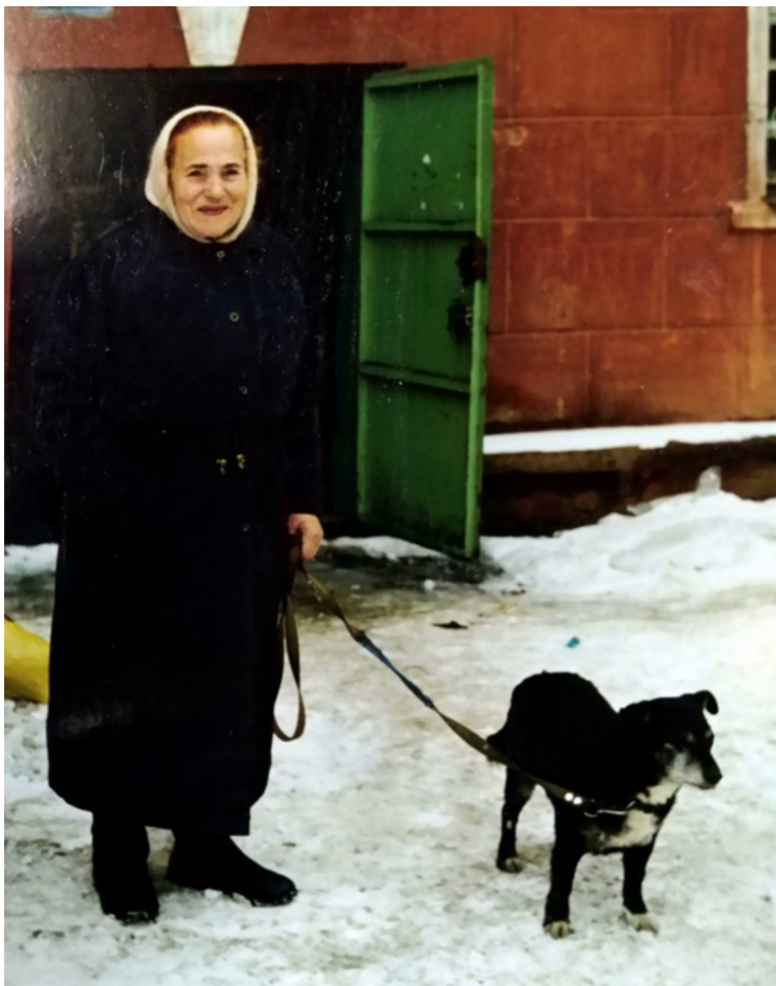
Мама с Малышом на прогулке

С чувством ноющей боли вспоминаю, как умирал ее любимец Малыш – пес, который прожил у мамы почти 19 лет. Когда-то, заходя в свой подъезд, она услышала слабый писк живых существ. Кто-то закрыл в подвале пять или шесть щенят дворняжки и оставил их там умирать. Мама пошла, взяла ключ, открыла дверь в подвал и принесла к себе домой весь этот собачий выводок. Вскармливала из сосочки, готовила для маленьких живых комочков специальную еду, мыла, убирала, подтирала за ними пол. Выходила всех и потом раздала подросших и окрепших щенят в добрые руки. Одного оставила себе, жалко было отдавать самого маленького и слабенького.