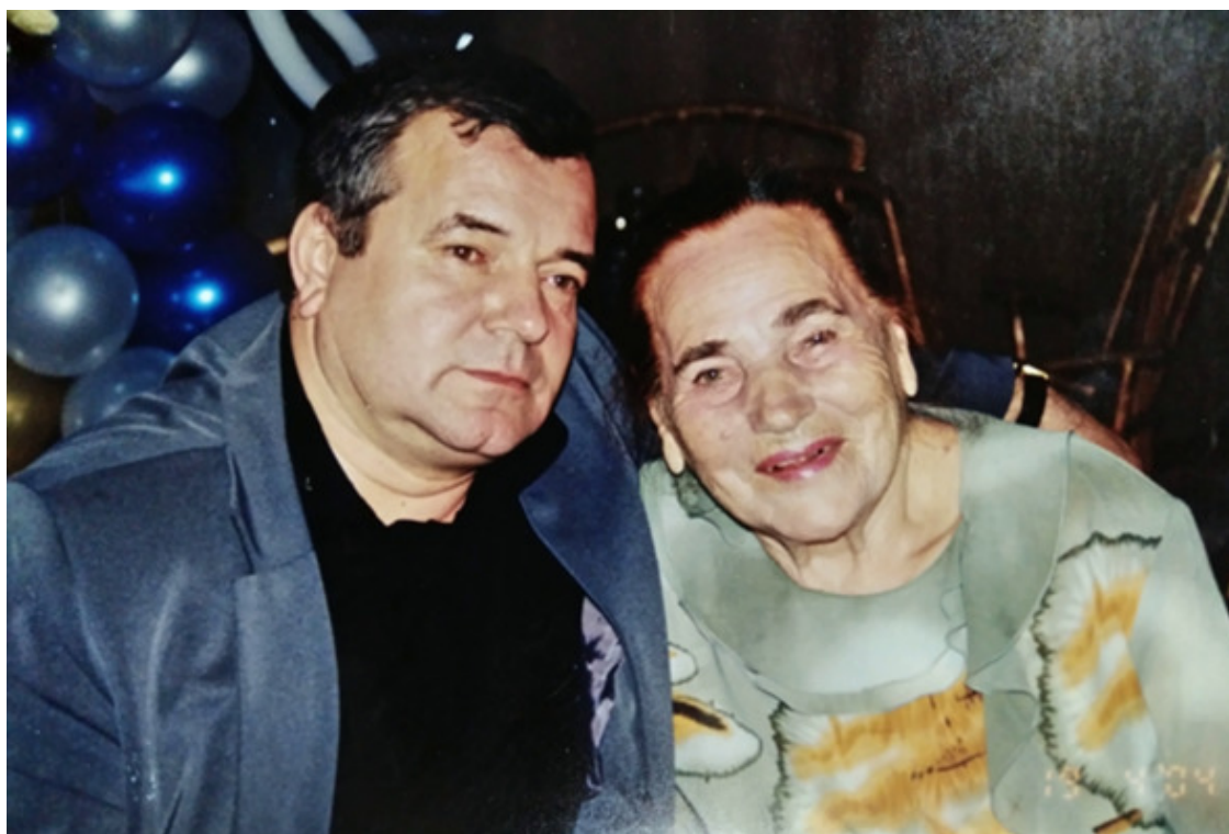
Маме 90 лет – юбилей

Что-то раньше этого невероятного превращения я не замечал. Может быть, не задумывался о скрытом волшебстве и неизведанных мною ранее таинствах нашего родного русского языка.