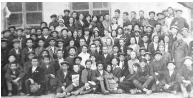
Учащиеся ФЗУ 1929—1930 учебного года.

Группы возглавляли мастера, которые делились своим опытом и объясняли методы ведения рабочего процесса. Для повышения результативности работы наставника мастерам были предусмотрены денежные премии. В июле 1930 года на индивидуальном обучении числился 91 человек.