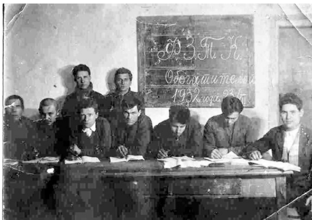
Слушатели Фабрично-заводских технических курсов обогатителей.

После запуска завода продолжились работы по подготовке квалифицированной рабочей силы. Согласно плана за 1929—1930 годов были достигнуты следующие результаты. Из 40 человек, поступивших на подготовительную группу Фабрично-заводских технических курсов (ФЗТК) 38 были переведены в основную группу, а двое направлены на обучение в техникумы. Расширился охват учеников бригадным обучением. В учебных забоях выпущено 22 человека.