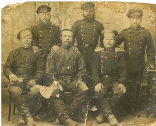
Самарские рабочие, нанятые англичанами в Карсакбае

руководства акционеров выделять какие-либо ассигнования на улучшение бытовых условий в бараках. Также, по тем же соображениям санитарной безопасности, вышел приказ, запрещающий казахам мыться в одной бане с русскими.