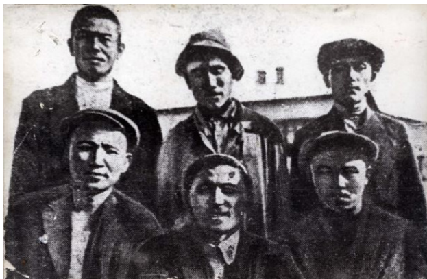
Ведущие рабочие металлургического цеха.

Если в 1928 году на комбинате работало 1475 рабочих, то в 1932 году их число выросло до 1962 человек. Это с учетом завершения основных строительных работ и массового освоения строителей, которые были переквалифицированы и устроены на постоянные специальности. Численность ИТР 99 за аналогичский период выросла с 32 до 150, а служащих с 295 до 339 человек.