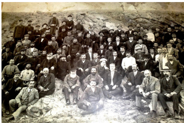
Первые европейцы, прибывшие на строительство Карсакбая.

Необходимо было соединить Жезказган, Карсакбай и Байконыр железной дорогой, которую решили построить по английскому проекту, основанному на использовании узкоколейного полотна для английских паровозов и их составов. Было спроектировано строительство плотины на реке Кумола для накопления весной талой воды и обеспечения строящихся обогатительной фабрики и завода водными ресурсами. Первостепенной задачей было обеспечение инженерно-технического состава и рабочих необходимым жильем.