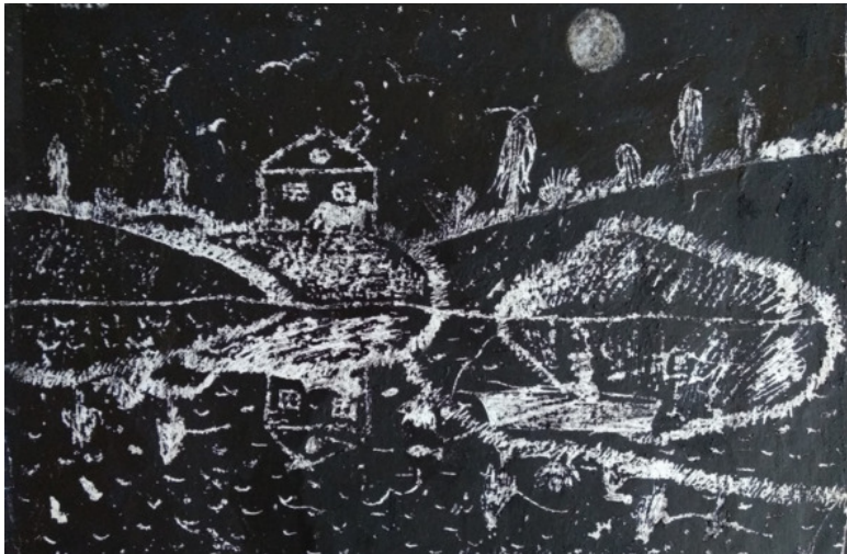
Вечер на озере