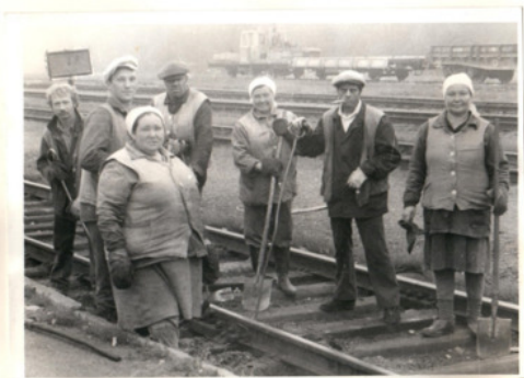
бригада монтеров путей