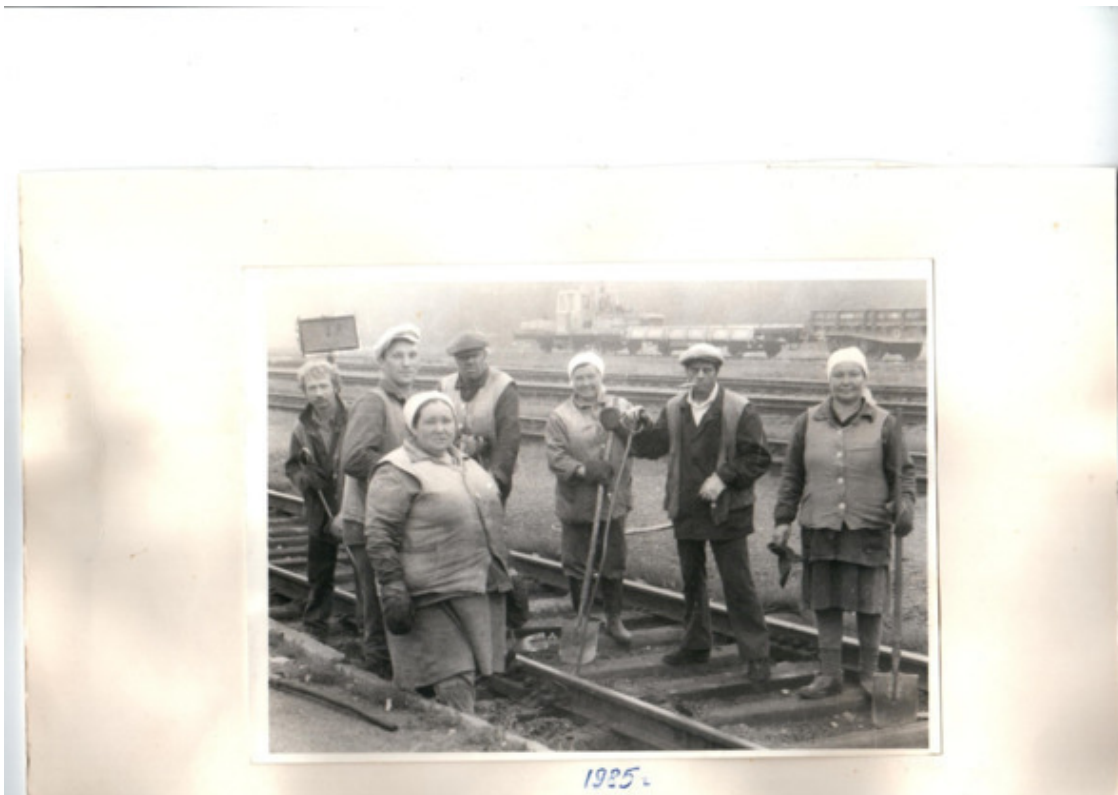
бригада монтеров путей