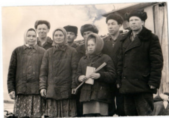
бригада по разделке хлыстов