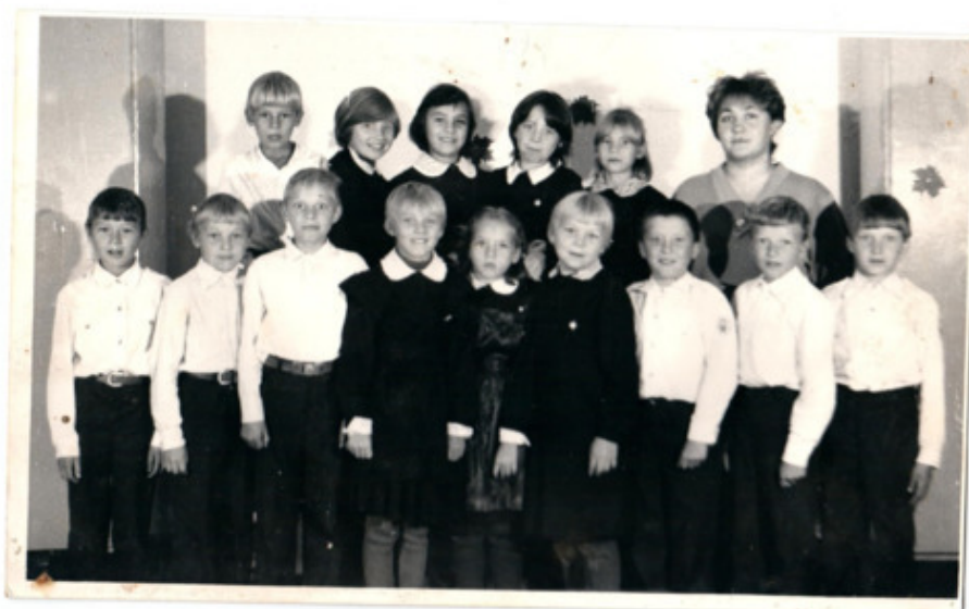
ученики первого класса Яринской школы.