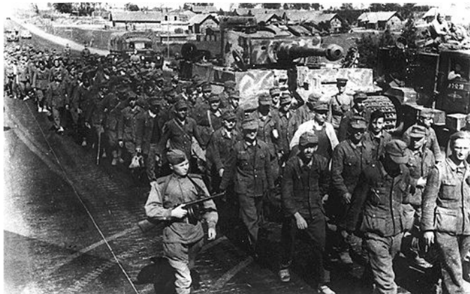
Взятые в плен немцы