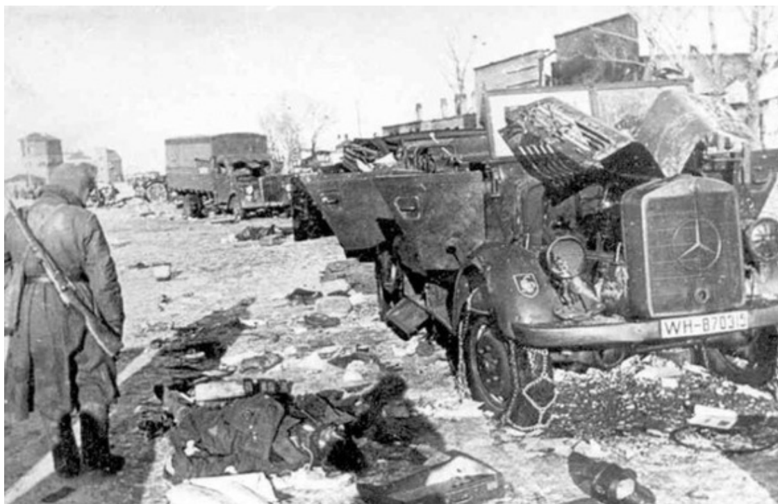
Разведчики перенесли огонь по штабным машинам