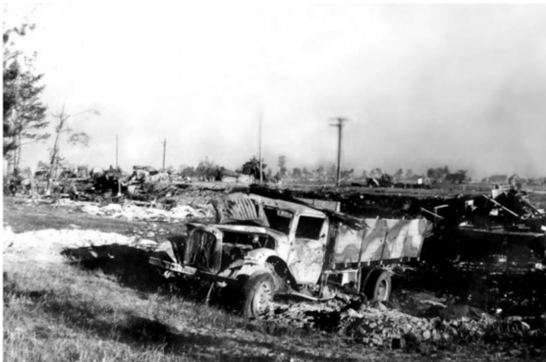
Немецкая колонна после залпа «Катюш»

Заметим, что генералу Бурдейному командиру 2 гв. танкового корпуса в это время было 36 лет, а его подчинённым 80% – 18—19 лет, лейтенантам – 25 лет. Хотелось бы обратить на этот факт особое внимание.