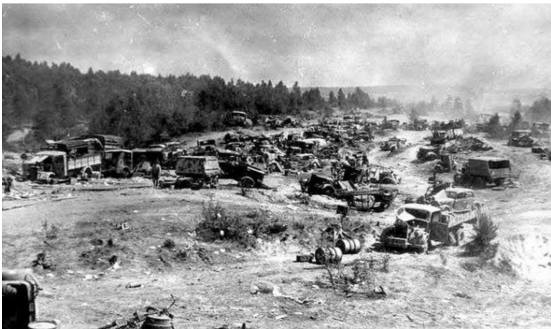
Разбитая немецкая колонна у переправы