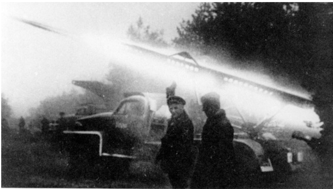
Гвардии миномётный полк в действии