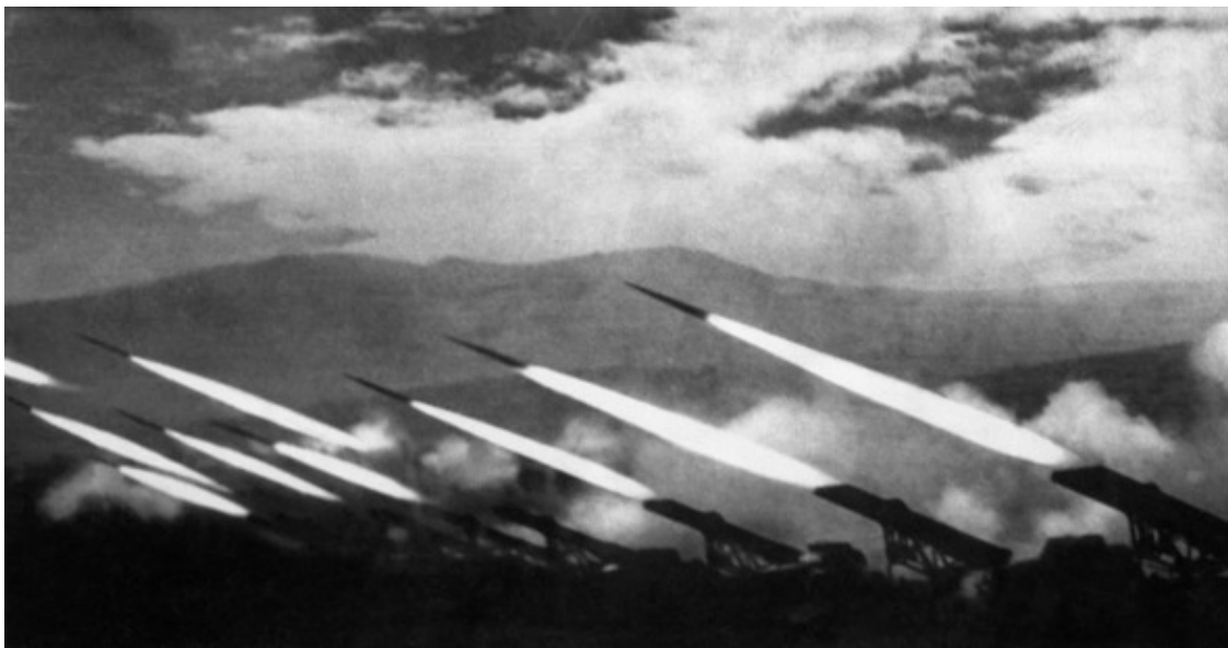
Катюши. На направляющих 64 ракеты

26 июня части корпуса вышли на Минскую автомагистраль западнее Орши и к рассвету 27 июня овладели опорным пунктом Староселье . В этот же день была освобождена Орша.