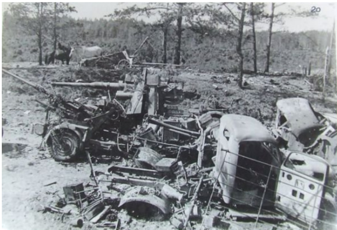
Автомашин разбито и сожжено – 163, повозок -30

До 20.00 28.06 44 4 гв. мсбр занимала оборонительный рубеж м. Староселье. В 20.00 согласно устного приказа командира корпуса бригада с 1500 САП 273 МП снялась с занимаемого рубежа оставив 1 б-н гарнизоном в м. Староселье, в пешем строю и на автомашинах выступила по маршруту: м. Староселье, Дымово, Ореховка, Дудаковичи, Пасырево и к 2.00 29.06.44 сосредоточилась в 3 км восточнее Круглое.