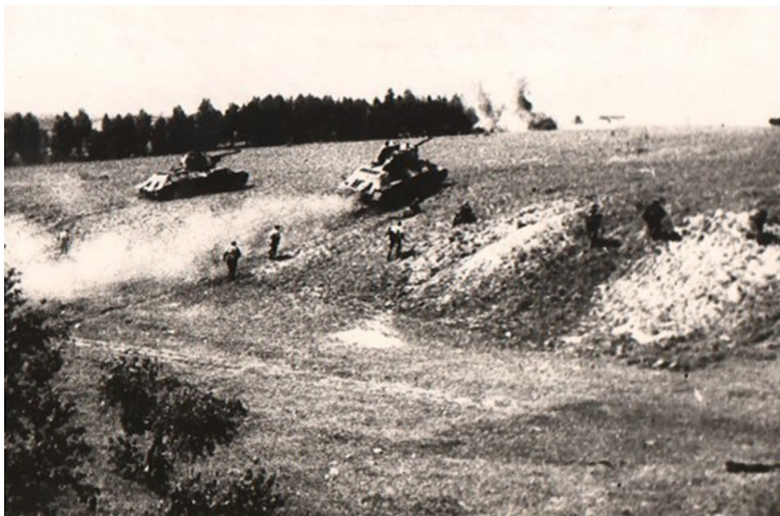
Танковая атака в районе Староселье

Кувечино и разворачивается к бою. К 7.00 передовой отряд в составе 2-батальона и двух батарей 1500 САП находятся в 2 км севернее Староселья в боевых порядках. 4 гв. тбр пешие колонны 1 и 3 батальонов и отдельных рот на подходе в д. Кувечино. Артиллерия – артдив, минбат и 237 мп на огневой позиции севернее опушки леса, что южнее Кувечено к готовности открытия огня в направлении: Птицеферма высота 211.8, Староселье. К 10.00 подразделения бригады сосредоточились севернее Староселья. Подразделения бригады во взаимодействии с танками 4 гв. тбр овладели м. Староселье. С занятием м. Староселье войсками фронта, г. Шклов – войсками наступающими из г. Орша, завершилось окружение остатков частей и соединений Оршанской группировки противника не успевших отойти в западном направлении. Через м. Староселье проходит усовершенствованная грунтовая дорога Шклов-Борисов, являющаяся единственным выходом для окружённых групп противника на Борисов.