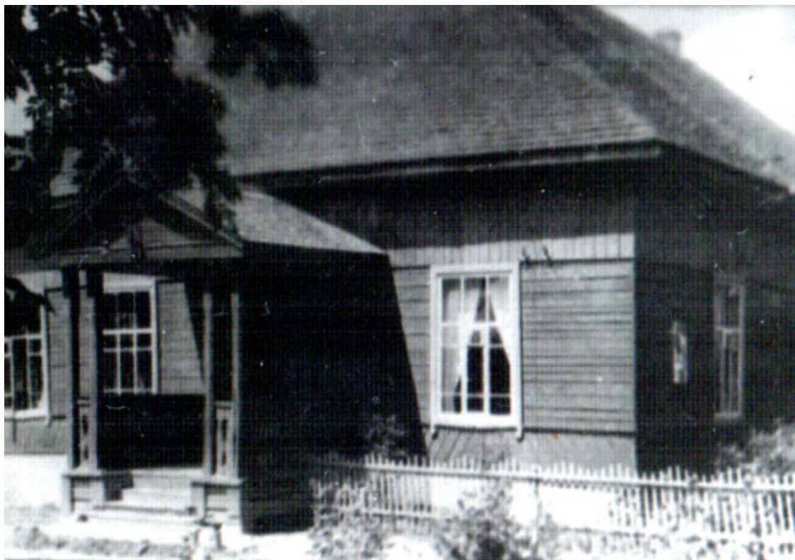
Школа. Командный пункт 4 гв. мсбр и полевой госпиталь

Материальное обеспечение: выстрелы 76 мм боеприпасами около 1110 шт, бронебойных – 65, всего 0,8 бк.