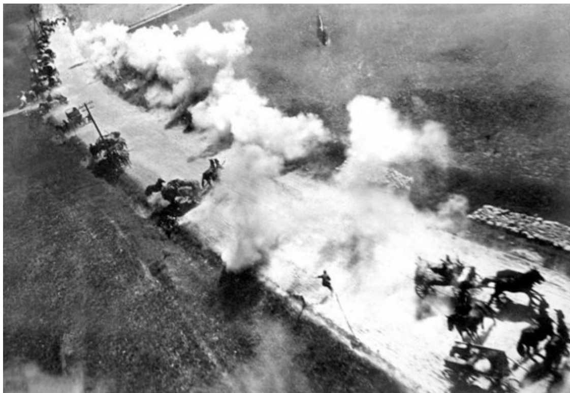
Работа штурмовой авиации

Ленина и медаль «Золотая звезда»), Орден Суворова II степени, Орден Суворова II степени, Орден Александра Невского, Орден Красного Знамени, Орден Кутузова I степени, Орден Кутузова I степени, Орден Красного Знамени, Медаль «За оборону Ленинграда»