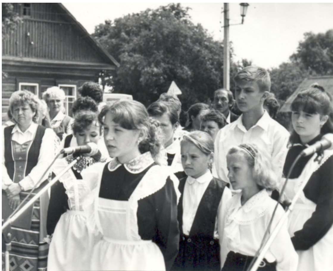
9 мая 1990 г.