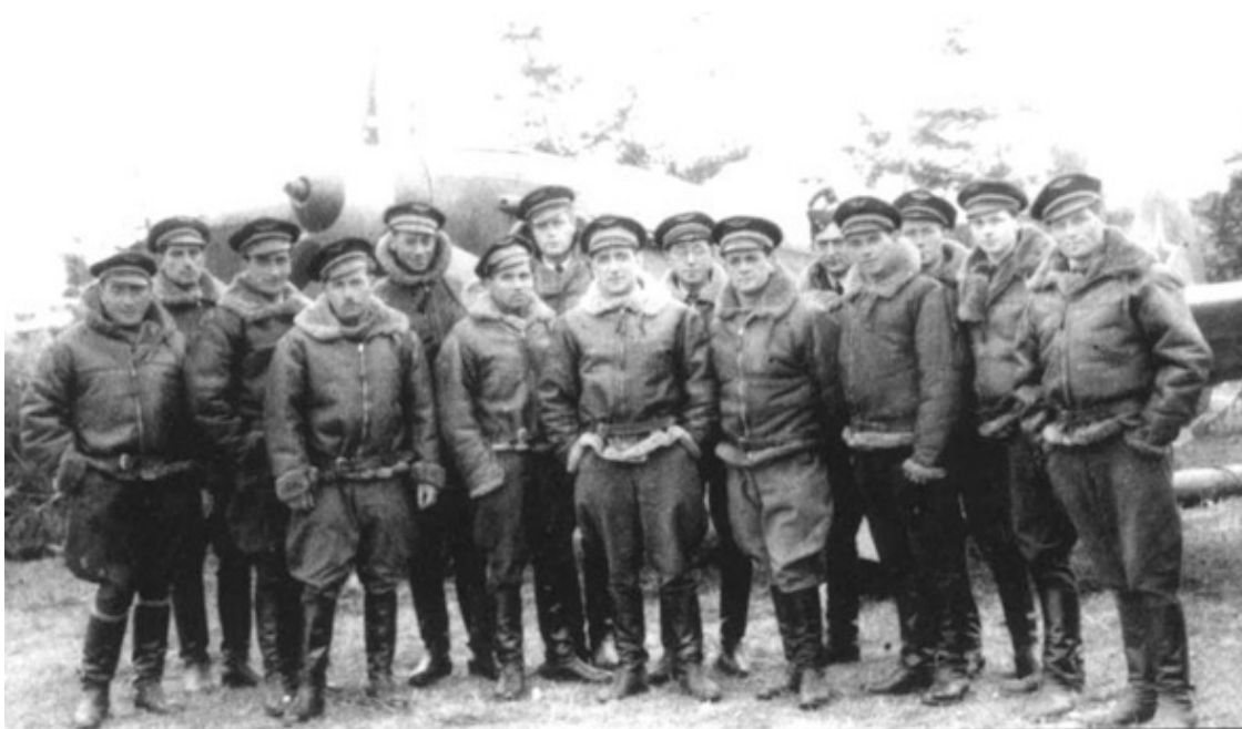
Авиаполк французских лётчиков «Нормандия»

В составе авиадивизии действовал авиаполк французских лётчиков «Нормандия».