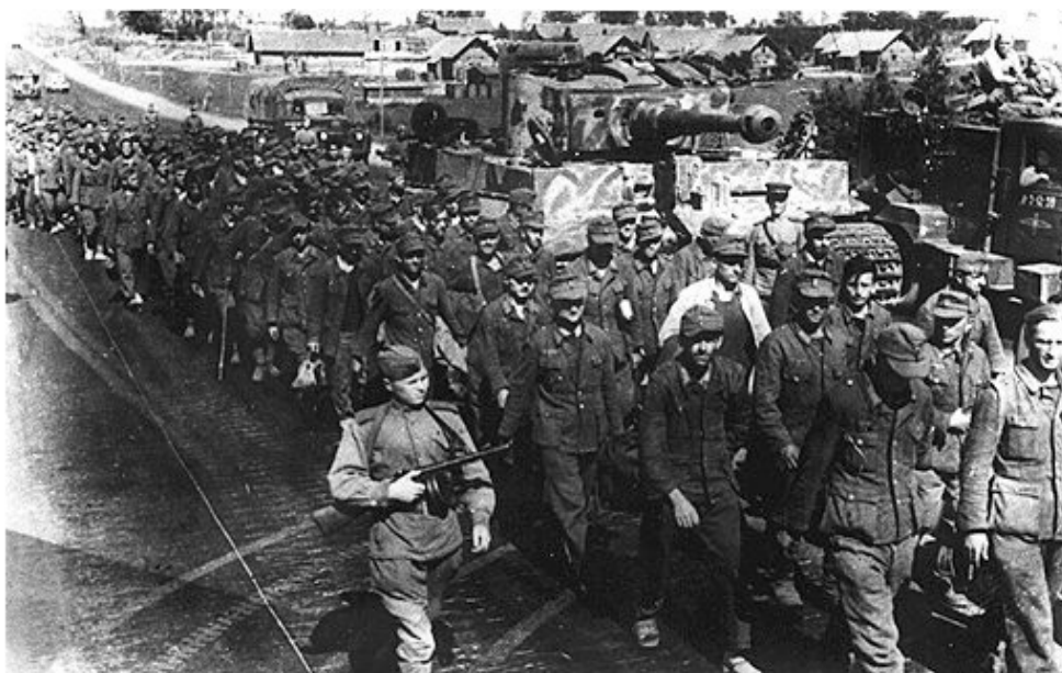
Взятые в плен немцы

После разгрома Оршанской группировки, 28-й ОГМД вместе с 2-м гвардейским танковым корпусом устремились к р. Березина. Дивизион, следовавший за танкистами, обходил населённые пункты, большаки, чтобы не ввязываться в бои с вражескими гарнизонами. Нередко на пути встречались группы противника, пытавшиеся вырваться из окружения по проселочным и окружным дорогам. Чтобы не задерживаться и не снижать темпы продвижения, на них не обращали внимания. Но не всегда это удавалось. Тогда приходилось вступать в бой, а взятых в плен гитлеровских офицеров и солдат затем передавать подходящим мотострелкам или партизанам.