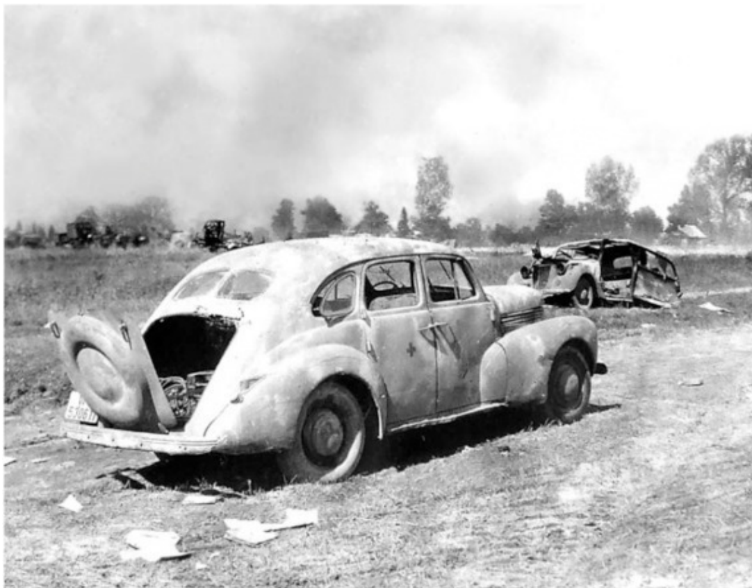
Немецкие легковые автомобили, сожжённые миномётами

Из-за большого скопления машин и обозных повозок, переправа значительно замедлилась.