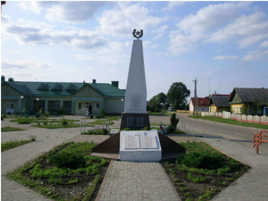
д. Староселье. Братская могила.

Чем больше проходит время, тем незначительнее становятся события Великой Отечественной войны для новых поколений. Как важно передать память о героических событиях подрастающему поколению.