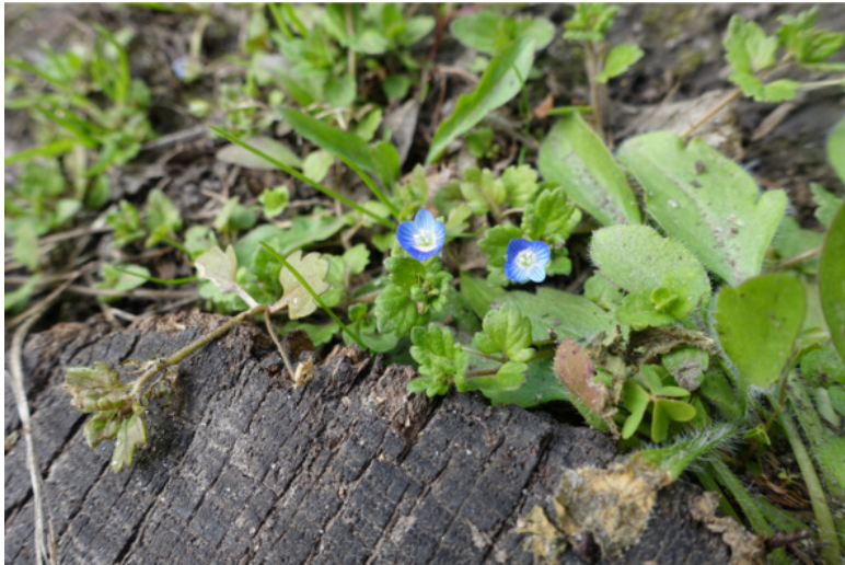
Рис. 25. Вероника персидская, лат. Veronica persica