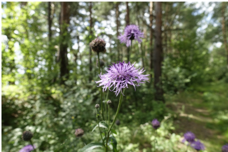
Рис. 21. Василёк шероховатый (василёк скабиозный), лат. Centaurea scabiosa