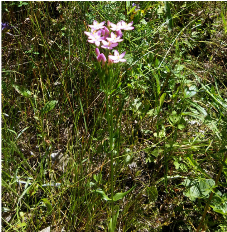
Рис. 47. Золототысячник (тирлич-трава), лат. Centaúrium