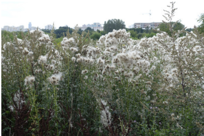
Рис. 14. Бодяк обыкновенный в стадии созревания семян, лат. Cirsium vulgare