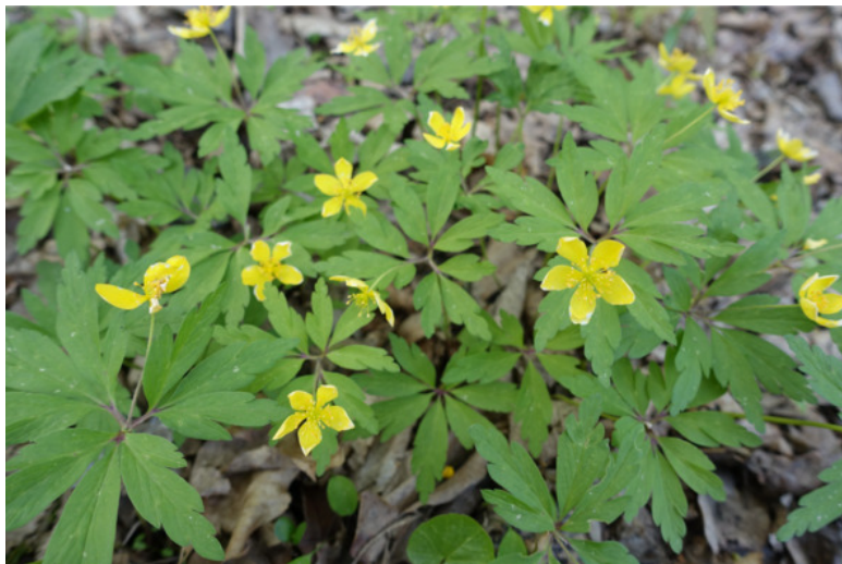
Рис. 28. Вѣтреница лютиковая (ветреница лютичная или лютиковидная), лат. Anémone ranunculoides