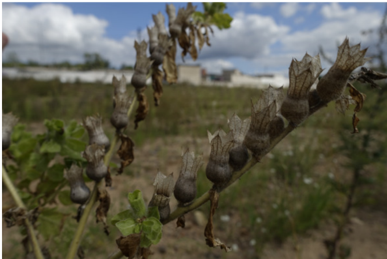
Рис. 10. Беленá чёрная в стадии созревания семян, лат. Hyoscyamus niger