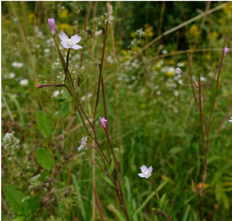
Рис. 53. Кипрей болотный, лат. Epilobium palustre