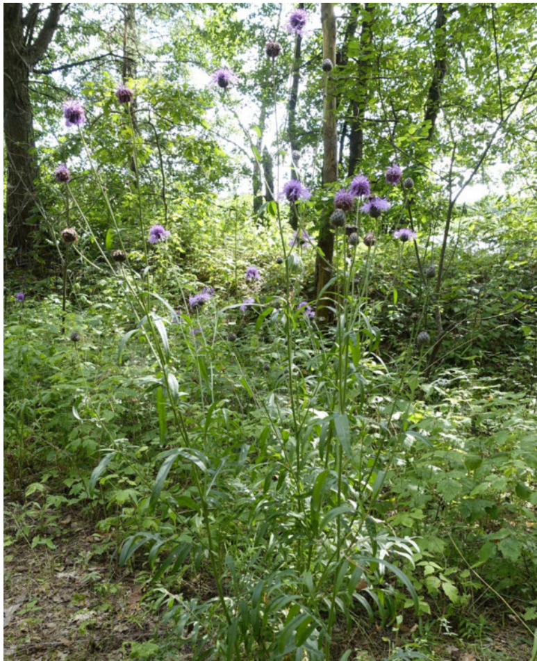
Рис. 20. Василёк шероховатый (василёк скабиозный), лат. Centaurea scabiosa