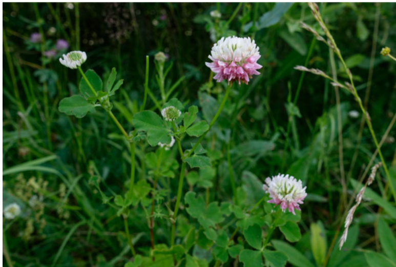
Рис. 58. Клевер розовый (клевер гибридный), лат. Trifolium hybridum