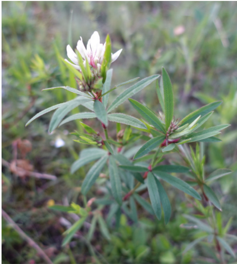
Рис. 59. Клевер Спрыгина, лат. Trifolium spryginii