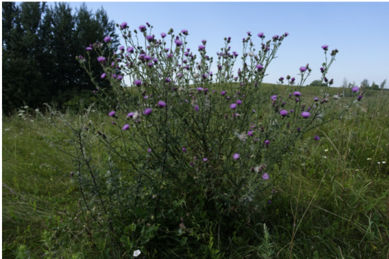
Рис. 12. Бодяк обыкновенный, лат. Cirsium vulgare