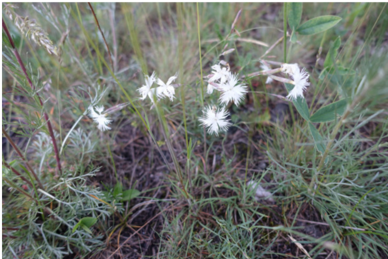
Рис. 30. Гвоздика Клокова, лат. Dianthus klokovii