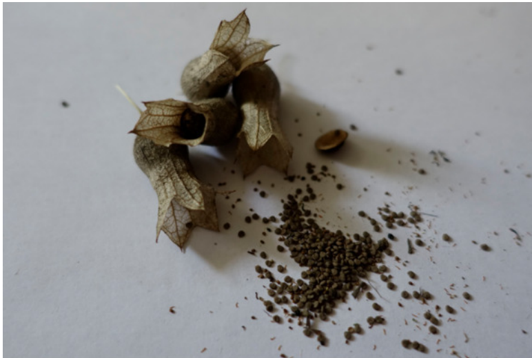
Рис. 11. Беленá чёрная – семена, лат. Hyoscyamus niger