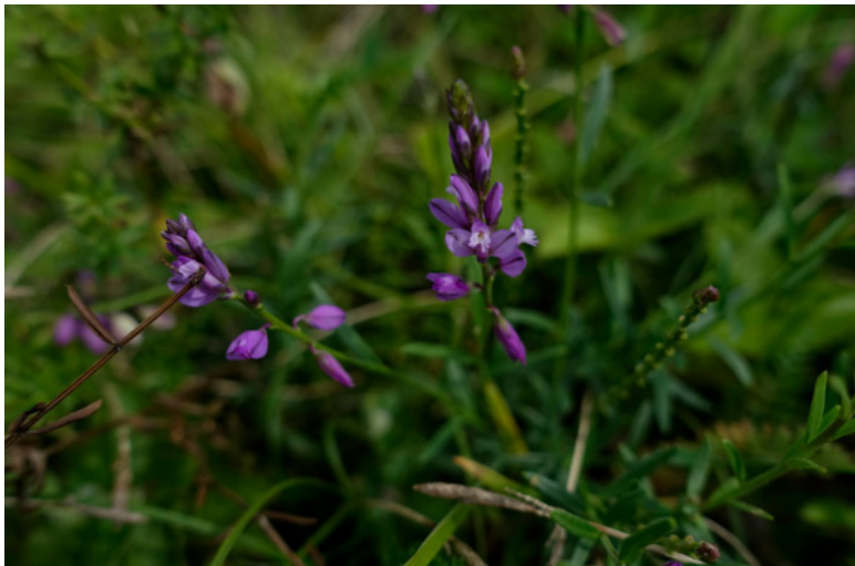
Рис. 50. Истод обыкновенный, лат. Polygala vulgaris