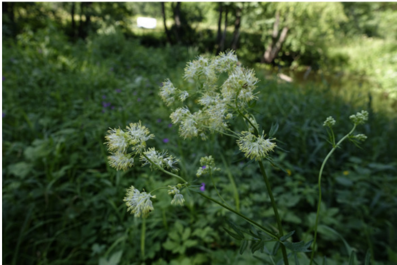
Рис. 22. Васили́стник жёлтый (васили́сник), лат. Thalictrum flavum