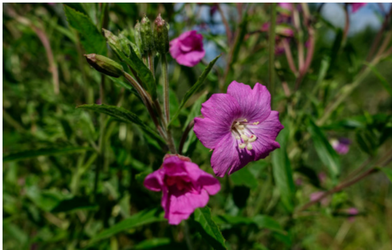
Рис. 55. Кипре́й волоси́стый, или мохна́тый, лат. Epilóbium hirsútum