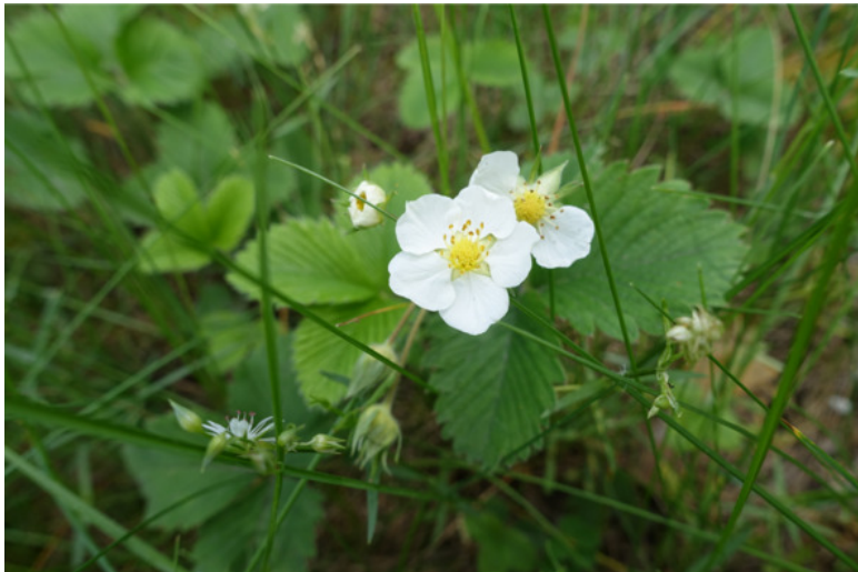
Рис. 42. Земляника лесная (земляника обыкновенная, дикая земляника, европейская земляника, лат. Fragaria vesca )