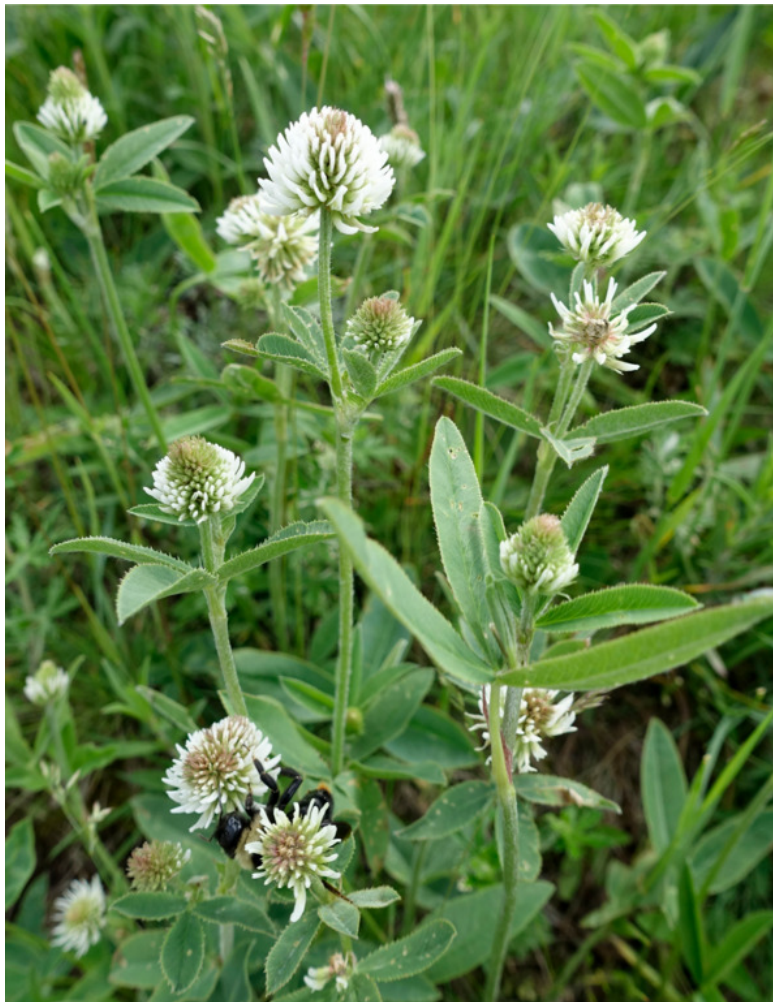
Рис. 57. Клевер горный, лат. Trifolium montanum