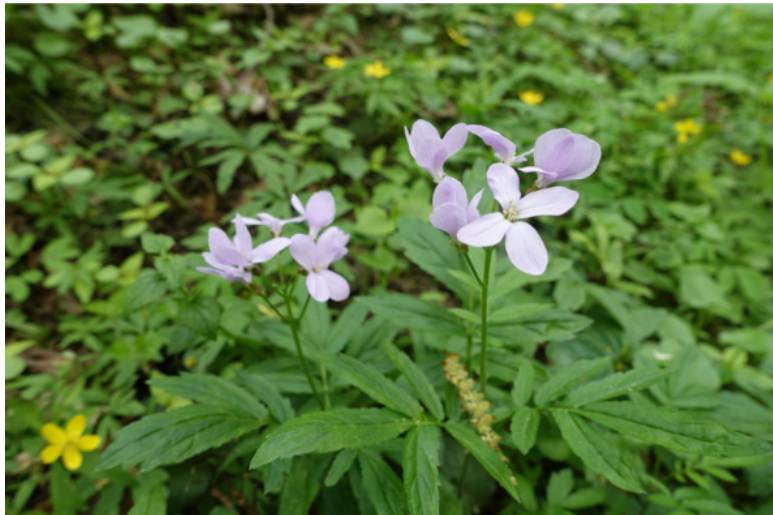
Рис. 48. Зубянка пятилистная, лат. Dentaria quinquefolia