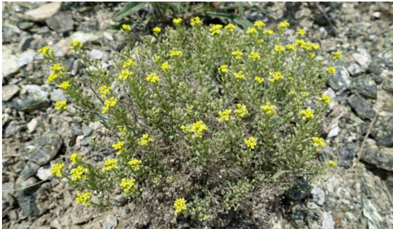
Рис. 17. Бурачок (каменник), лат. Alyssum