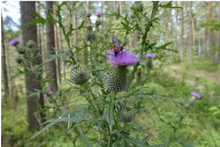
Рис. 13. Бодяк обыкновенный, лат. Cirsium vulgare