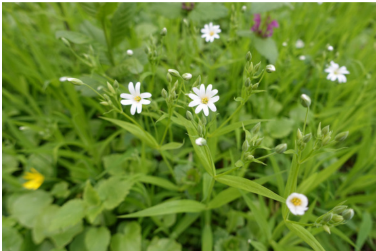
Рис. 40. Звездчатка ланцетовидная (звездчатка лесная, звездчатка жестколистная), лат. Stellaria holóstea