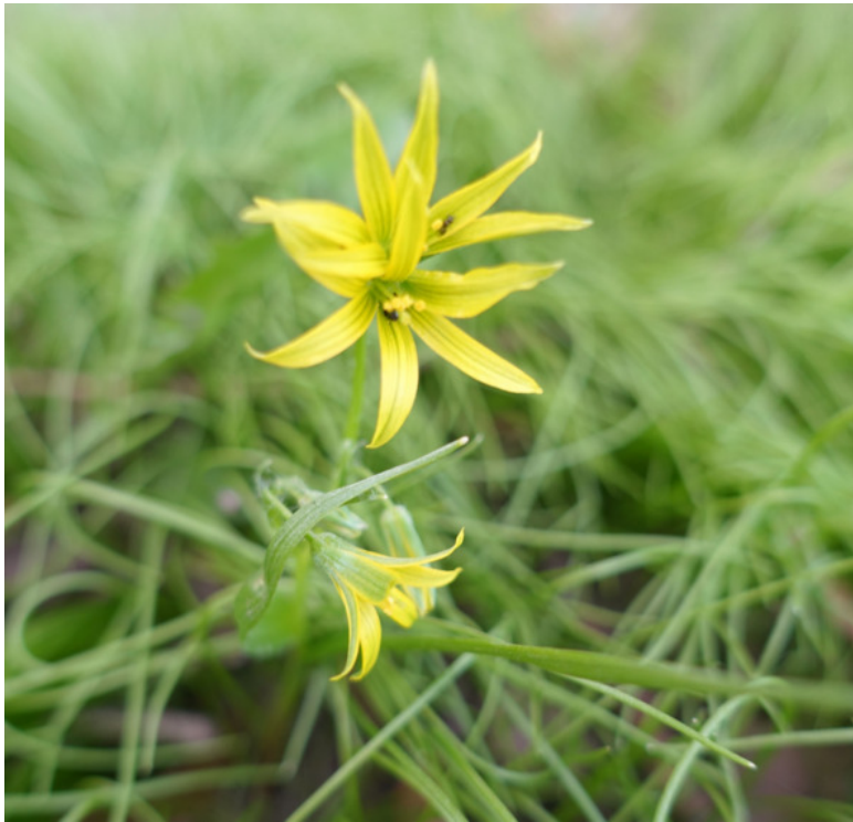
Рис. 36. Гусиный лук (птичий лук, или гейджия), лат. Gagea