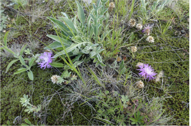
Рис. 18. Василёк Анны (псефеллюс Анны), лат. Pserphellus annae