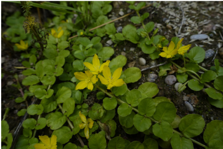
Рис. 23. Вербейник монетный (вербейник монетчатый, луговой чай), лат. Lysimachia nummularia