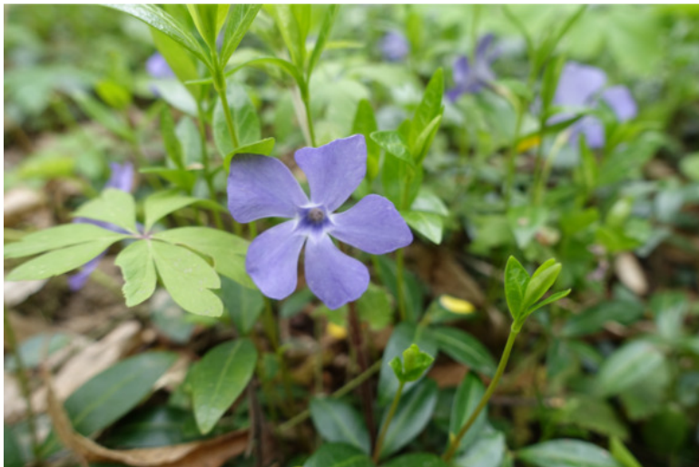
Рис. 6. Барвінок, лат. Vinca