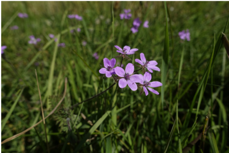
Рис. 2. Аистник обыкновенный (аистник цикутовый, или грабельки, или журавельник цикутовый), лат. Erodium cicutarium /Аистник Манескави, лат. Erodium manescavi