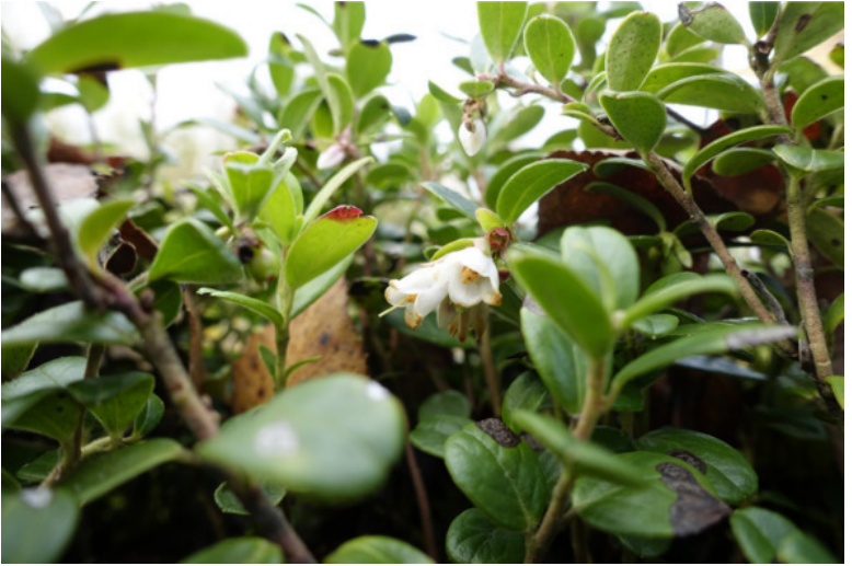
Рис. 16. Брусника, лат. Vaccinium vitis-idaea