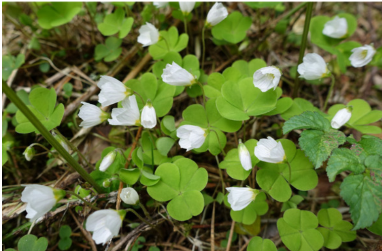
Рис. 56. Кислица обыкновенная, лат. Oxalis acetosella