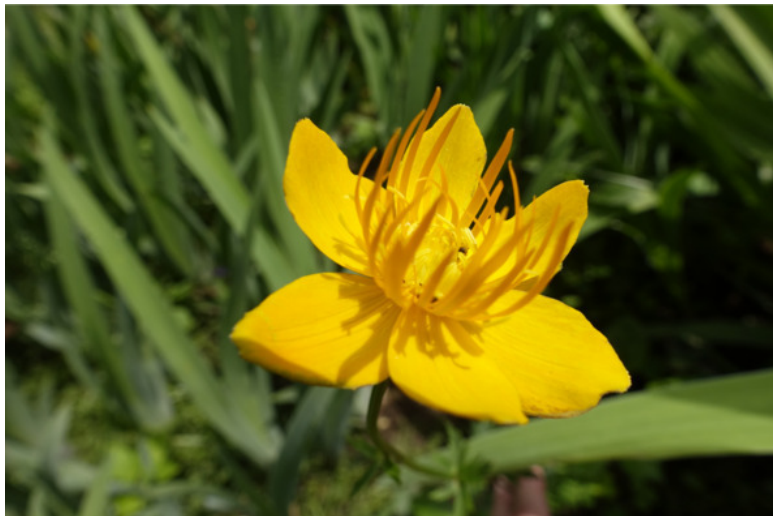
Рис. 64. Купальница китайская, лат. Trollius chinensis