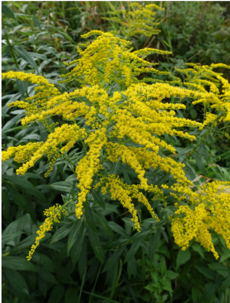
Рис. 46. Золотарник канадский, лат. Solidago canadensis