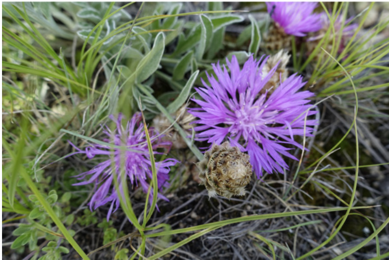
Рис. 19. Василёк Анны (псефеллюс Анны), лат. Pserphellus annae