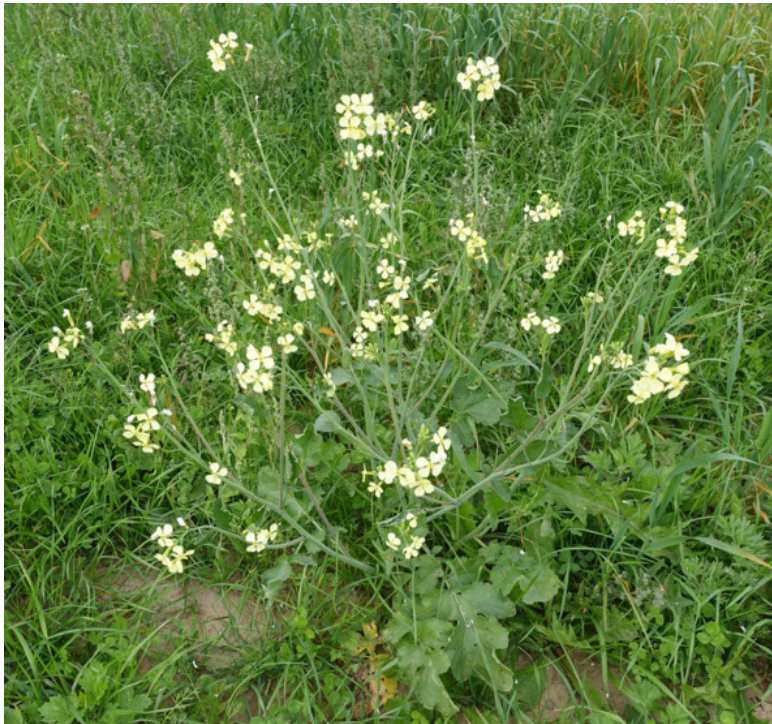
Рис. 34. Горчица полевая, лат. Sinapis arvensis