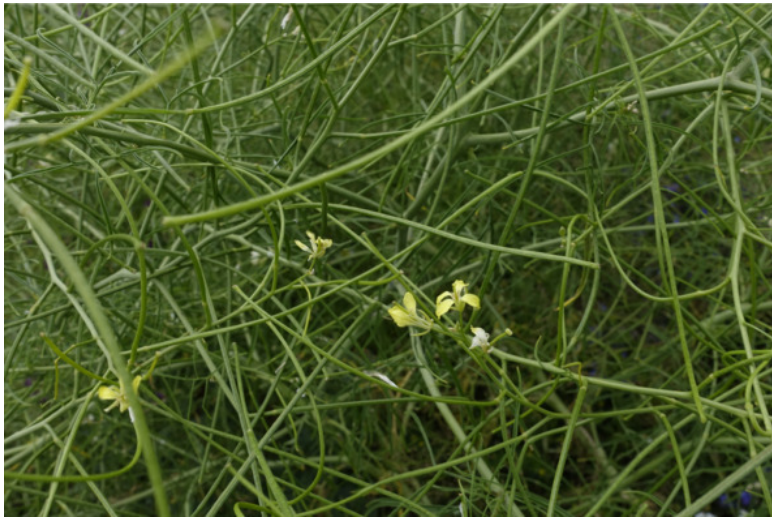
Рис. 35. Гулявник высокий, лат. Sisymbrium altissimum