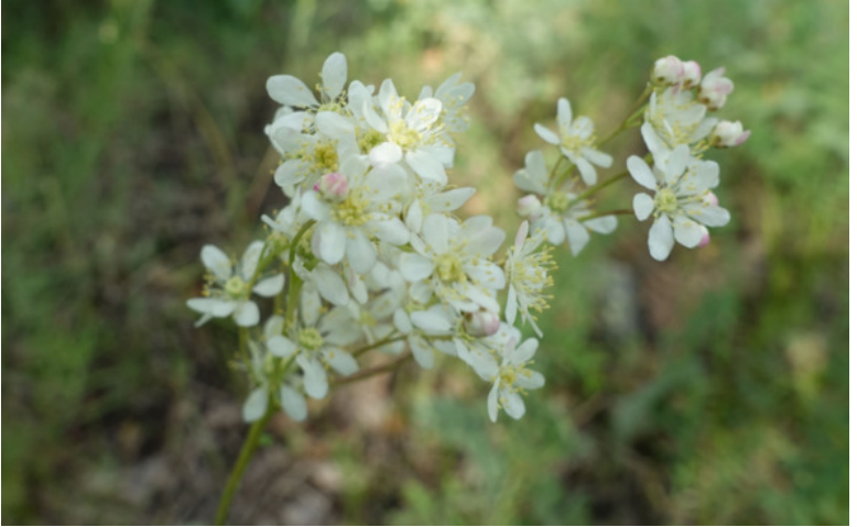
Рис. 65. Лабазник обыкновенный (таволга обыкновенная, лабазник шестилепестковый), лат. Filipendula vulgaris