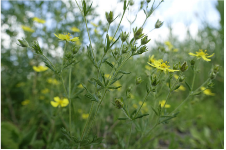
Рис. 67. Лапчатка прямостоячая (калган, лапчатка-узик, дубровка), лат. Potentilla erecta