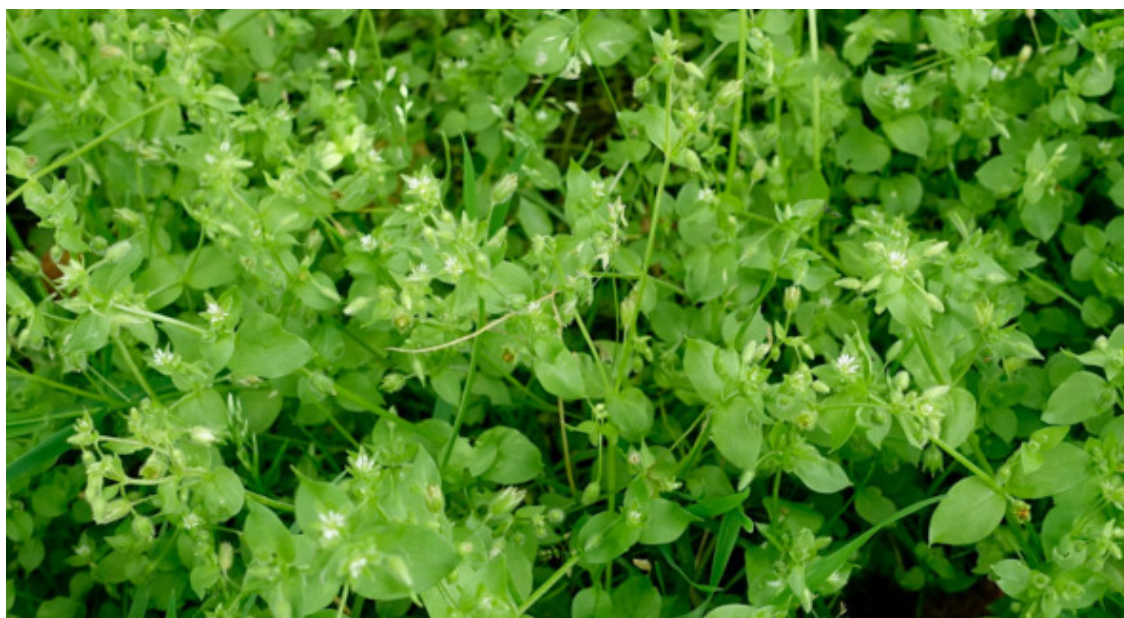
Рис. 41. Звездчатка средняя (мокрица, канареечная трава, мокричник, грыжник, сердечная трава, мокрец), лат. Stellária média