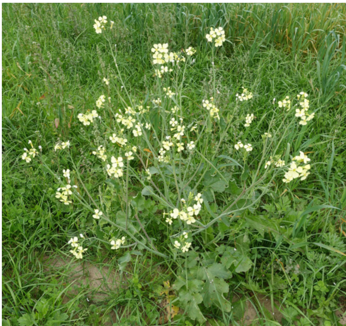
Рис. 34. Горчица полевая, лат. Sinapis arvensis