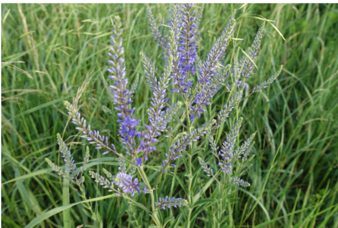
Рис. 24. Вербника ненастоящая (вероника лобная, или вероника метельчатая), лат. Veronica spicata