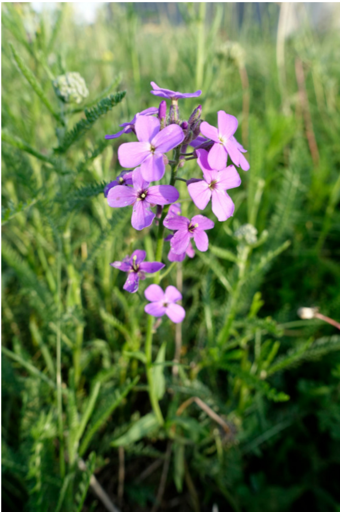
Рис. 29. Вечерница ночная фиалка (ночная фиалка), лат. Hesperis matronalis