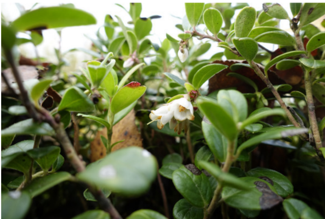
Рис. 16. Брусника, лат. Vaccinium vitis-idaea