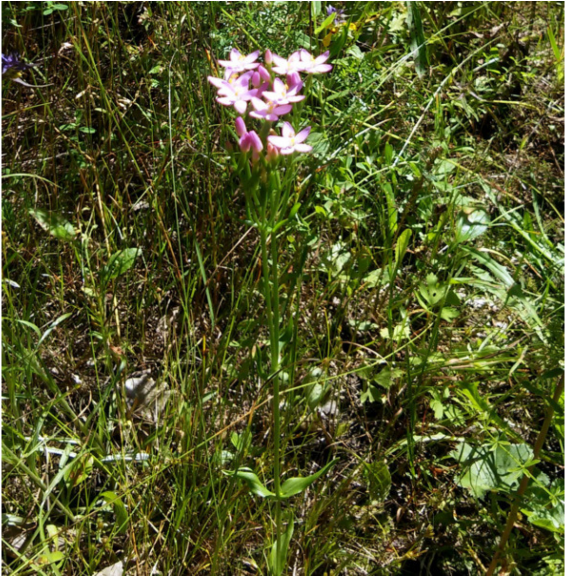
Рис. 47. Золототысячник (тирлич-трава), лат. Centáurium