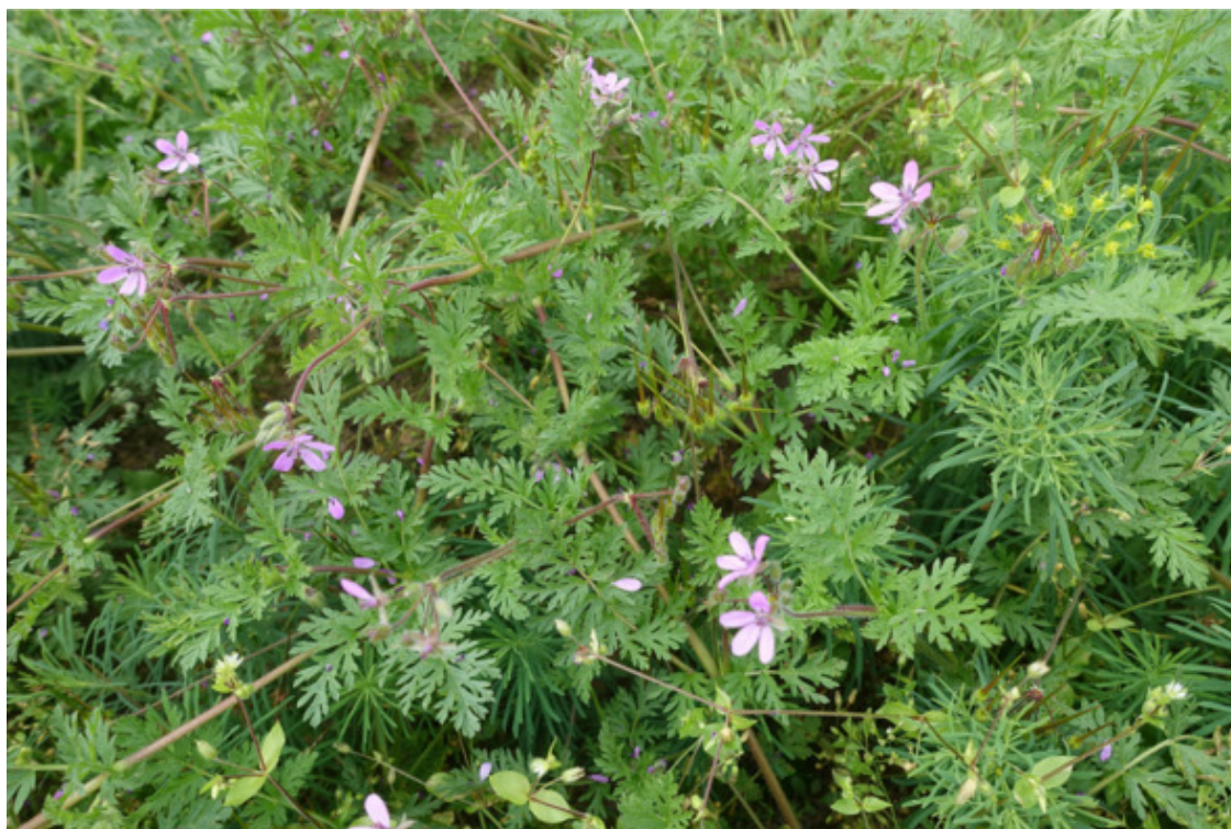
Рис. 1. Аистник обыкновенный (аистник цикутовый, или грабельки, или журавельник цикутовый), лат. Erodium cicutarium /Аистник Манескави, лат. Erodium manescavi