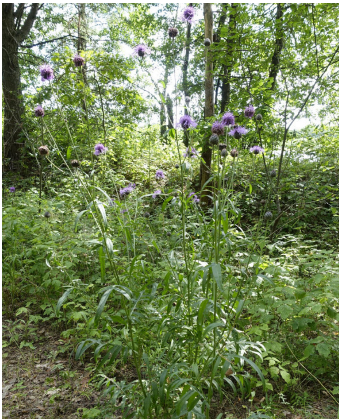
Рис. 20. Василёк шероховатый (василёк скабиозный), лат. Centaurea scabiosa