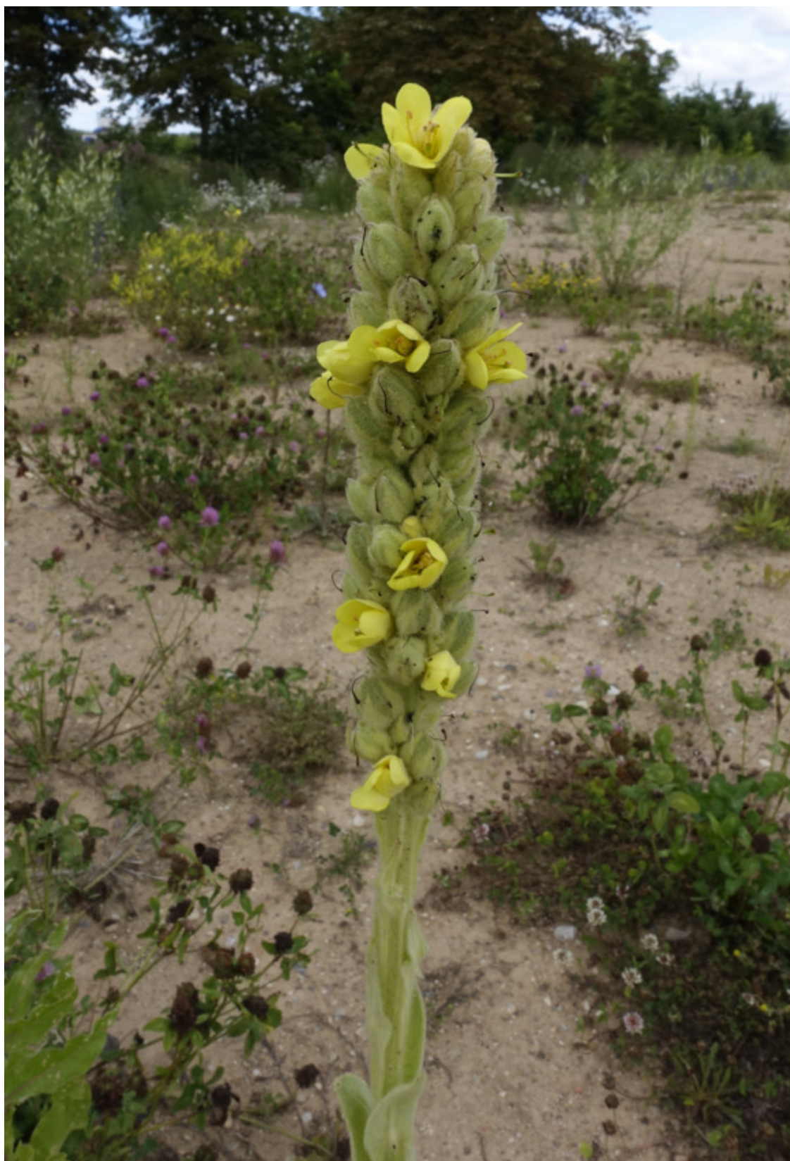
Рис. 62. Коровяк обыкновенный (медвежье ухо), лат. Verbascum thapsus