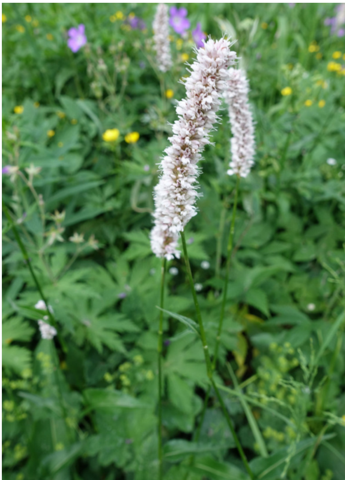
Рис. 43. Змеевик большой (горéц змеиный, раковые шéйки, змеиный кóрень), лат. Bistorta officinalis