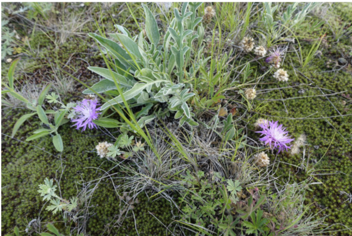
Рис. 18. Василёк Анны (псефеллюс Анны), лат. Pserphellus annae