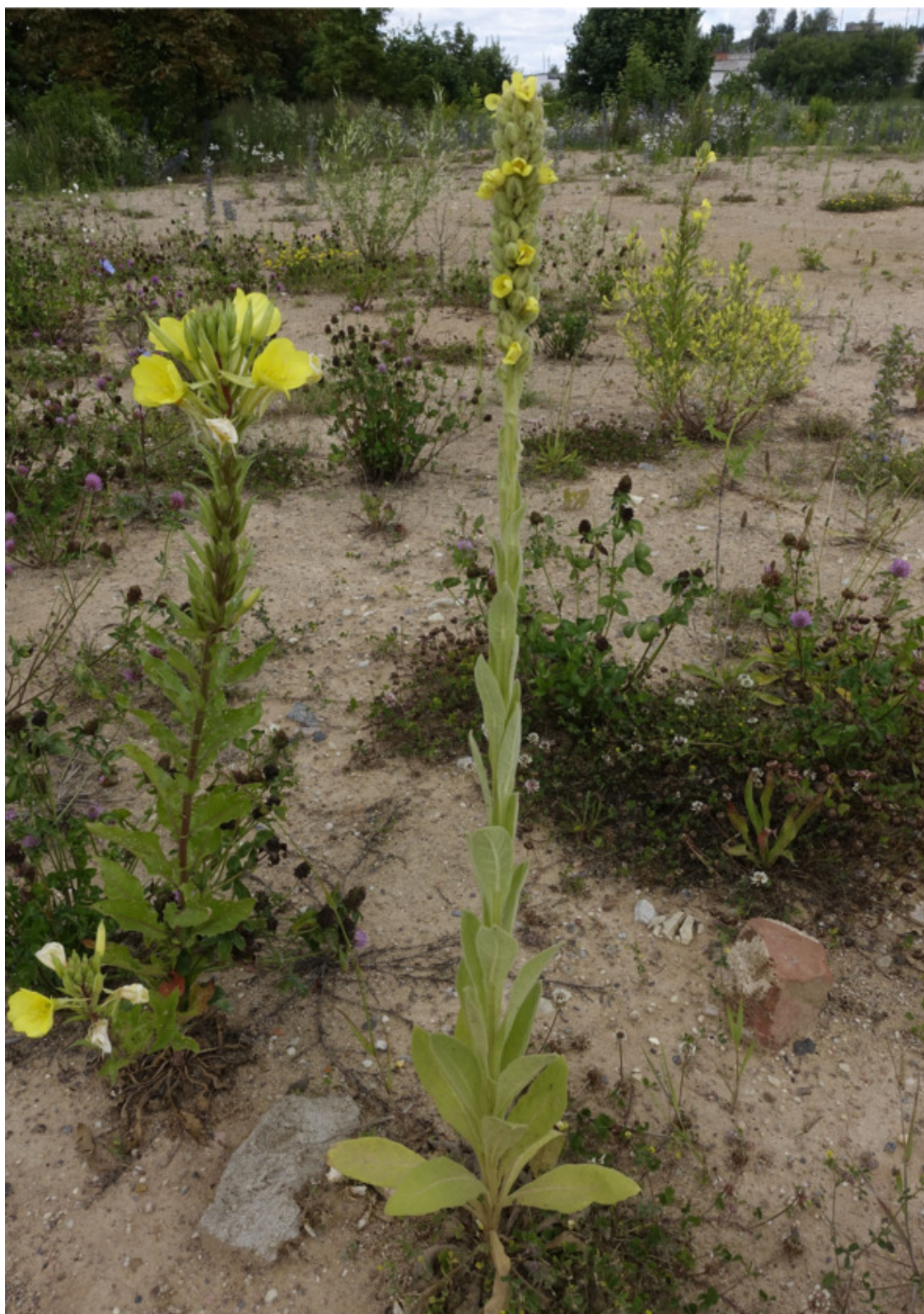
Рис. 61. Коровяк обыкновенный (медвежье ухо), лат. Verbascum thapsus