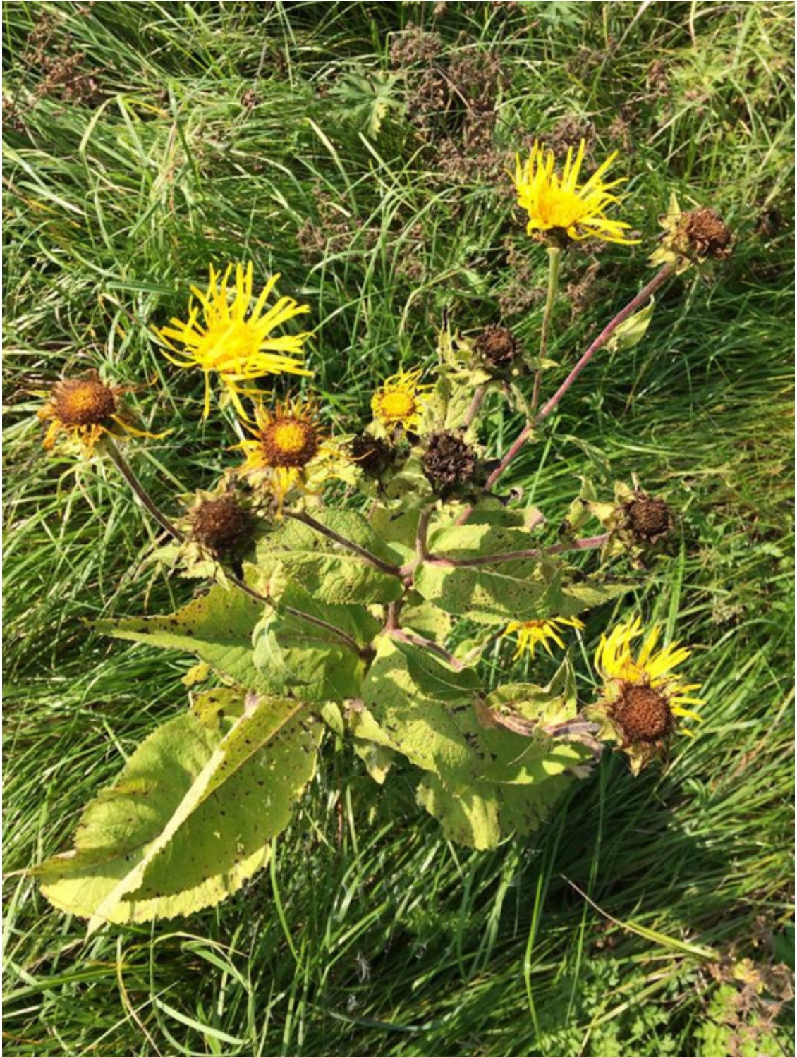
Рис. 37. Девясил (жёлтый цвет), лат. Inula