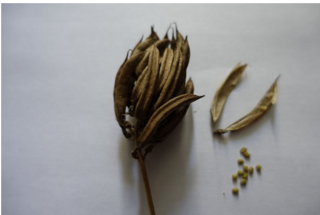
Рис. 4. Астрагал солодколистный (астрагал сладколистный) – семена, лат. Astragalus glycyphyllos