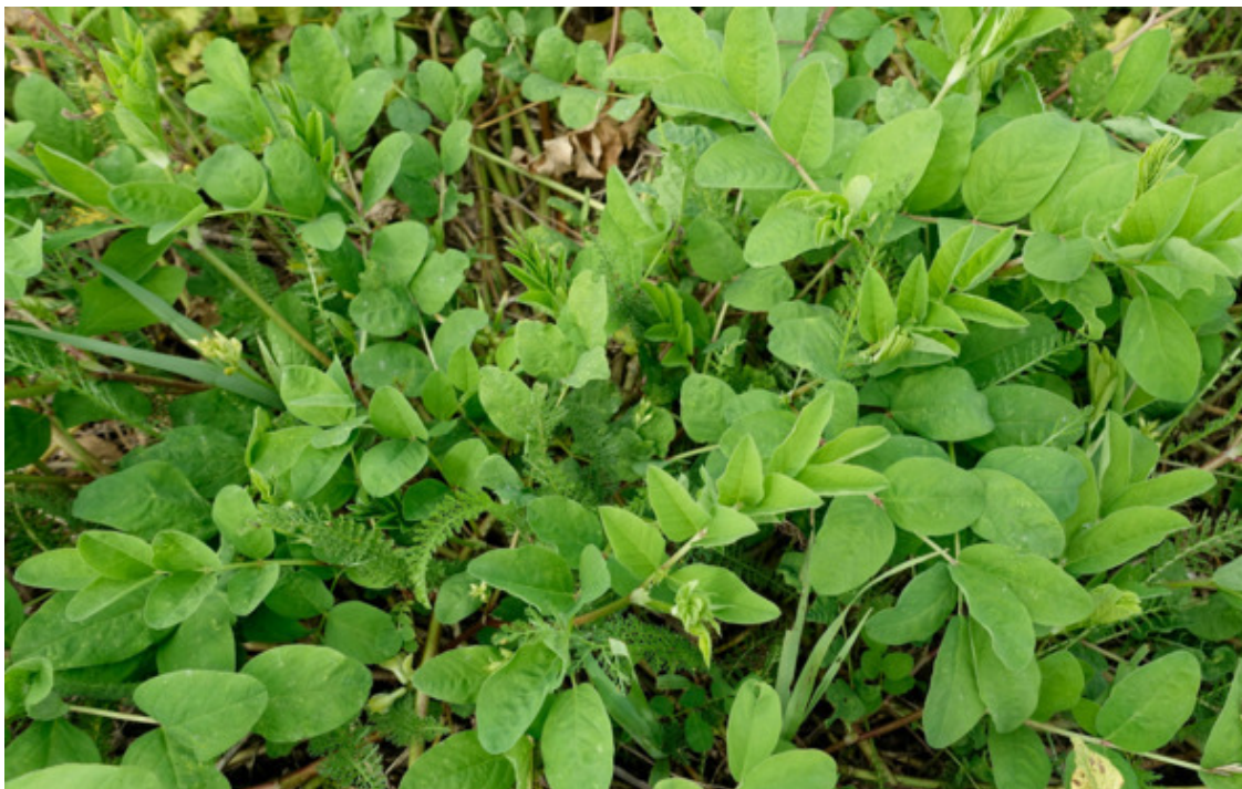
Рис. 3. Астрагал солодколистный (астрагал сладколистный), лат. Astragalus glycyphyllos