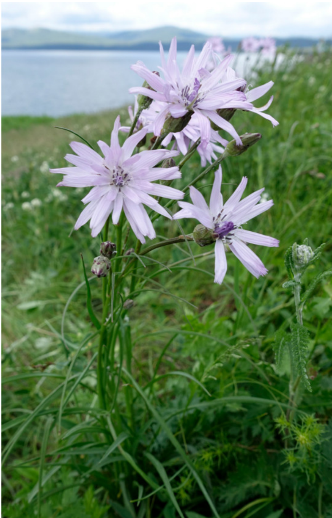
Рис. 60. Козелец розовый, лат. Scorzonera rosea