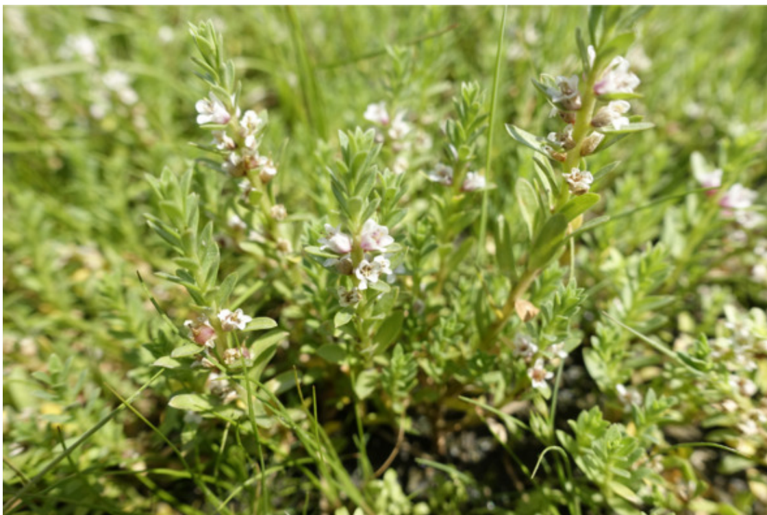
Рис. 32. Горéц птíчий (спорьíш птíчий), лат. Polygonum aviculáre