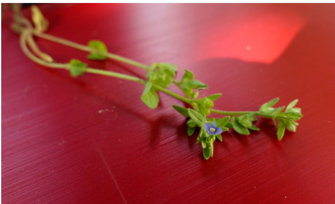
Рис. 26. Вероника полевая, лат. Veronica arvensis