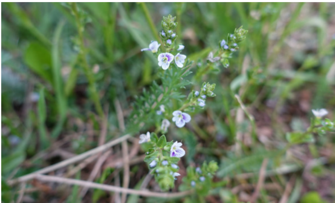
Рис. 27. Вербника тимьянолистная, лат. Verónica serpyllifolia