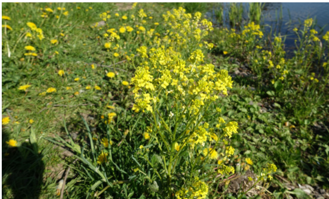
Рис. 39. Жерушник (жеруха), лат. Rorippa