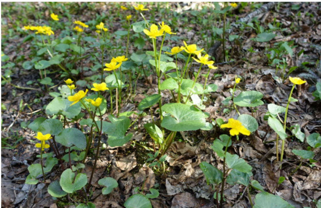
Рис. 51. Калужница болотная, лат. Caltha palustris