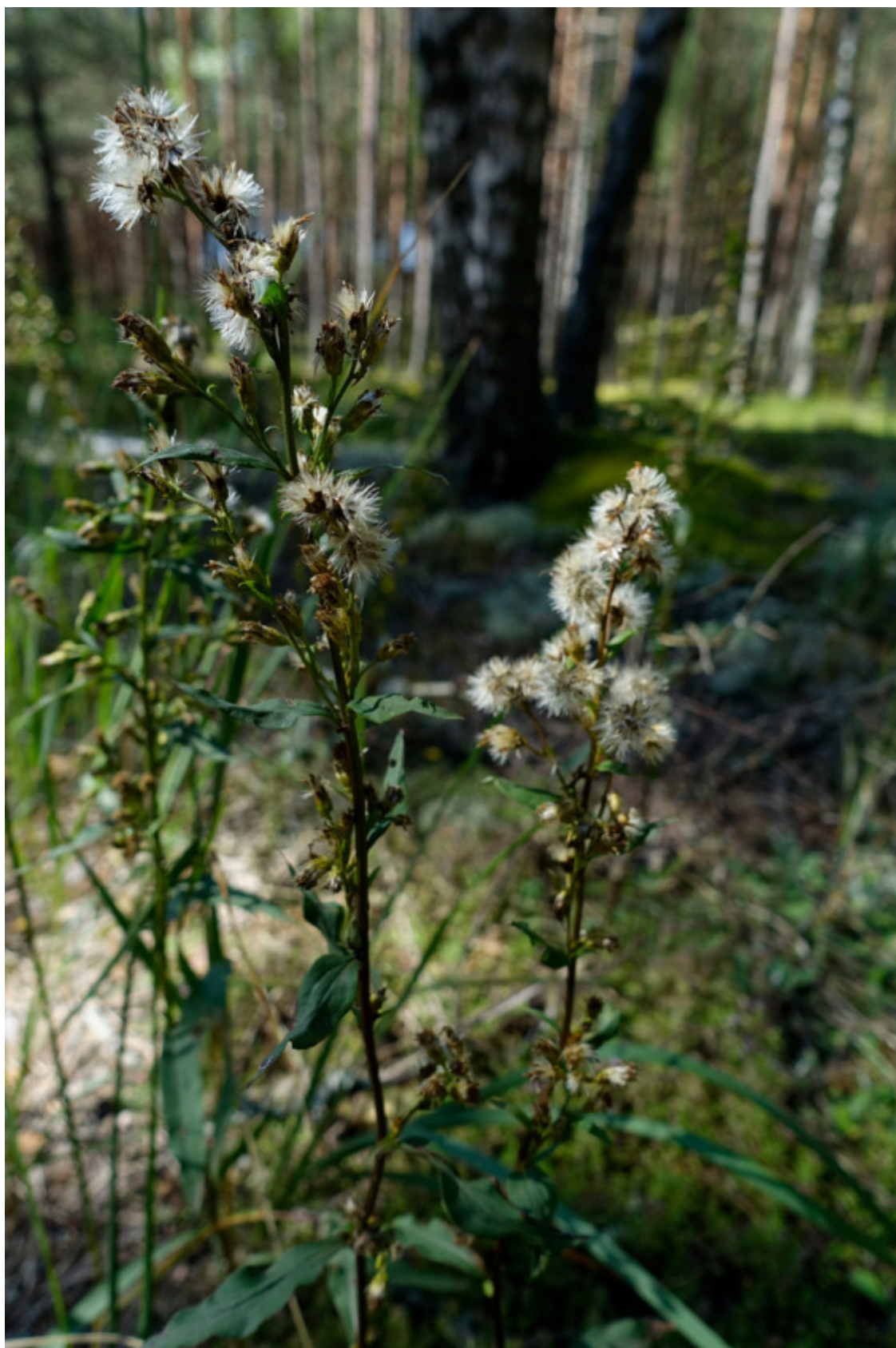
Рис. 45. Золотарник обыкновенный (золотая розга) в стадии созревания семян, лат. Solidago virgaurea