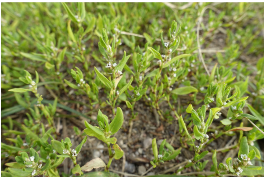
Рис. 31. Горéц птiчий (спорыш птiчий), лат. Polygonum aviculare