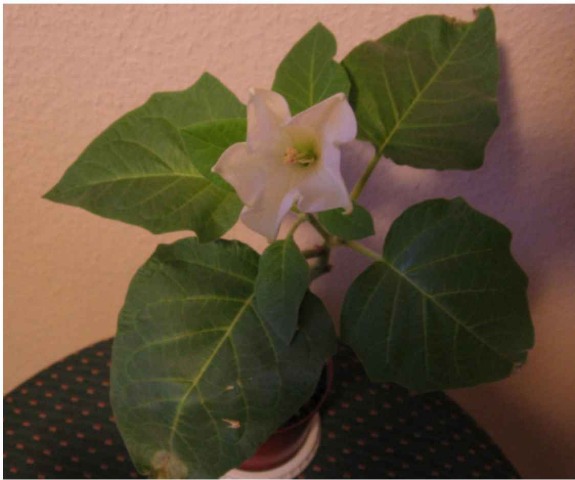
Рис. 38. Дурман, лат. Datura