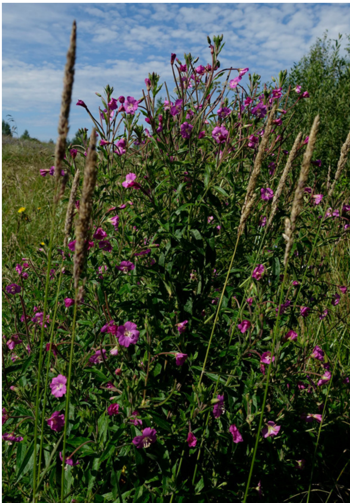
Рис. 54. Кипрѣй волосистый, или мохнатый, лат. Eriogonum hirsutum