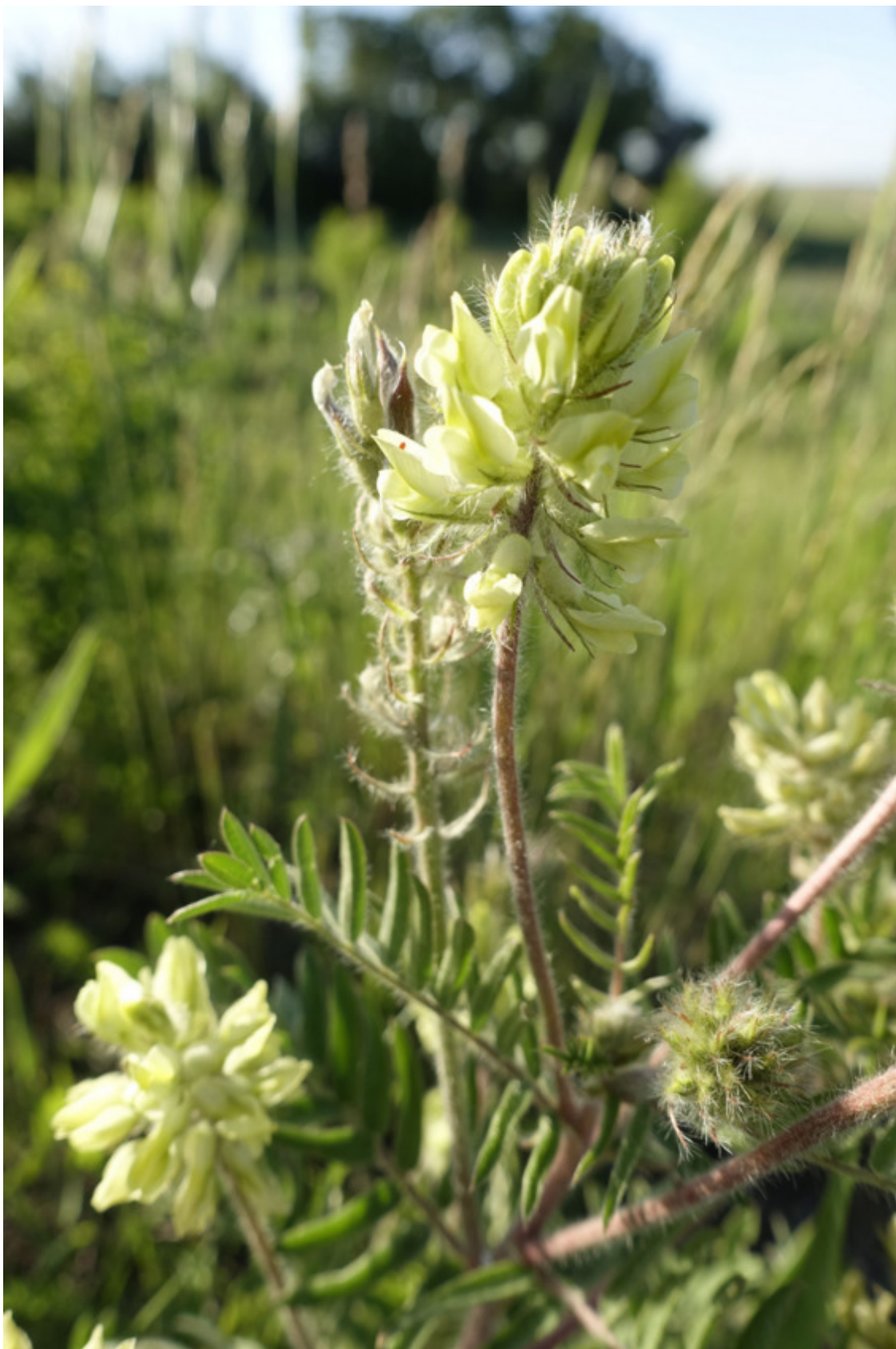
Рис. 5. Астрагал шерстистоцветковый, лат. Astragalus dasyanthus