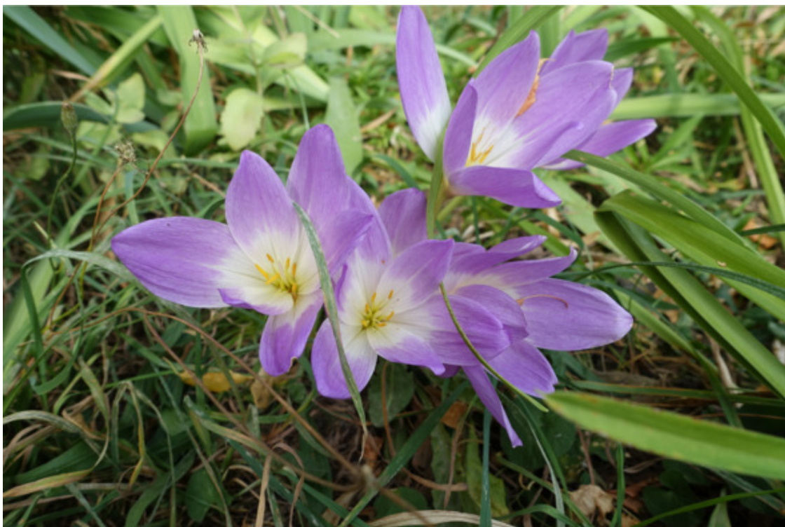
Рис. 8.Безвременник великолепный (дивный моровой шафран), лат. Colchicum speciosum