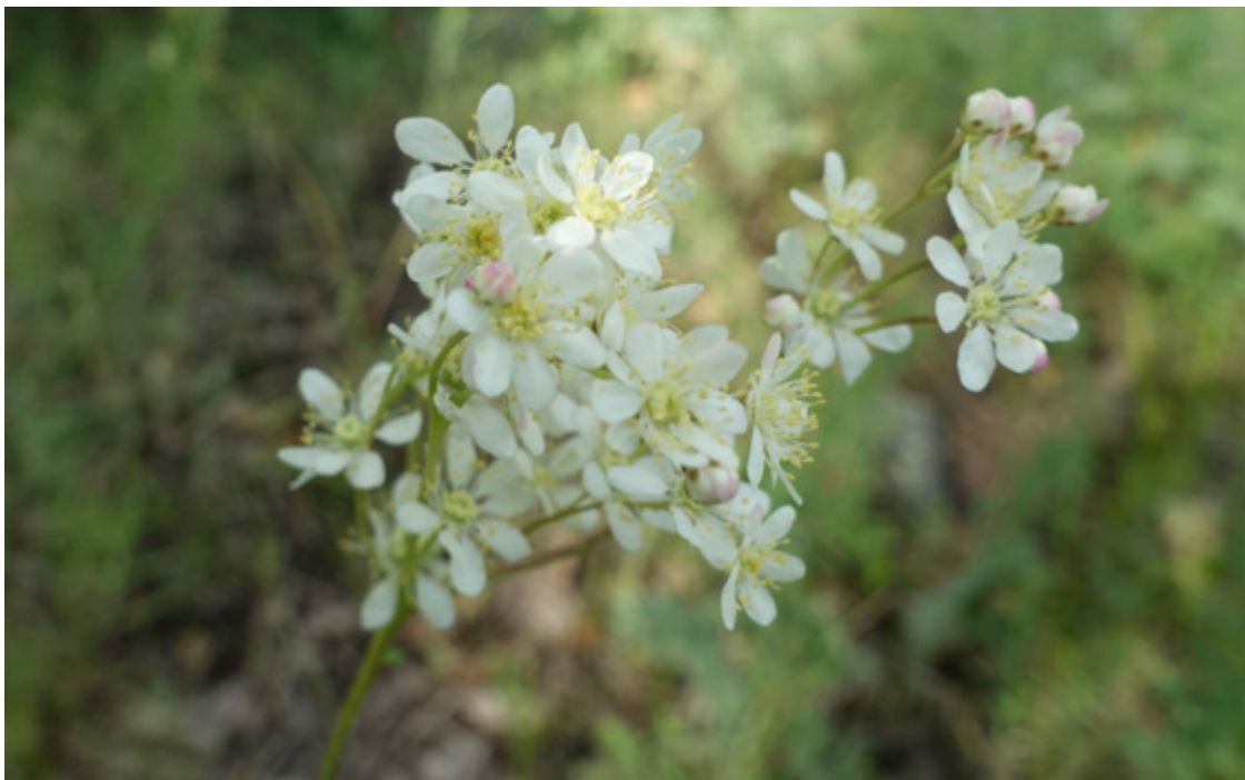
Рис. 65. Лабазник обыкновенный (таволга обыкновенная, лабазник шестилепестковый), лат. Filipendula vulgaris