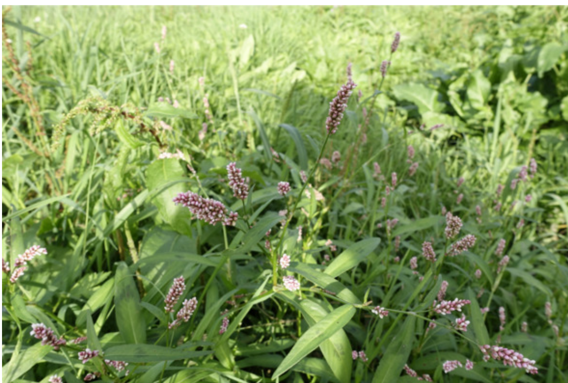
Рис. 33. Горéц почечу́йный (почечу́йная трава́, персика́рия пятни́стая), лат. Persicária maculósa