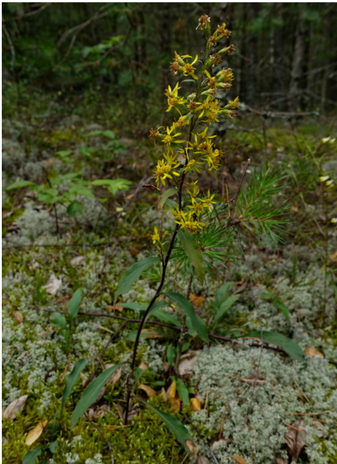
Рис. 44. Золотарник обыкновенный (золотая розга), лат. Solidago virgaurea