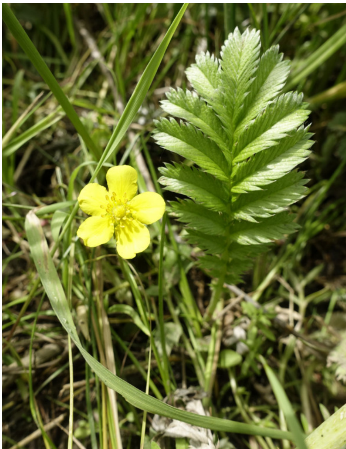
Рис. 66. Лапчатка гусиная (гусиная лапка), лат. Potentilla anserina