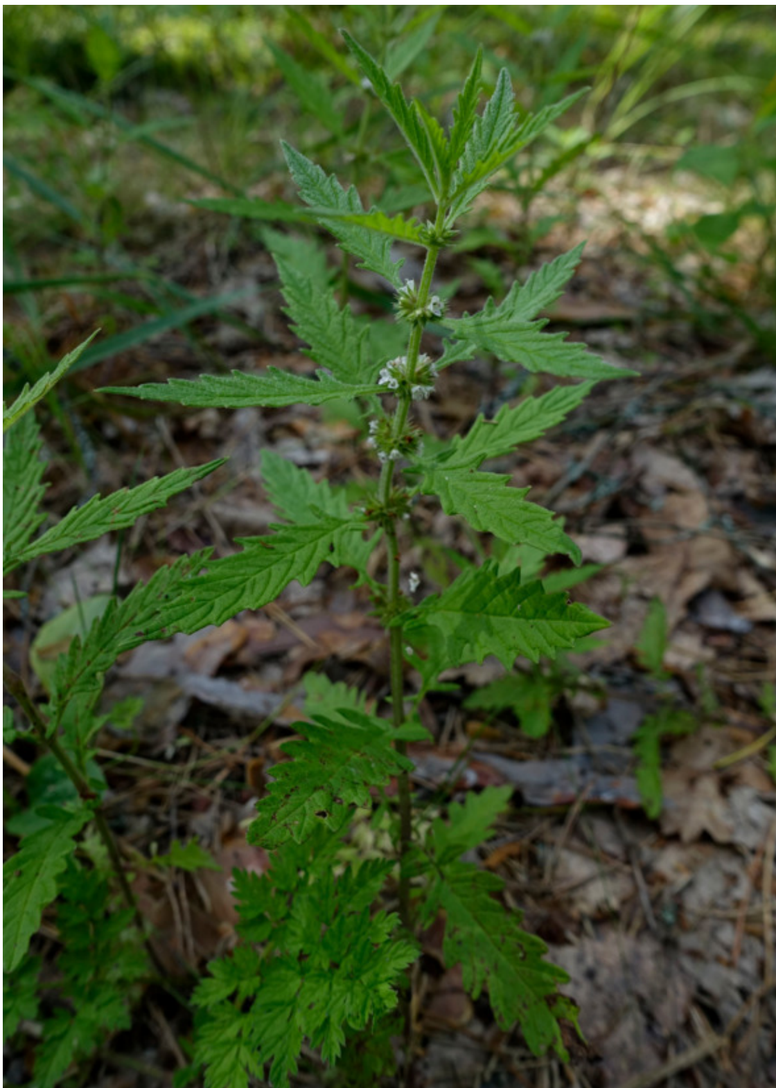
Рис. 49. Зюзник европейский, лат. Lycopus europaeus