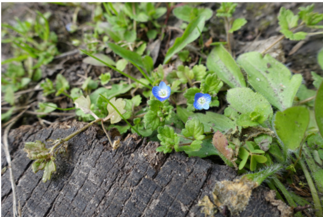
Рис. 25. Вероника персидская, лат. Veronica persica