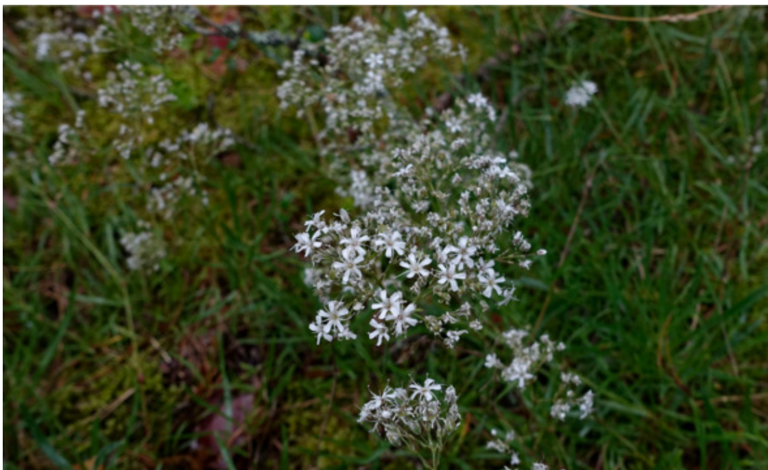
Рис. 52. Качим Патрэна (гипсофила, гипсолубка), лат. Gypsophila patrinii