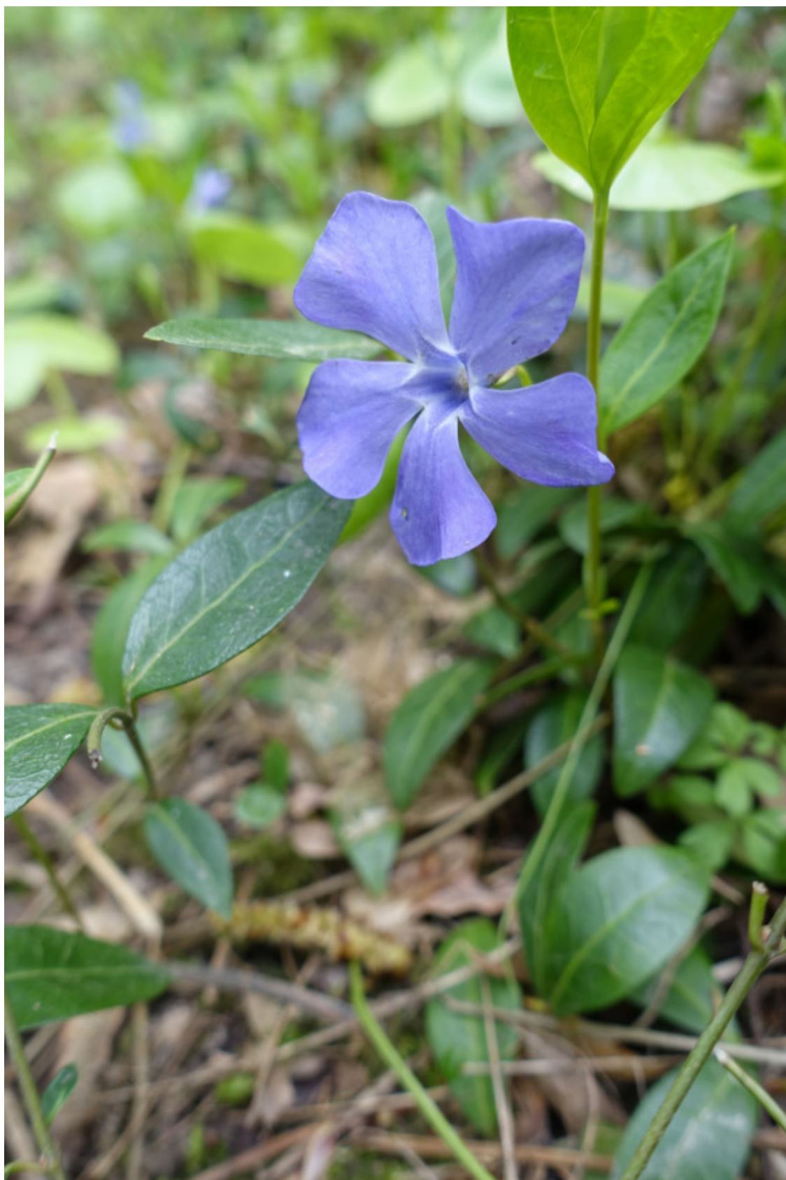
Рис. 7. Барвінок, лат. Vinca