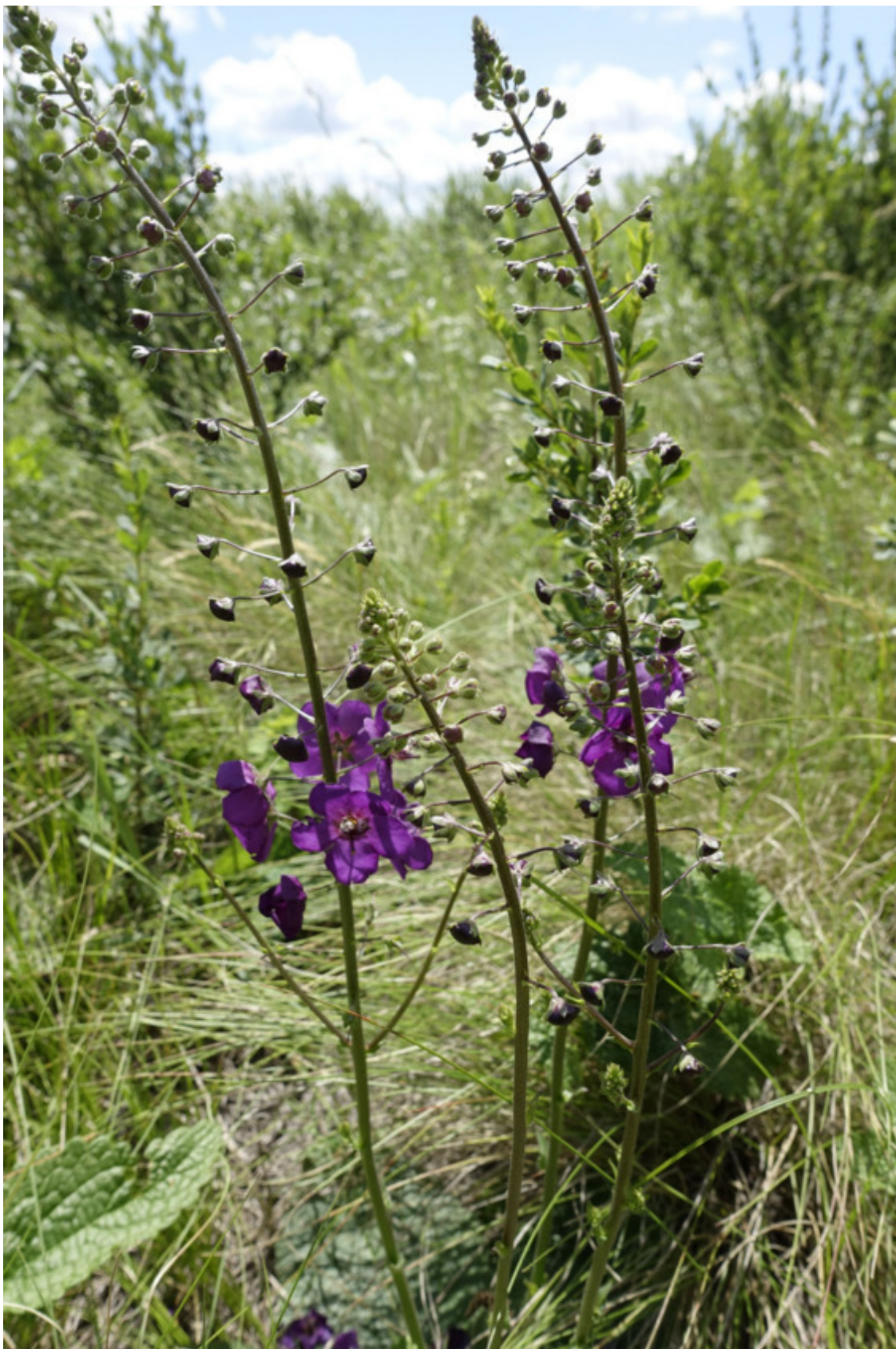
Рис. 63. Коровяк фиолетовый, лат. Verbascum phoeniceum