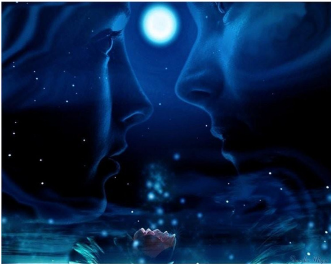
Картинка из интернета

Привет! Я пришёл с планеты, где ещё нет людей. Ты тоже оттуда, но в отличии тебя, я пришёл целиком. Меня во мне так много, что приходится себя прятать, – вдруг захотят частичку меня украсть! Я собой делюсь лишь с самыми близкими людьми. Однажды я заметил, что у мамы не хватает любви. Я взял из себя большой кусок этого чувства и подарил ей. Маме понравилось! Но потом она перестала его ценить. Оно испортилось от того, что им не пользовались и мама выбросила мой потухший кусок... Я немного грустил.