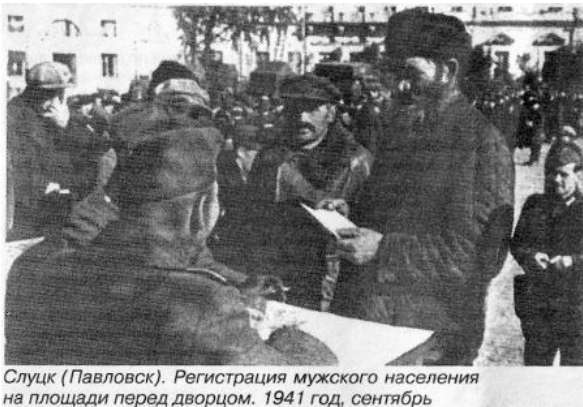
Слуцк (Павловск). Регистрация мужского населения на площади перед дворцом. 1941 год, сентябрь

В первые же дни оккупации в городе была проведена всеобщая регистрация населения, на которую явилось около 13 тысяч человек. Каждому из пришедших был присвоен личный номер. Затем немецким командованием была проведена отдельная регистрация мужчин в возрасте от четырнадцати до шестидесяти лет, которых оказалось достаточно много – около 4000 человек. После регистрации их загнали в помещения железнодорожной школы и подвалы дворца, а утром под охраной автоматчиков отправили в Гатчину. Там они содержались в концентрационном лагере в нечеловеческих условиях и большинство из них, около 3500 человек, погибли от голода, пыток и непосильного подневольного труда. То же самое происходило в это время и в соседнем Пушкине, где было собрано и отправлено в Гатчину около десяти тысяч (!) мужчин в возрасте от шестнадцати до пятидесяти