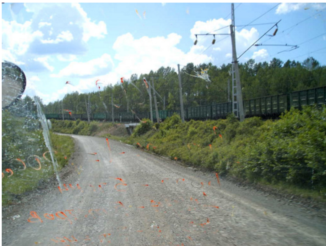
6. Крупный скальник, объезды мостов, грунтовки- просто пи***ц. Скорость 1—10.