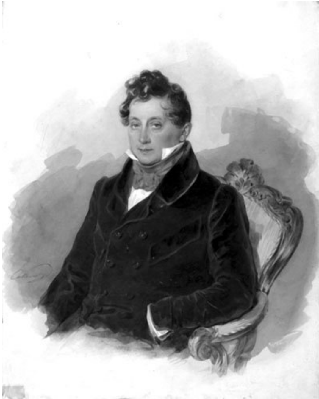
Портрет Михаила Виельгорского. Художник – Петр Соколов. 1840-е гг. Граф Михаил Юрьевич Виельгорский (1788–1856) – русский музыкальный деятель и композитор-любитель польского происхождения.