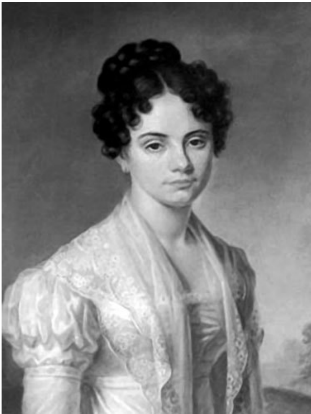
Портрет Марии Николаевны Волконской. Неизвестный художник. 1820-е гг.

Княгиня Мария Николаевна Волконская (1805–1863) – дочь героя Отечественной войны 1812 года генерала Николая Раевского. В январе 1825 года вышла замуж за будущего декабриста Сергея Волконского.