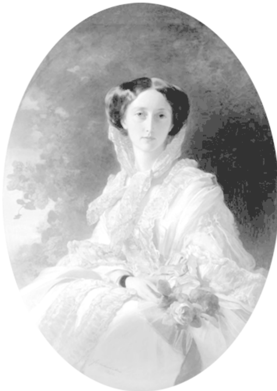
Портрет Ольги Николаевны Романовой. Художник – Франц Ксавер Винтерхальтер. 1856 г.

Ольга Николаевна (1822–1892) – дочь императора Николая I и императрицы Александры Федоровны, жена Карла I, короля Вюртембергского.