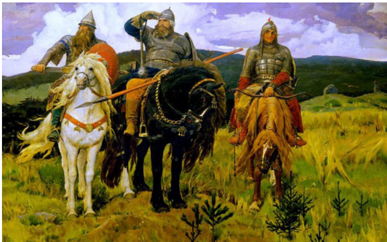
Добрыня Никитич, Илья Муромец и Алёша Попович

Также исторической личностью является и Алёша Попович по прозвищу «Алёшенька Леонтьевич», сын ростовского священника Леонтия. С детства отец обучал сына не только премудростям веры и духа, но и военному искусству, которым владел сам. Священники не имели право брать в руки оружие, а тем более убивать. Поэтому Леонтий передал Алёше «мягкую» систему ведения рукопашного боя, в которой акцент делался не на убийство врага, а на его физическое изматывание и пленение живым. Но в то же время Алёша Попович научился виртуозно владеть оружием, а особенно кистенем.