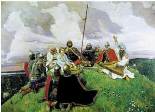
Тринадцать русских богатырей

Уже теперь ясно, что в среде древнего славянского, казачьего народа и Святой Руси было тринадцать богатырей, которые являлись представителями тринадцати направлений боя, как с оружием, так и без него: «Подъезжает к ним Илья, сходит с коня, входит в белый шатер. В том шатре сидят двенадцать русских могучих богатырей. Сидят богатыри, хлеб соль едят...». Вот их имена: Данила Игнатьевич, Вольга Ярославич, Святогор, Иван Годинович, Микула Селянинович, Дунай, Леонтий-священник, Ян Усмошвец, Добрыня Никитич, Михайло Поток, Алёша Попович и Тороп Иванович. Тринадцатым стал Илья Муромец.