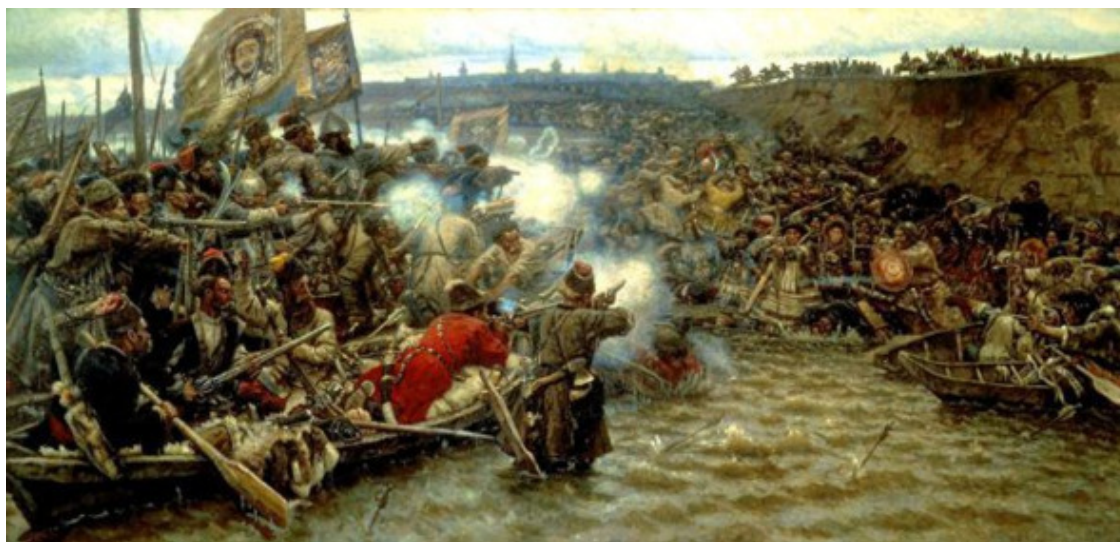
Казаки Ермака покоряют Сибирь

После начала преследования в Золотой Орде за христианское вероисповедание, в XIV в., большое количество алано-казацкого народа переселилось на Днепр, в украинские поселения. На Днепре в то время уже жили Черкасы-казаки, переселившиеся сюда в X в. и последующих веках и известные в русских летописях под именем «Чёрных клобуков». Наибольшее поселение этого народа было на правой стороне Днепра, по реке Роси. Земля эта в то время называлась Поросьем. Чёрные клобуки или Черкасы, как они называются в летописях, любили жизнь подвижную, но семьи свои берегли в укрепленных станах или городках. Все Черкасы служили в составе княжеских дружин, выполняя обязанности лёгких конных стрелков и разведчиков, умирив врагов своим грозным казацким оружием – копьями и саблями, которыми они владели в совершенстве. Черкасы, в Киевский период, являлись весьма важным сословием и принимали участие в народных советах и торжествах Киева, но в то же время твёрдо отстаивали свои права и вольности. Во время нашествия татар часть Черкасов отстояла свою независимость, укрывшись на Днепровских островах. Сохранившие свою волю Черкасы, первоначально назывались «Касаками островными», а потом казаками Запорожскими. К ним, во второй половине XIV века прикошевали 37 новые Черкасы, пришедшие с Кубани в числе нескольких тысяч семей. Они основали на правой стороне Днепра, ниже нынешнего Канева, стан, назвав его Черкассы.