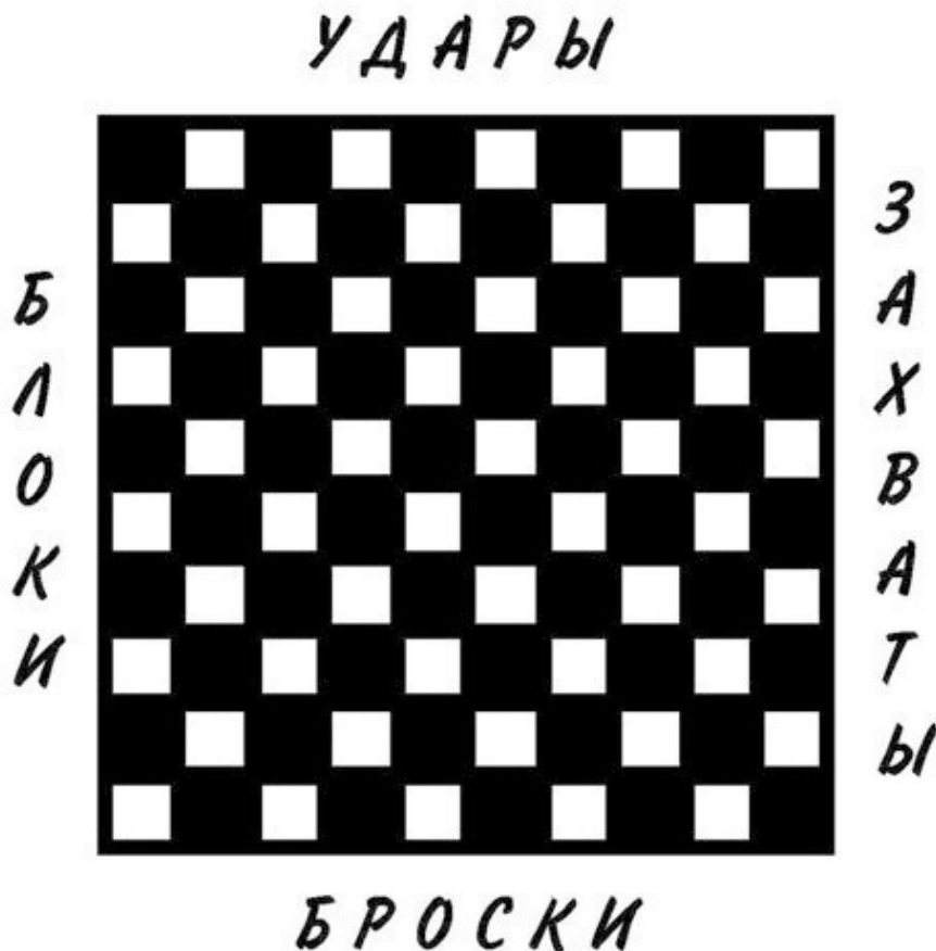
Доска для стокеточных шашек

опасности. Был проведён элементарный математический анализ, который показал, что если все технические элементы Агни Кэмпо выложить, например, на доску стокеточных шашек, то их варианты дают десятки тысяч приёмов, которые можно применить во множестве жизненных ситуаций. Однако, для успешного применения полученных знаний, бойцу также необходима высокая стрессоустойчивость. Для этого мы создали специальные методы дыхания, техники концентрации в рамках нашего стилевого направления, которые проверены многими годами деятельности и медицинскими исследованиями. Можно утверждать, что мы создали собственную школу медитативной практики. Наши методы не только делают из человека хорошего бойца, но создают из него гармоничную личность, способную приносить пользу людям.