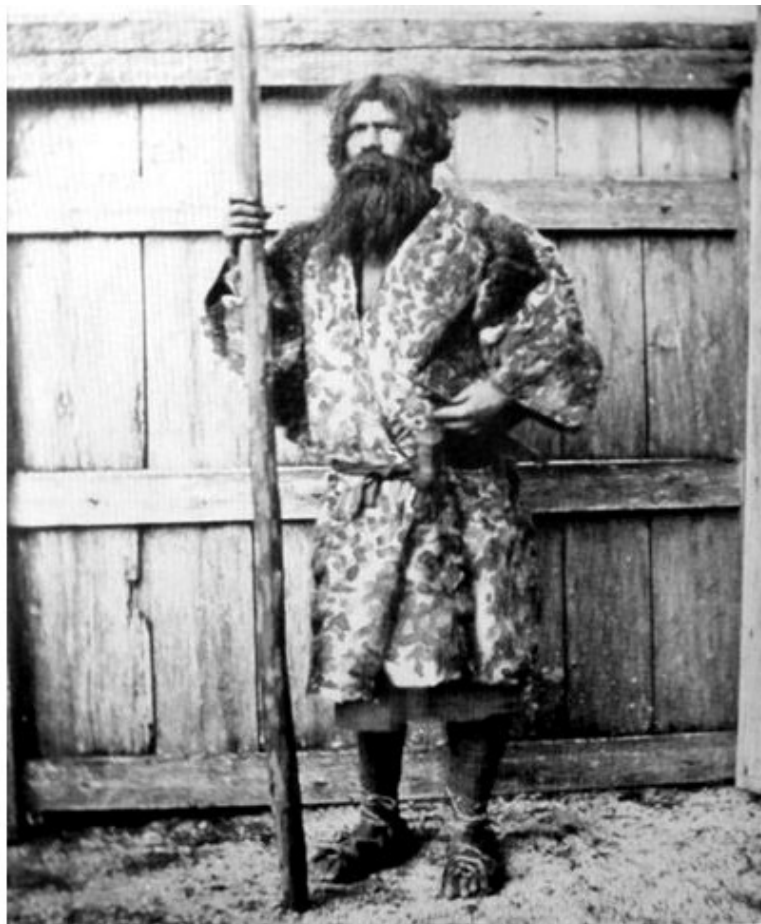
Типичный представитель народа айну. Конец XIX начало XX в.в.

у представителей правящего класса так часто отличаются от современных японцев. Самураи – потомки айнов приобрели такое влияние и престиж в средневековой Японии, что породнились с правящими кругами и привнесли в них кровь айнов, в то время как остальное японское население было в основном потомками монголоидной расы».