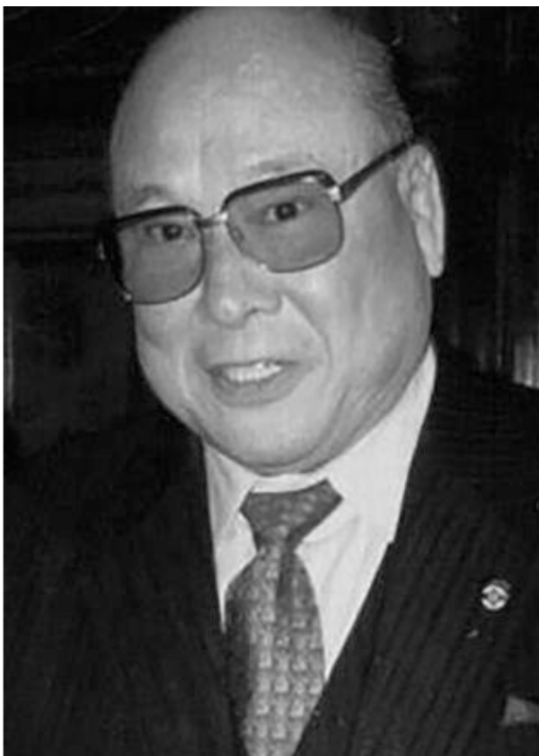
Основатель Кёкусинкай каратэ Сосай Масутацу Ояма

Это турне показало, что наша система не только не уступает восточным единоборствам, но и во многих аспектах превосходит их традиционалистские воззрения. После нашего возвращения в Украину мы официально зарегистрировали «Международную Организацию Универсального Кулачного боя Ю.А.Кострова Агни Кэмпо», тем самым узаконив наш стиль – УКБ Агни Кэмпо.