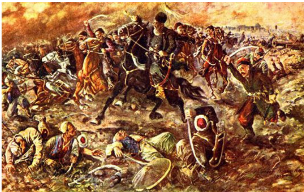
Гетман-характерник Пётр Сагайдачный побеждает турецкое войско

В Ведические времена зародилось такое явление, как магия. Владели этой магией волхвы, которые обучали ей специально отобранных подростков, раскрывая заложенные в них способности и таланты, и направляя их по пути служения человечеству. Магия распространялась, практически, на все сферы жизнедеятельности: хозяйственную, бытовую, сферу здоровья и охраны окружающей среды, а также на деятельность, связанную с военным искусством. В прежние времена было не принято говорить о военной магии, но она была настолько действенной и глобальной, что от неё, очень много было взято боевыми искусствами стран Востока и восточными эзотерическими школами. Вся наша древняя, праотцовская, ведо-вестийская вера была основана на знаниях способствующих раскрытию божественной природы человека. Военная магия использовалась для выживания в среде враждебных государств, как способ ведения успешных боевых действий против войск врага. В более поздние времена, военные маги служили в казацких войсках, так как владели огромной магической силой, волей, характером, т.е. были характерниками. В самой Сечи казаков-характерников очень ценили, любили и уважали, а враги боялись больше огня. Смелость и неустрашимость, презрение к боли и смерти казаков-характерников встречается в художественной литературе, в исторических писаниях, а особенно в военных донесениях и народном эпосе. Самым высоким рангом в казачестве обладали казаки-сечевики, но наивысший статус имели казаки-характерники.