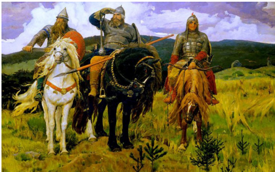
Добрыня Никитич, Илья Муромец и Алёша Попович