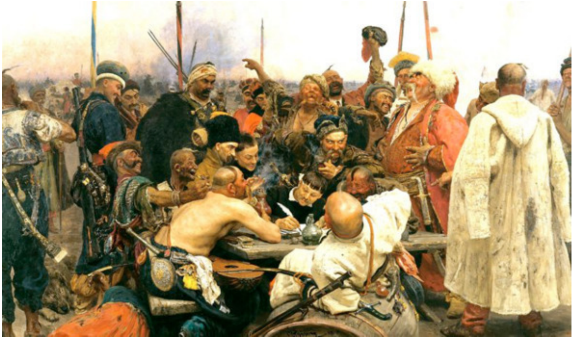
Запорожские казаки пишут письмо турецкому султану