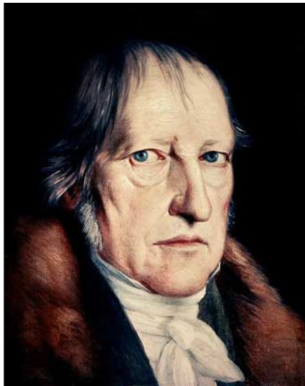
Георг Вильгельм Фридрих Гегель