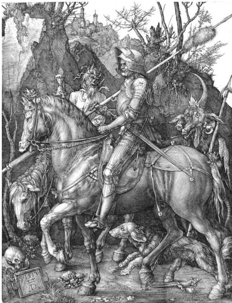
А. Дюрер – «Рыцарь, смерть и Дьявол»