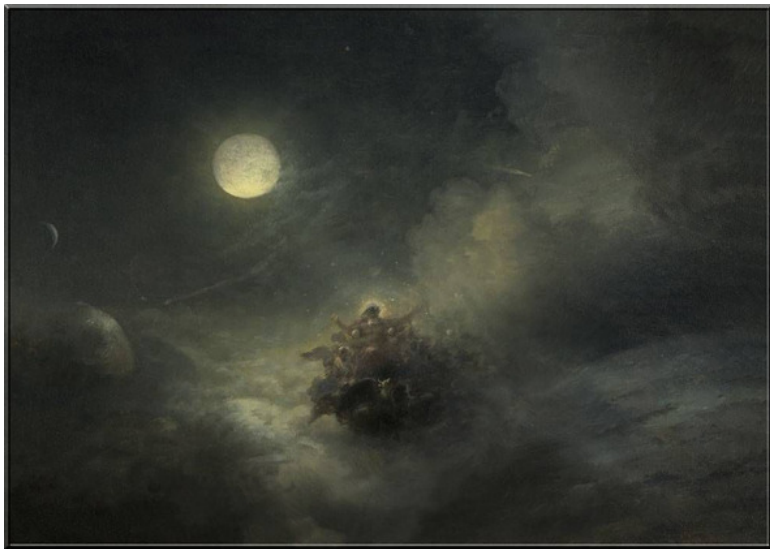
И. К. Айвазовский – «Сотворение мира. Хаос»