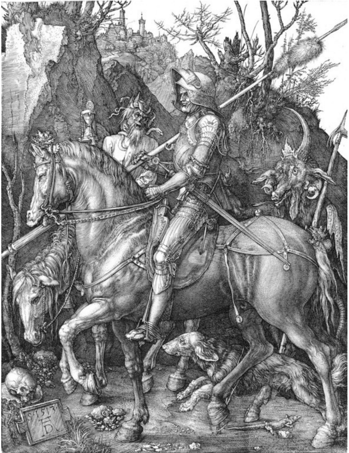
А. Дюрер – «Рыцарь, смерть и Дьявол»