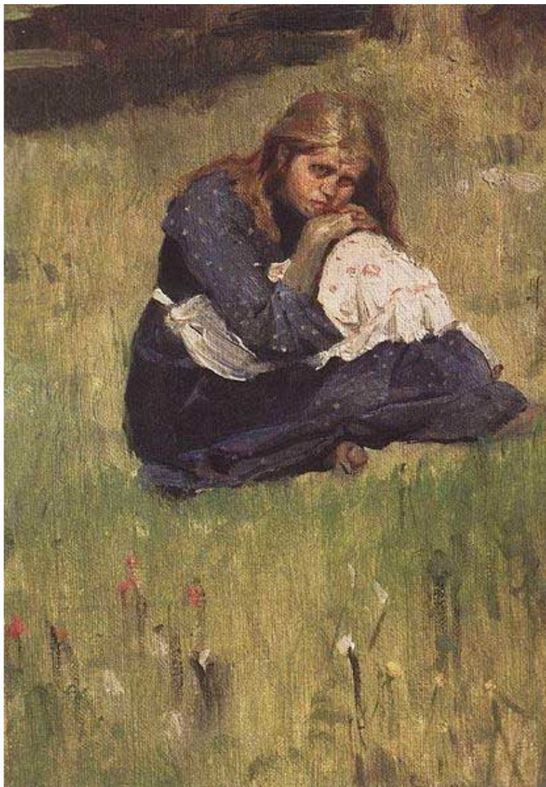
В. Васнецов – «Аленушка»

...Меня звали «волчонком». В куклы я не играла, платья не шила, тряпочных младенцев не кормила – я росла непослушным ребенком, единственной в своей семье. Я любила выбираться вместе со знакомыми мальчишками в болотистую местность за дикой кислой клюквой; пропадала в лесу, собирала нежными руками зверобой и бессмертник, рвала жгучую крапиву. Звери не трогали меня. Чаше подходили, чтобы выпросить сладкий кусочек сахара, который я клала в передник, собираясь на прогулку.