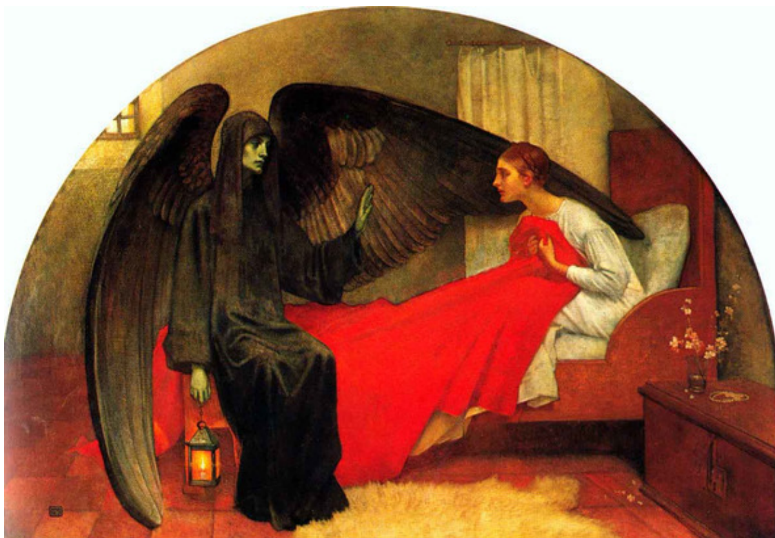
Marianne Stokes – «La Jeune fille et la Mort»

...На следующее утро от былой девичьей красоты не останется даже следа: глаза приобретут стеклянный блеск, а кожа покроется уродливым пятнами. Как жаль.