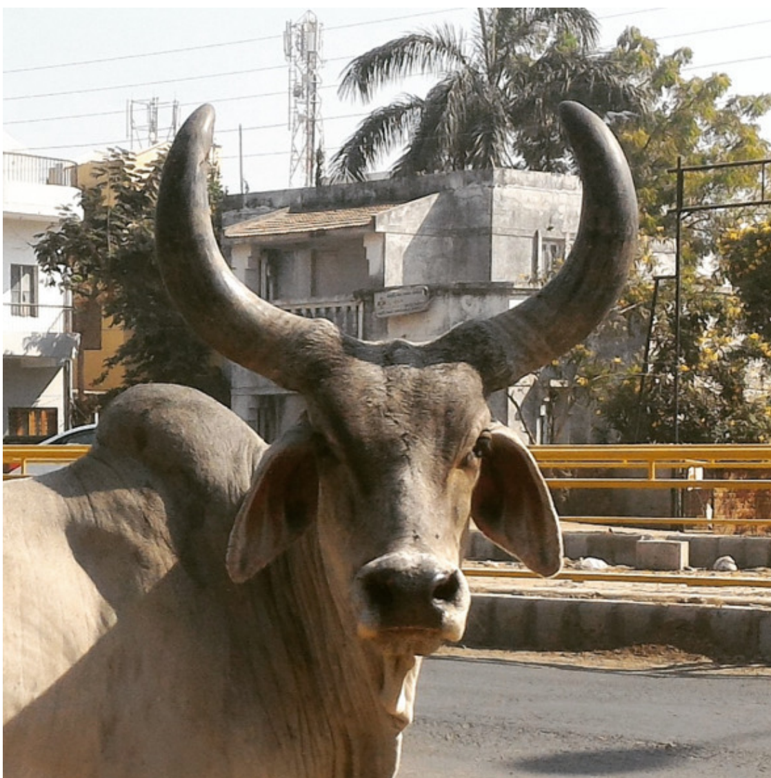
Индийская корова на проезжей части

Коров почтительно обходят или объезжают, повышая на них голос только, когда отгоняют от овощных прилавков на рынке.