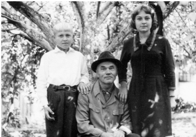
Отец с внуками: Вовой и Людой.

За самоотверженный шахтёрский труд мой отец был награждён многими медалями, в том числе и медалью «За победу над Германией в Великой Отечественной войне 1941—1945 гг.». Имел звание Почётный шахтёр. Умер в 1981 году.