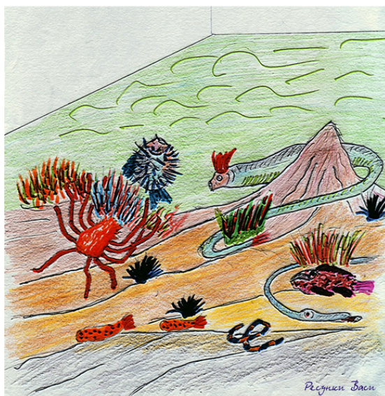
В закрытом аквариуме