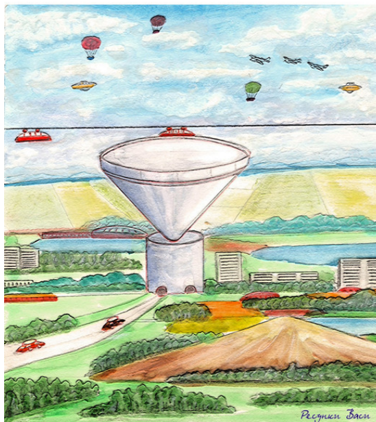
Платформа остановки воздушного трамвая

– Почему все? Не все. Твоя мама астроном, папа космонавт. Оба работают на поверхности Земли. И живем мы на поверхности. Очень многие работают и живут на поверхности Земли. Иначе она так заросла бы всяким чертополохом, что через него не проберешься. Чтобы этого не случилось, за ней надо ухаживать. Земля – это ведь наш большой дом, и этот дом надо беречь. Было время, когда люди не совсем ясно себе это представляли, и поэтому вырубили почти все деревья, сожгли сотнями миллионов лет накопленные в недрах Земли энергоресурсы, загрязнили водоемы. Озоновый слой в верхних слоях атмосферы, охраняющий нас от вредных космических излучений, стал исчезать. Люди стали болеть. Начались наводнения. Многие страны оказались под водой, начались стихийные бедствия, с которыми можно было справиться только сообща всем людям Земли. Вот тогда они объединили свои усилия, чтобы воссоздать прежний зеленый облик нашей планеты. И ухоженная земля стала давать людям много-много продуктов питания, чистого воздуха и воды. А жить под землей оказалось уж не так-то и плохо. Всегда тепло, не нужно столько топлива для подогрева жилищ, как это было раньше, ни дождя тебе, ни грозы, ни грязи на дорогах.